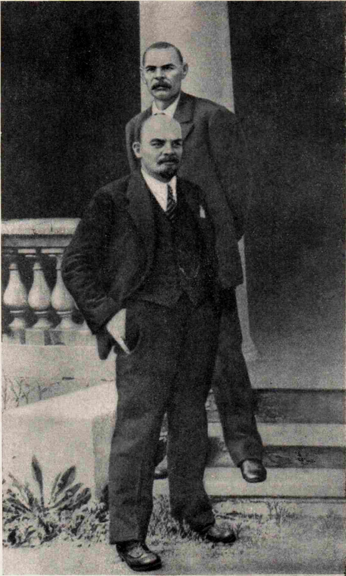
V. I. Lenin ja A. M. Gorki. Kuva on otettu Kommunistisen Internationalen II Kongressin aikana.