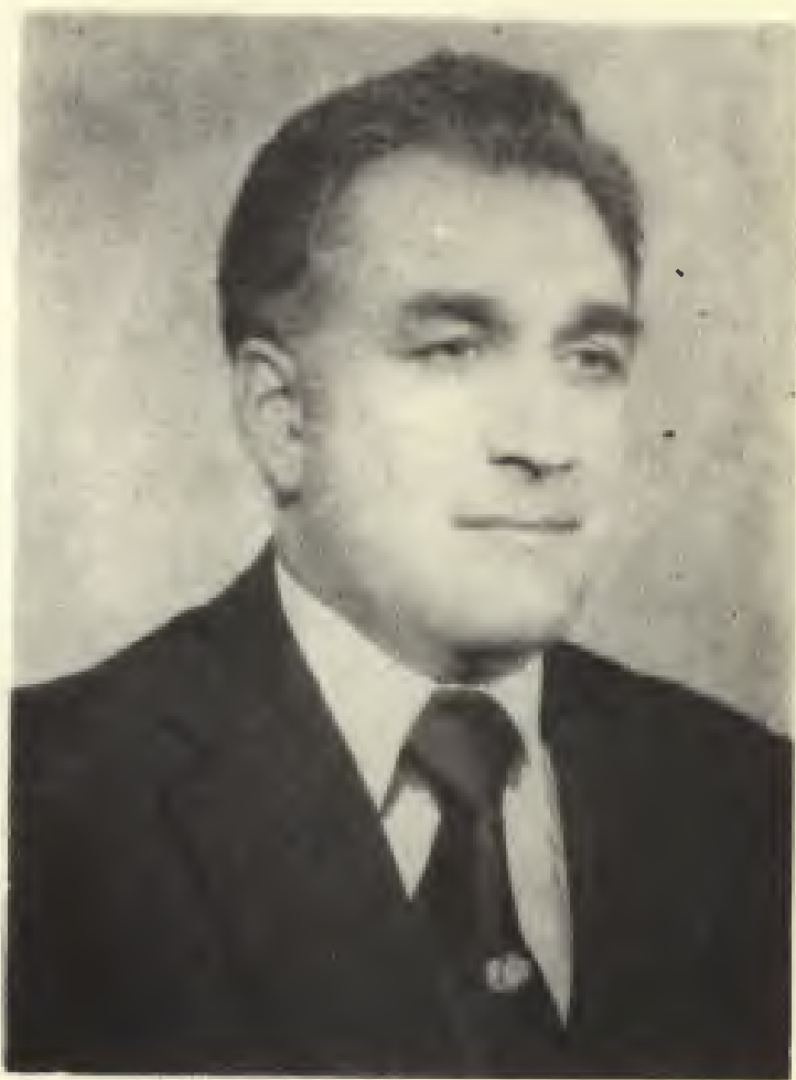
Hafizullah Amin (1921-1979).