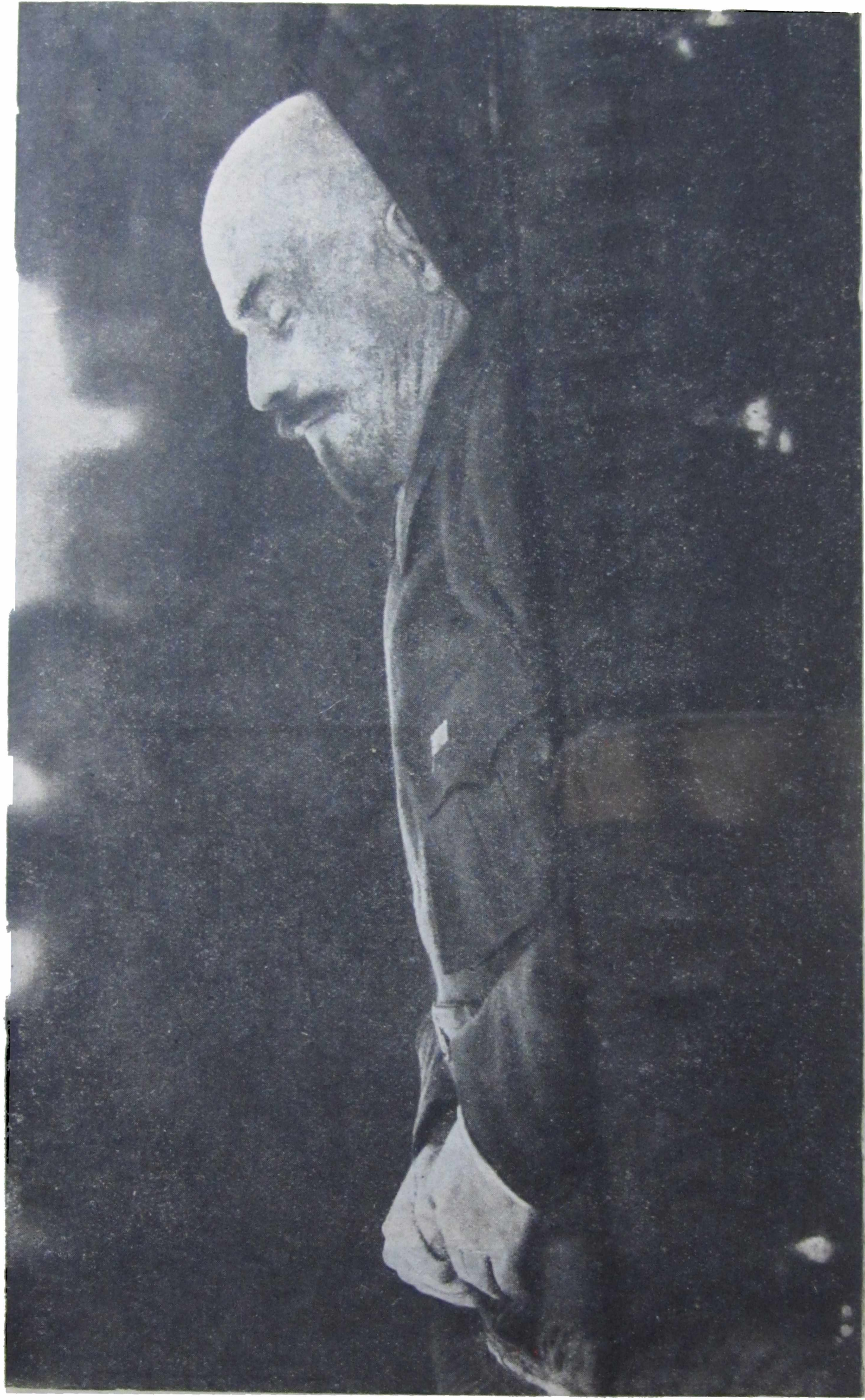
W. I. Lenin arkussa.