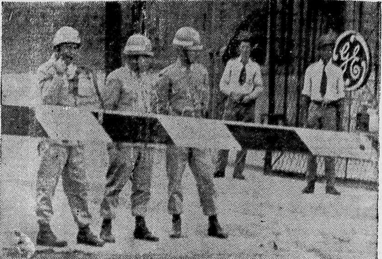
As instalações da GE, entre os bairros Vieira Fazenda, Maria da Graça e Jacaré é um verdadeiro campo de concentração. Mal os operários articulam um movimento reivindicador, abate-se sobre ele a ação da polícia. A foto acima foi feita durante a greve dos operários da GE em 1957.

direitos da empresa, que há dois anos lutam para que lhes seja pago o aumento a que têm direito. A questão está morando na Justiça do Trabalho. A G. E. alega que eles não fazem jus ao aumento porque trabalham por produção. Se a moda pega, certamente a empresa determinará que todos os operários passem a trabalhar por produção.