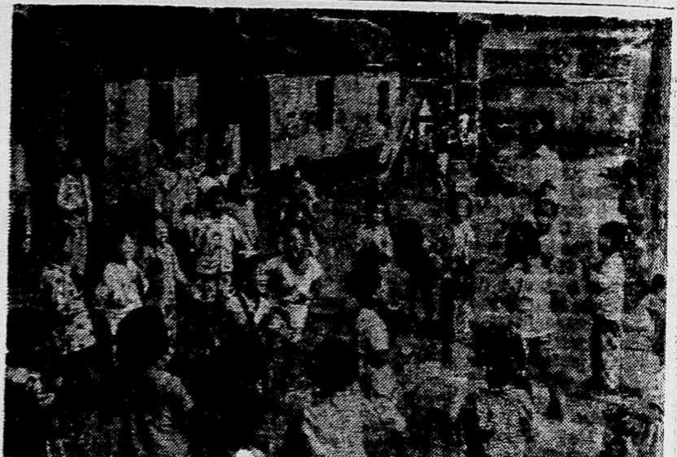
NAS COMUNAS POPULARES — As Comunas Populares da China se espalham por todo o país. O entusiasmo empolga homens, mulheres e jovens. Todos à produção, para dar mais viveres ao povo, mais aço à indústria chinesa! Os filhos dos trabalhadores — de cada brigada de produção — contam com suas próprias cheches e jardins de infância. São simples, mas funcionam. E enquanto os pais trabalham, as crianças brincam.

A contradição se agravando, o governo estará pressionado, com mais força ainda, pela exigência da opinião pública e dos meios econômicos interessados no desenvolvimento do país, a procurar novas soluções, mais avançadas no sentido da verdadeira política externa que o país aspira. E por esse processo que se explica a angústia com que alguns dos atuais responsáveis pela OPA se agarram aos restos do barco naufragado e gritam vitória. O fracasso da «sua» OPA é o seu próprio fracasso político, e eles já compreenderam que o povo focalizou neles — beneficiários ou intermediários do imperialismo — as peças defeituosas que devem ser afastadas dos postos de mando do governo, para que o país possa avançar no caminho do progresso.