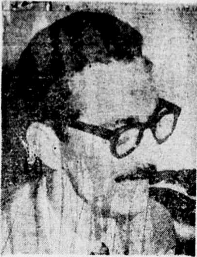
Jânio Quadros, Governador de São Paulo

Na opinião do sr. Jânio Quadros, só existirá anistia, se for a mais ampla».