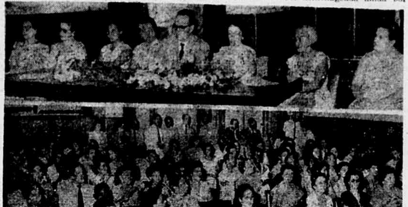
Considerando necessário ampliar a participação de trabalhadoras de todos os Estados, assim como de numerosas organizações femininas, na Conferência Nacional de Trabalhadoras, sua Comissão Nacional deliberou adiar a realização do conclavo para os dias 18, 19 e 20 de maio, na Capital Federal. Entretanto, realizam-se numerosas assembleias locais, conferências municipais e estaduais, que elegem as delegadas que trarão à Conferência Nacional suas reivindicações. Na foto acima: a mesa que presidiu a sessão de instalação da Comissão Nacional e um aspecto parcial do plenário.

A delegação soviética discutiu com o governo inglês outras questões importantes para a manutenção da paz, relativas à segurança europeia. Quanto ao importantíssimo problema da paz e do desenvolvimento, o primeiro secretário do PCUS, Kruschiov, realizou uma proveitosa troca de pontos de vista com o sr. Harold Stassen, conselheiro especial do presidente Eisenhower. Quanto a essa questão os entendimentos prosseguirão entre Stassen e Gromyko.