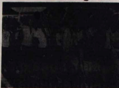
Estudantes, rumo ao Congresso para ouvir o "discurso do Brasil"

O discurso de Ulysses Guimarães foi um líbello contra o regime militar estorotante. Foi também uma resposta aos que na hora da decisão vacilam e sucumbem à "negociação" capitalizadora frente à violência do Planalto. E propôs um programa mínimo de dez pontos para enfrentar a crise (veja o box).