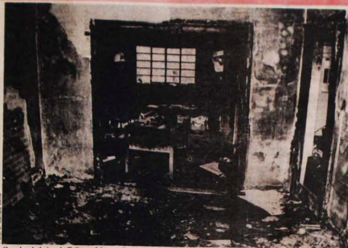
O andar de baixo da Tribuna foi completamente destruído pelas chamas; pouco se salvou

Ficou plenamente caracterizada a ocorrência de dois crimes durante este domingo de Páscoa: primeiro o incêndio e depois o saque. A Polícia Militar e Civil — de âmbito estadual — e a Federal não assumiram a responsabilidade pela interdição da sede do jornal. A 5ª Delegacia de Polícia abriu inquérito, mas até o fechamento desta edição só havia feito a perícia técnica e não ouviu nenhuma testemunha que presenciou o incêndio. A Polícia Federal, por sua vez, apareceu fortemente armada para recolher livros, cartazes e panfletos a fim de fazer uma "análise do conteúdo ideológico do material".