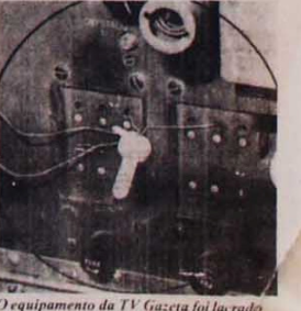
O equipamento da TV Gazeta foi lucrado

Para evitar provocações os presentes se contiveram a máximo possível. Só se manifestaram na hora decisiva: na votação da emenda. Todos que votaram contra ou se ausentaram receberam sonoras vaias e ficaram "marcados". Os que votaram a favor da Dante de Oliveira, principalmente os membros do Pró-Diretas do PDS, foram aplaudidos.