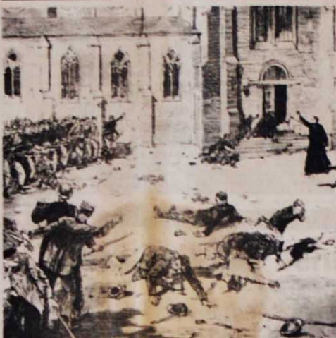
O massacre dos operários na cidade de Fourmies, no 1º de Maio de 1890

De qualquer maneira, deverá ser um 1º de Maio importante, como os mais importantes que o Brasil já viveu. Aqui, recapitulamos experiências de outros Primeiros de Maio, em épocas e países distintos, em momentos de dificuldades, de combates e de vitórias do movimento operário. Seu traço comum e sempre o espírito combativo e a coragem de classe.