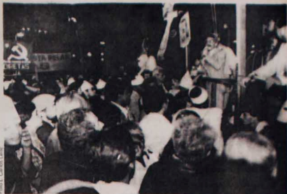
Vigília pró-diretas: pela primeira vez na história, uma manifestação do tamanho do Brasil

Do lado de fora do plenário durante todo o dia havia muita expectativa. Os líderes do pró-diretas faziam e refaziam suas contas. Os indecisos eram assediados por todos os lados. No final, quase às 3 hs. da madrugada, os parlamentares favoráveis às diretas já apesar de cansados não demonstravam abatimento. O sentimento geral era de revolta, indignação e luta. "A luta continua" - era a frase mais ouvida pelos corredores do Congresso Nacional. (sucessal de Brasília)