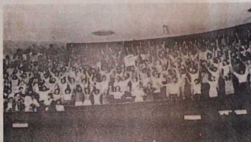
A galeria acompanhou a votação com calma e foi até elogiada pelo senador Dalla

A sessão transcorreu num clima de muita tranquilidade, não tendo sido