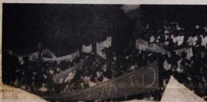
Milhares diante do Placar das Diretas, na Praça da Sé em S. Paulo

Nunca o Brasil viveu momentos como a véspera e o dia da votação da emenda Dante de Oliveira. Nas capitais e nos mais distantes rincões do país ocorreram manifestações e vigílias pelas diretas. Professores e estudantes das universidades federais paralisaram as aulas. Através de serviços de som improvisados, a população burlou a censura ao Congresso.