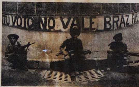
Os guerrilheiros em nova ofensiva no segundo turno da farsa eleitoral

No dia 23, a opinião pública norte-americana e internacional, estarecida e indignada, tomou conhecimento de denúncias sobre a participação da CIA na elaboração