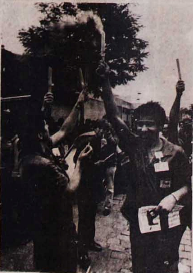
Operários soltaram rojões pelas diretas já

"Se não passar a emenda, o país vai afundar. Os militares vão arrasar de vez com a nossa pátria. E o pior: nós, os operários, é que vamos nos lascar mais", afirma, convicto, um trabalhador do torno automático da Pado, na mesma região. Mais de 200 operários da firma saíram da fábrica para acompanhar o comício e dezenas deles soltaram rojões, ao mesmo tempo, para exigir as eleições diretas. Albino, um cipeiro da empresa, pegou no microfone e desanunciou: "O Figueiredo, o Delfim, todos os sacanetas do governo, são os culpados pela nossa situação de salários baixos, de carestia. Eles não querem sair do governo e se a emenda não for aprovada, nós temos que partir para greve geral."