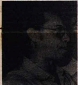
Haroldo Lima quer mobilização popular

Com seu gabinete lotado, o presidente do PMDB exortava à continuidade da luta. "Esse resultado terá repulsa de toda a nação e isso nos fortalece para prosseguir lutando. Convido o povo que aqui esteve para retornar brevemente, quando então iremos comemorar a vitória definitiva", afirmou Ulisses Guimarães, acrescentando: "Iremos ganhar, tenho certeza. As eleições diretas virão