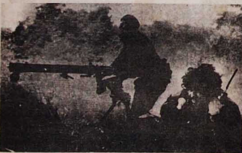
Os mercenários da Arde tiveram que fugir de San Juan del Norte

Com efeito, a situação é séria. O desemprego já atinge cerca de 1 milhão de trabalhadores, cerca de 10% da população economicamente ativa do país, sem contar os milhares de emigrantes que vagam pelos países da Europa Ocidental. A dívida externa, de mais de 20 milhões de dólares, é uma das maiores do mundo em termos per capita, representando metade do PNB. Assim, as conseqüências do "socialismo" autogestionário iugoslavo são miséria para o povo e submissão do país ao imperialismo. (Agênio Silva)