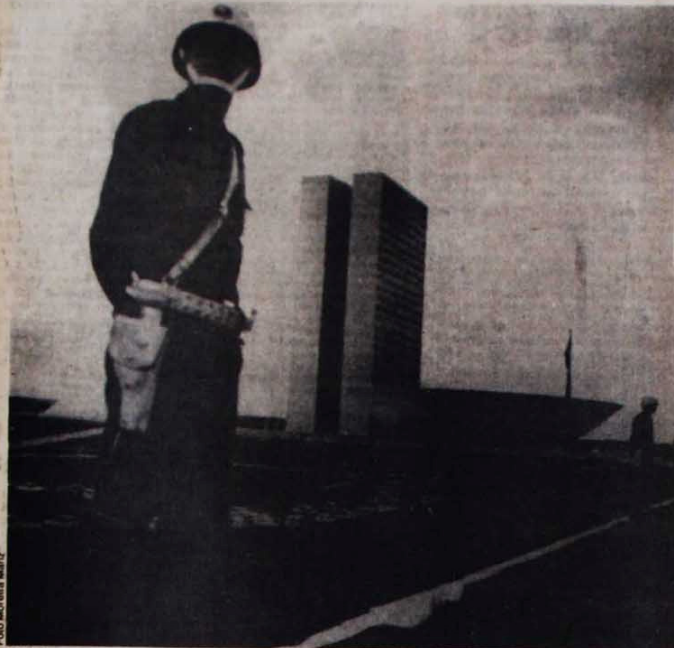
Soldados cercam o Congresso Nacional, sob o comando do truculento general Newton Cruz