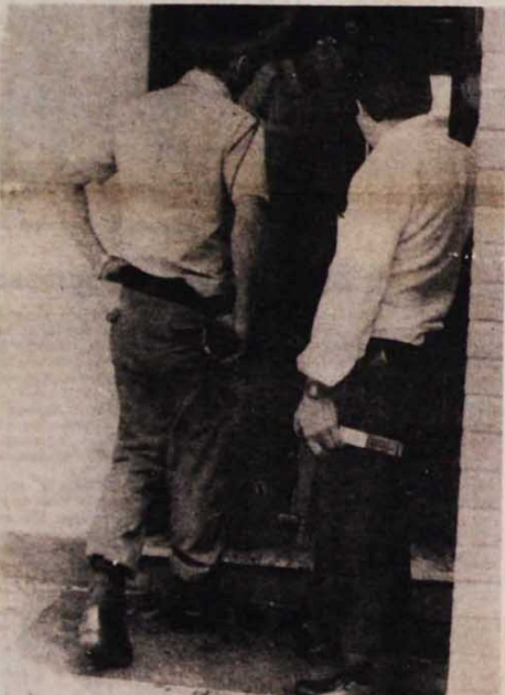
Policiais militares e federais, armados, ocuparam a TO

Durante as 36 horas em que o prédio da Tribuna ficou sob custódia da polícia, ocupado por soldados da PM e agentes da Federal, processou-se um saque que trouxe mais prejuízos que o incêndio. Foram roubadas 8,5 mil fotografias do arquivo, uma teleobjetiva e outros objetos. Enquanto isso os policiais, com revólveres e até metralhadora em riste, não deixavam ninguém entrar ou sair da casa onde funciona a Redação.