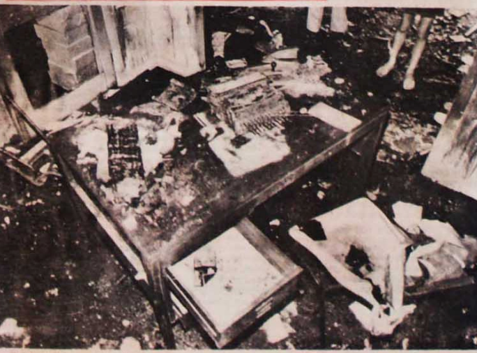
Uma mesa destruída mostra a violência com que o fogo se propagou, destruindo parcialmente o jornal

Depois que os bombeiros apagaram o fogo, viam-se os restos calcinados onde funcionava a administração e a sucursal de São Paulo. Estantes, escrivaninhas, telefones e máquinas de escrever, derretaram ou viraram cinzas. No cômodo do arquivo, o fogo derrubou o telhado, mas uma parte escapou das chamas pela ação dos bombeiros. Apagado o fogo, outro crime se seguiria, desta vez sob a forma de saque.