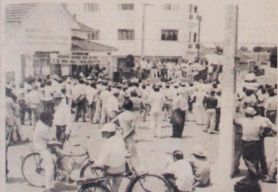
Manifestação no norte do Paraná: pela aplicação do Estatuto e pela reforma agrária

O único fato a lamentar foi a não-unificação dos movimentos: de um lado ficaram os dirigentes da Federação dos Trabalhadores na Agricultura, mais moderados e vacilantes; do outro, os sindicatos que formam uma "articulação dos autênticos" para concorrer à Fetaesp na próxima eleição. Este fracionamento prejudicou o movimento dos camponeses paranaenses, que por seus interesses, bandeiras e objetivos é um só.