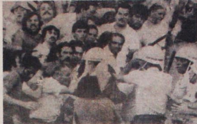
Polícia: pivô e patrocinadora da violência nos estádios.

Lênin, continuando o raciocínio citado no primeiro parágrafo, aponta: "O resultado da revolução depende do papel que a classe operária nela desempenhar, e de se limitar a ser um auxiliar da burguesia... ou de assumir o papel de dirigente da revolução popular."