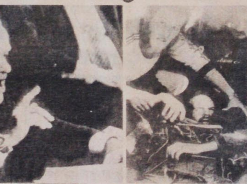
Piloto americano abatido pelos sírios.

A prova disto está na sucessão de acontecimentos que se desenrolaram após o retorno de Shamir a Israel. No sábado, 3 de dezembro, aviões da força aérea israelense bombardearam bases sírias nas montanhas centrais do Líbano. No dia seguinte, aviões norte-americanos bombardearam exatamente o mesmo alvo, sendo que