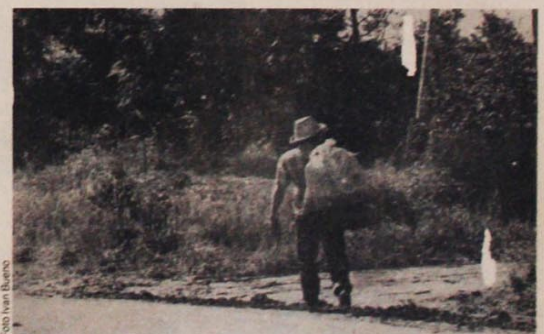
Brasilgaúchos: sem terra no Brasil, sem terra no Paraguai, sem ter aonde ir