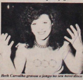
Beth Carvalho gravou o jongo no seu novo disco

A sambista quer a união para pôr fim ao “sistema capitalista submisso e reacionário”. Veja na página 7