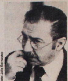
Stábile: corrupção em família

Outros roubos realizados no BNCC: em 1981, uma cooperativa gaúcha recebeu um financiamento com juros abaixo dos fixados pelo Banco Central; no Paraná, um parente próximo do ministro Stábile conseguiu descontar no banco das cooperativas uma duplicata de Cr$ 75 milhões, por uma venda fictícia; outro parente do ministro faturou alto, nu-