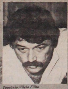
Teotônio Vilela Filho

"Por essas razões, levando em conta o exemplo dignificante de combatividade e honradez que o maior homem público da atualidade, o senador Teotônio Vilela, é que, nesta Convenção, em defesa do partido e para continuar a luta encetada por ele para resgatar a pura fisionomia oposicionista do PMDB, nós constituímos no 'Grupo Teotônio Vilela' para, dentro do PMDB que constituímos em nível nacional e em todos os estados, continuar a nossa luta".