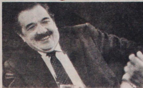
Alfonsín terá de enfrentar com coragem a pesada herança dos militares, os "desaparecidos" e as Malvinas.

O fiasco do regime militar argentino sintetiza o fracasso de todas as ditaduras militares que se instalaram no nosso continente nas duas últimas décadas. Os generais fascistas portenhos tomaram o poder a 24 de março de 1976, com os mesmos argumentos de sempre: bota a "casa em ordem", exterminar a subversão e acabar com a corrupção. De lá para cá, implantaram um regime de terror bestial: mais de 20.000 pessoas foram assassinadas ou "desaparecidas" pelos milicos. Revelações recentes de um oficial argentino preso na Europa, dão conta de que era prática comum jogar presos políticos de avião ao mar. Isso sem falar na tortura indiscriminada, usada até em crianças e mulheres grávidas.