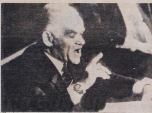
Shamir (acima) assina acordo com Reagan para agressão aos árabes.

Ao voltar de Washington, Shamir afirmou que o principal objetivo do novo pacto com os Estados Unidos era deter a crescente influência e envolvimento da União Soviética no Oriente Médio. Para isso, já há algum tempo o social-imperialismo bate em franca retirada na região, perante a agressividade do imperialismo ianque. O acordo Shamir-Reagan insere-se, na verdade, na estratégia agressiva de Washington, voltada no momento para a utilização direta de tropas americanas e para a ocupa-