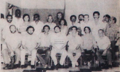
Os membros da chapa União e Luta querem dinamizar o Sindicato

De 9 a 16 de dezembro, ocorreram as eleições para a nova diretoria do Sindicato dos Metalúrgicos do Rio de Janeiro. Representando uma categoria de 150 mil trabalhadores, este é o segundo maior Sindicato operário da América do Sul. Neste sentido, a eleição tem importância decisiva para os rumos do movimento sindical brasileiro.