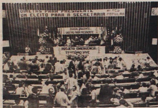
Eleições diretas: uma exigência da Convenção Nacional do PMDB