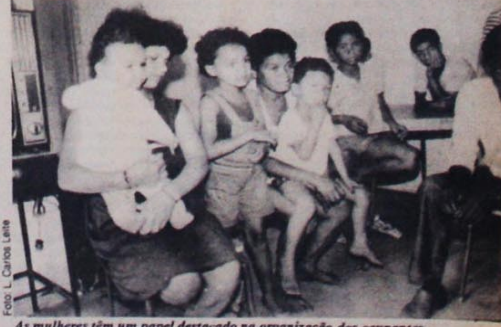
As mulheres têm um papel destacado na organização dos ocupantes

As crianças são uma das maiores vítimas desta situação precária. Existem ali 72 crianças (entre 2 meses e 5 anos) que, em razão da falta de higiene e da má nutrição, estão sendo atacadas pela diarreia; outras gritam à noite, com pesadelos, devido às cenas de violência que presenciaram.