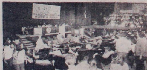
Ato de solidariedade latino-americana: mais de 400 populares presentes.

Mais de 400 pessoas lotaram o plenário da Assembleia Legislativa, em Porto Alegre, no ato público de Solidariedade Latino-Americana, em 1º de dezembro, com a participação de diversas entidades uruguiaias, sindicais e de direitos humanos brasileiras, e dos partidos de oposição. Os manifestantes pediam a unidade dos povos latino-americanos por sua libertação. Vários pronunciamentos condenaram "a política dos EUA para com as nações da América Latina, alvo de constantes agressões e desrespeito ao princípio de autodeter-