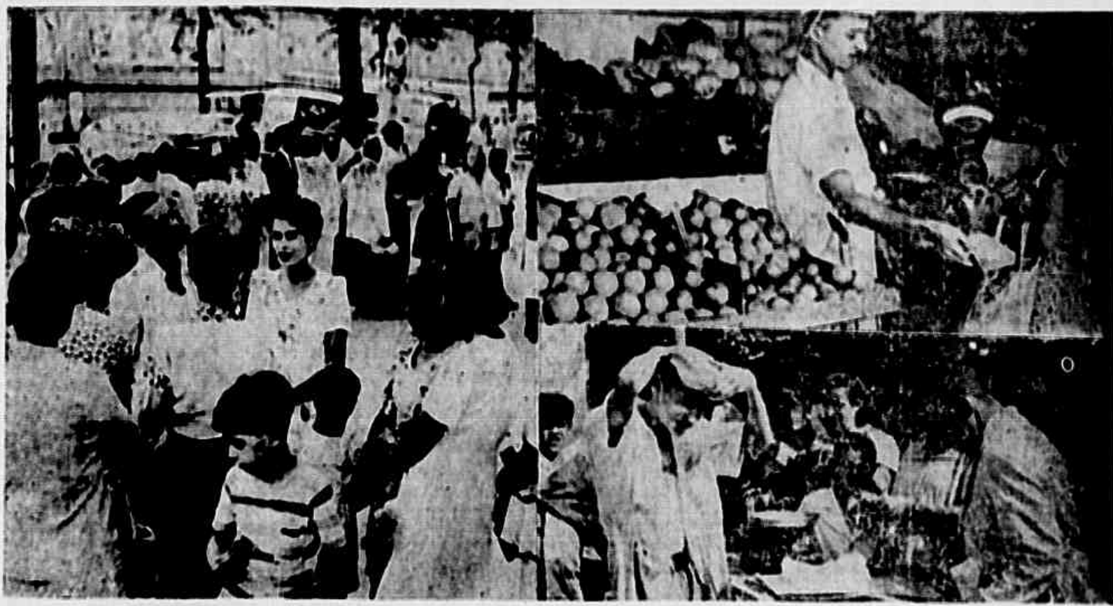
Vendedores e compradores, na feira, defrontam-se com o mesmo problema: a carestia. Não há dinheiro para comprar e, por isso, os negócios são poucos.