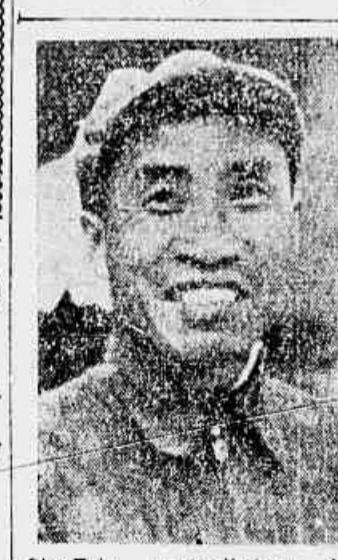
Chu-Teh, generalíssimo do Exército Popular chinês

Em face da arbitrariedade suspensão que nos atingiu, o sr. Herbert Moses adotou uma posição capitulacionista, deixando-se dominar pela preocupação de salvar as aparências, por meio de declarações de amor à liberdade de imprensa, ao mesmo tempo em que se consumava tremenda violência contra um jornal.