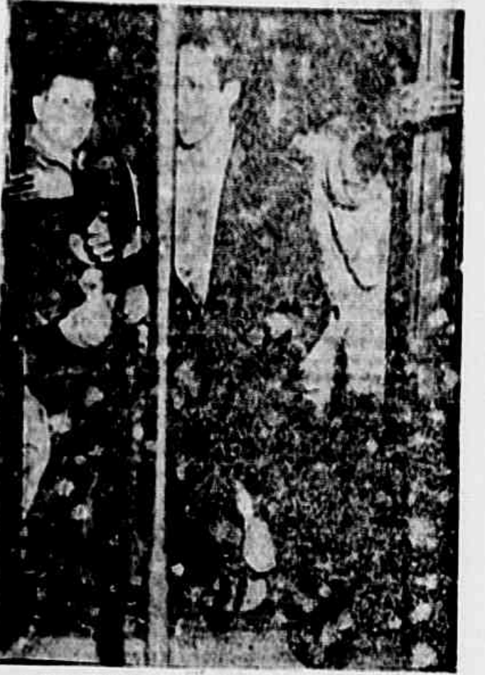
Nossa intenção na tarde de ontem era fazer uma reportagem em Senador Camará. Mas de uma hora e meia contada no relógio da multidão nervosa, ficamos a espera de um trem nas plataformas poeirentas da Estação Pedro II. Lá para as tantas chegamos, enfim, um eléctrico se apresentando como um bicho ferido. De qualquer modo fomos empurrados para o seu interior onde, machucados, viajamos até Deodoro. Sim, até Deodoro por que naquela hora outro trem não apareceu que nos levasse ao destino desejado. O final desta história comum para todos que se servem dos "carros da morte", foi ficarmos empacados naquele subúrbio, até quando a noite nos convenceu da impossibilidade do nosso intento. Não chegamos a Senador Camará. Não chegaríamos nunca naquela tarde, por que "não somos de circo", nem temos a agilidade felina dos que viajam dependurados nas janelas, arriscando a vida em toda curva. Ai está um flagrante colhido por nossa objetiva em Deodoro. Ele diz melhor que todos os comentários. Diz do que custaram para nós os investidos inúteis que levamos a efeito na tentativa de conseguir um lugar nos carros super-lotados, disputados por milhares ao mesmo tempo.

Após cerca de 48 horas de detenção, graças à intermediação de um filho do delegado, empregado da empresa, foram libertados.