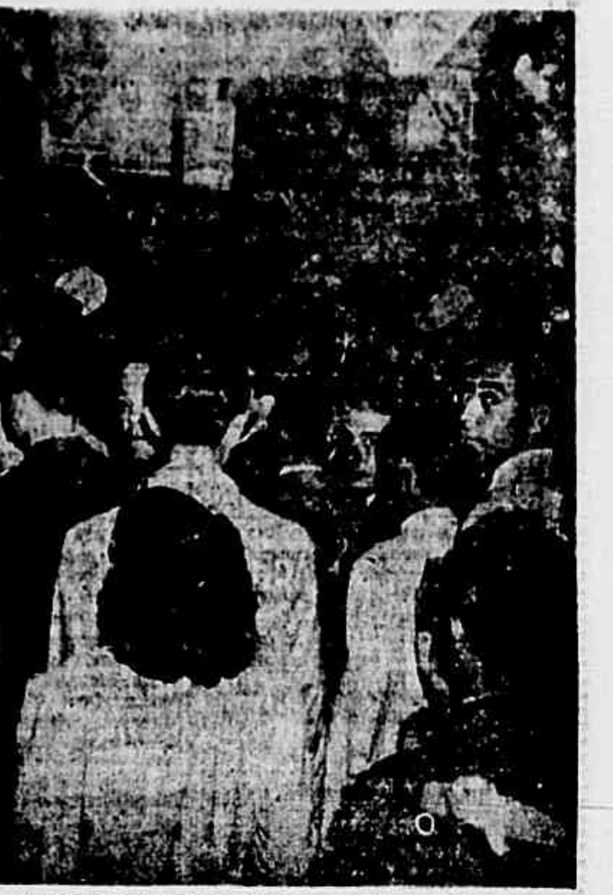
Mais de meio milhão de pessoas viajam diariamente nos 60 e poucos catambiques rodantes da Central do Brasil. Aqui está uma vista da massa humana comprimida nas plataformas da estação Pedro II. Os rostos são cansados, as expressões inquietas. Homens e mulheres, trabalhadores no comércio, funcionários públicos, operários, estudantes e militares. São milhares, mais de 500 mil cariocas residentes nos subúrbios, obrigados a esse martírio duas e mais vezes por dia. Não é preciso repetir aqui o que sofrem. Nenhum carioca desconhece o que se passa ali. Tardava a chegada do "horário" da linha auxiliar. Um oficial do Exército consultava o relógio impaciente. Um homem alongava de vez em quando a vista pela estrada: — Será que não vem mais?... Quê se uma hora...