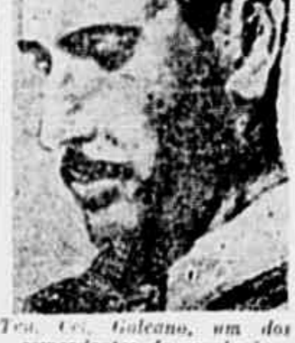
Teo. Co. Gualeano, um dos comandantes da revolução paraguáia

ou desde o princípio. Notícias transmitidas pela emissora rebelde "Voz da Vitória" afirmam que as forças revolucionárias estão às portas de Assunção e que o quartel general revolucionário enviou um ultimatum ao presidente Morinigo "convidando-o a render-se, sob pena de ser denunciado o ataque à capital".