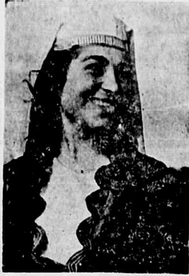
Jovem argentina, com os traços tradicionais de sua região

Pede-se aos srs. Corretores de ações da TRIBUNA POPULAR, o imediato cumprimento ao nosso Escritório, a fim de prestarem suas contas.