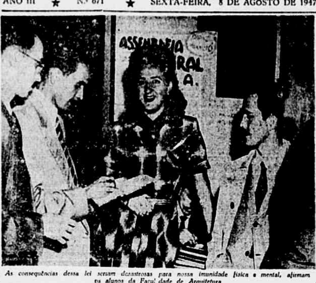
As consequências dessa lei seriam desastrosas para nossa imunidade física e mental, afirmam os alunos da Faculdade de Arquitetura

ANO III ★ N.º 671 ★ SEXTA-FEIRA, 8 DE AGOSTO DE 1947