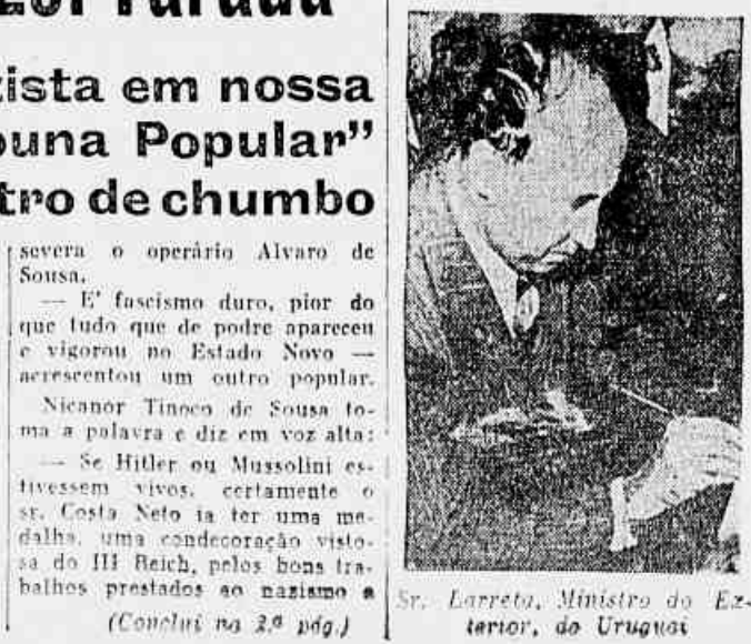
Sr. Larreta, Ministro do Exterior do Uruguai

geira na vida econômica e política da República. Os deputados comunistas promoveram à Câmara (o que foi aprovado por grande maioria) que se interpelessem os ministros da Defesa Nacional e do Exterior sobre a atuação do (Conclui na 2.ª pág.)