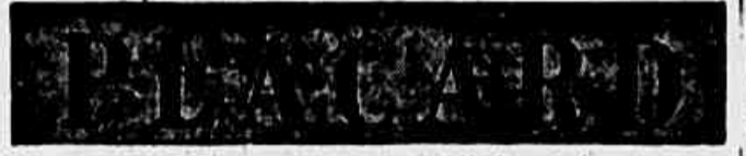
BATALHA DOS TECNICOS

Grande número de jogadores, sua situação, depende o êxito financeiro do certame. GRANDES ESPERANÇAS NO VASCO