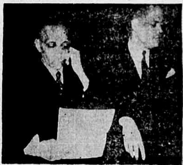
O desembargador Edgard de Souza Carneiro, ao lado de um dos seus advogados, deputado Nelson Carneiro

Um monopólio estrangeiro visando a liquidação da indústria nacional de produtos suínos — O Banco do Brasil já concedeu "anuência de câmbio" para o embarque de três grandes pedidos de banha americana