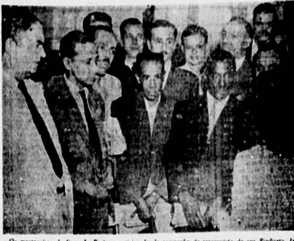
Os marceneiros da firma J. Bastos, participando da campanha de reconquista de seu Sindicato, falando a redator, afirmaram o seu protesto contra a "Lei Tarda"

contra os nossos direitos já vêm regulamentadas para entrar em vigor. PROTESTAM CONTRA A "LEI TARDA" A comissão ao despedir-se, deixou registrado o seu protesto contra a última do ditador tentado impedir ao Congresso a sua "Lei de Segurança", com a qual pretende amarrar o povo e impedir que o proletariado lute por melhores condições de vida. — Se essa lei vier, — declararam, — só será para nos tirar todos os direitos que temos e inutilizar completamente a Constituição. Mas, o proletariado é que não pode admitir nenhuma espécie de Lei de Segurança.