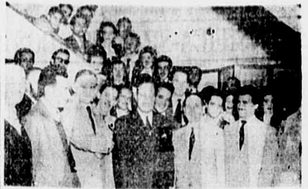
OS COMEDIANTES, EM SUA NOVA FASE, EM FORMA DE COOPERATIVA DE BAIXO TEATRO, apresentaram ontem, à tarde, a primeira, em três dias, de uma série de peças...

1937, esta senhora mostrou-se sempre partidária entusiasta dos métodos fascistas de repressão. Administradora de Hitler, Mussolini e Franco, era perita em elaborar relatórios que "equiparam" tecnicamente o Estado Novo para a sua feroz reação, descobrindo "comunismo" em todos aqueles, sobretudo intelectuais, que não concordavam com os processos da política de Fellatio Muller.