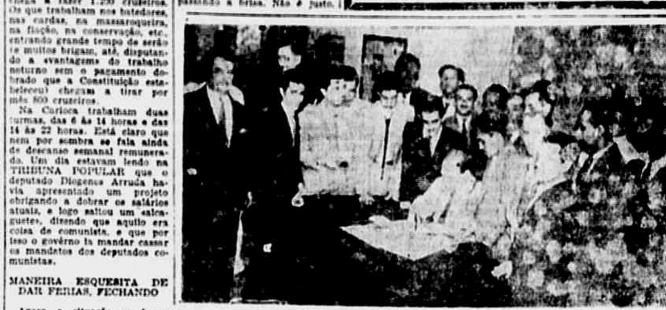
Os ferroviários da Central quando em nossa redação.

Importantes resoluções tomadas na assembleia de sábado - Necessitam o apoio dos Sindicatos da empresa imperialista - Se a Light não pode dar o aumento de salários reivindicado, que pague imediatamente o repouso semanal