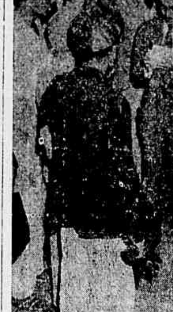
Populares, numa fila das Barcas, condenam a "lei tarada"

PASIONARIA APELA PARA A UNIDADE DAS FORÇAS ANTI-FRANQUISTAS Vibrante manifestação popular, contra Franco, de 40 mil republicanos, na França