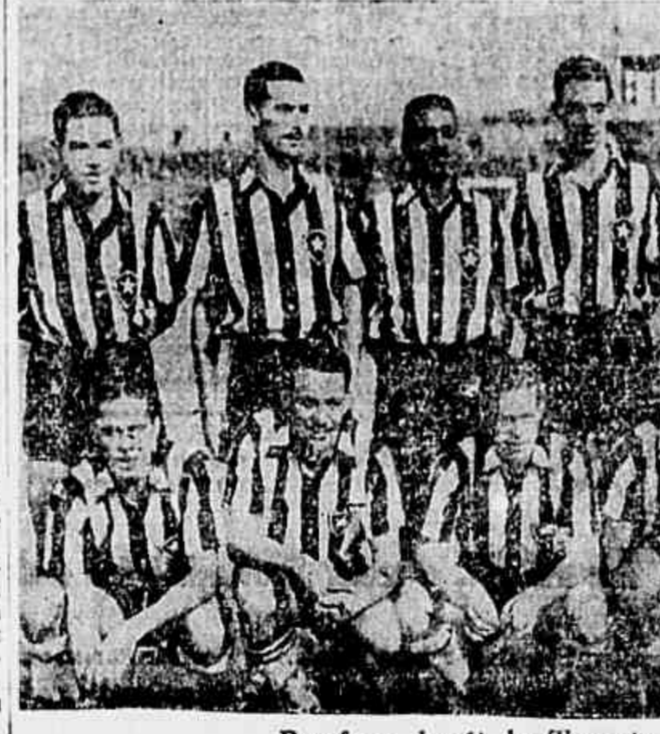
Botafogo, herói do Torneio Início