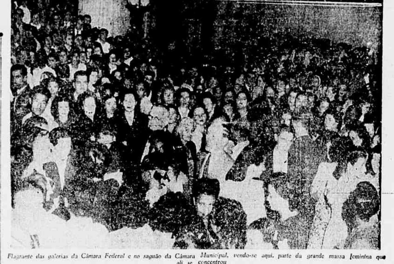
Flagrante das galerias da Câmara Federal e no saguão da Câmara Municipal, vendo-se aqui, parte da grande massa feminina que ali se concentrou.