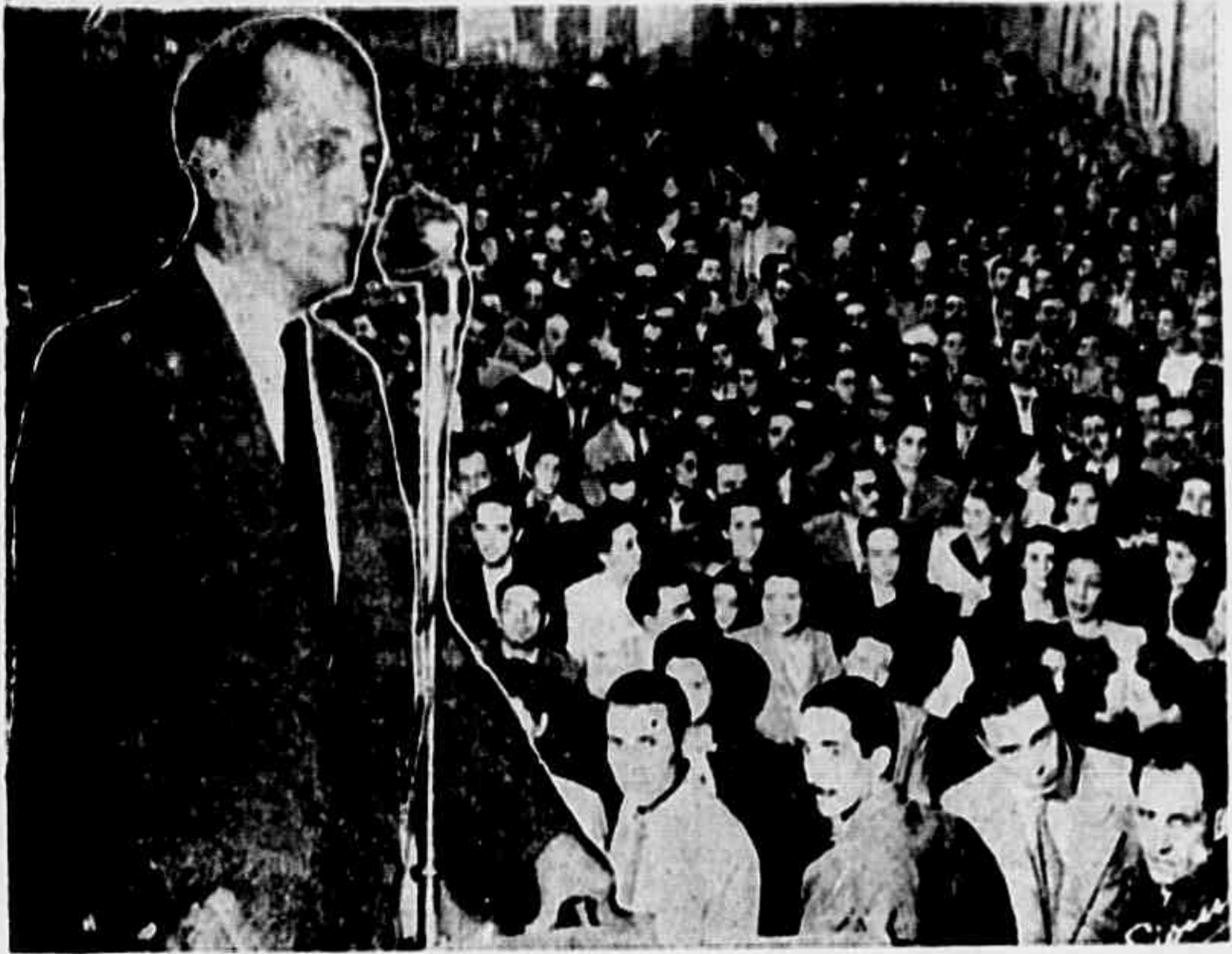
Prestes iniciou suas sabinatas e palestras há dois anos atrás. Em nossa história política não se conhece outra obra educacional, realizada em contacto directo com o povo, tendo a profundidade e a extensão da grande obra do Cavaleiro da Esperança. Clássica, com didactico, pacífica, sem o menor intuito de oportunismo, visando a conscientização — não qualidades que o Senador do Povo demonstrou cada vez mais patente diante das grandes massas que sempre acorreram para ouvir suas palavras e seguir seus conselhos. Episódios tocantes, as cenas mais emocionantes documentam o estreito contacto do povo brasileiro com o seu grande líder. E sempre as suas ideias e as manifestações de confiança no Senador do Povo, realizadas através do Brasil pelo maior e centenas de sabinatas, realização inteiramente nova em nossa vida política, realizadas através do Brasil pelo maior dos patriotas brasileiros.