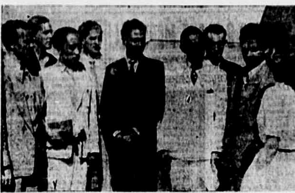
O Delegado Geral do Conselho n. 128 da Fundação Guanabara, acompanhado de operários da mesma Fundação, quando falava à redação