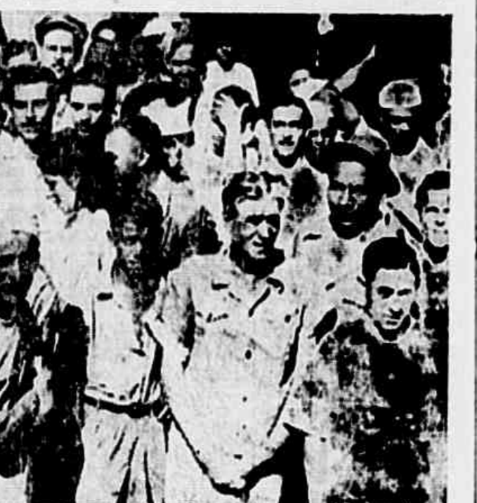
Intensa luta com outros trabalhadores em defesa da liberdade Sindical, agremiação de todos os lados da redação os operários do Moinho Fluminense, que têm reivindicações e um Sindicato subordinado aos patrões e ao Ministério do Trabalho

Por isso, ao regressarem do almoço e encontrarem a reportagem da TRIBUNA POPULAR às portas do Moinho os trabalhadores, ainda em burburinho as suas minúsculas marmittas, logo cercaram o fo-