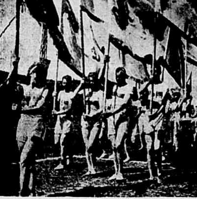
Esta data de hoje celebra-se na URSS o dia da Cultura Física. Um gigantesco desfile de atletas, demonstrando o extraordinário avanço do país nesse importante setor da educação, realizou-se todo ano em Moscou. Jovens de todas as repúblicas, lídis as tradições nacionais que o Estado respeita e cultiva exibem suas danças típicas, realizam números de ginástica rítmica em que ressalta o trabalho de conjunto. A fotografia ao alto, tomada na festa do ano próximo passado, representa um detalhe do belo desfile que o nosso público já teve oportunidade de ver no extraordinário documentário da tela, intitulado "Juventude em Marcha"

Mais cedo do que se esperava, foi dado o sinal do ataque e iniciou-se a ofensiva. Ontem mesmo "O Globo" começou. Na primeira página, em editorial intitulado "O petróleo" (Conclui na 2ª pag.)