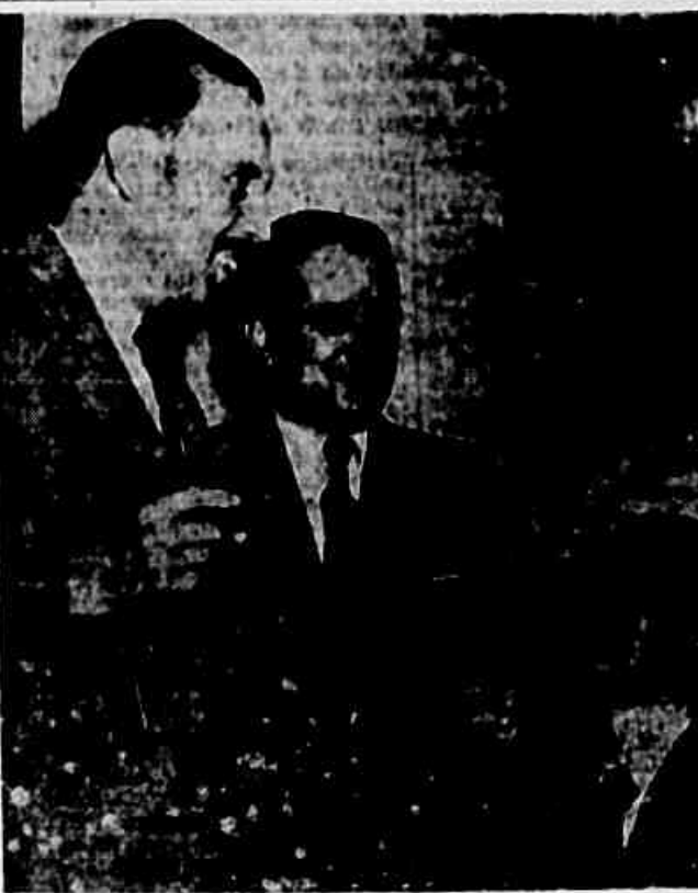
Três homens que "fazem" as leis do esporte...

Compre CAMIRAS, TROPICAIS, LIVROS e BRINCS POR PREÇOS VERDADEIRAMENTE EXCEPCIONAIS CASA DOS CORTES RUA VISC. DE MARANGUAPÉ N.º 6 (JUNTO AO LARGO DA LAPA)