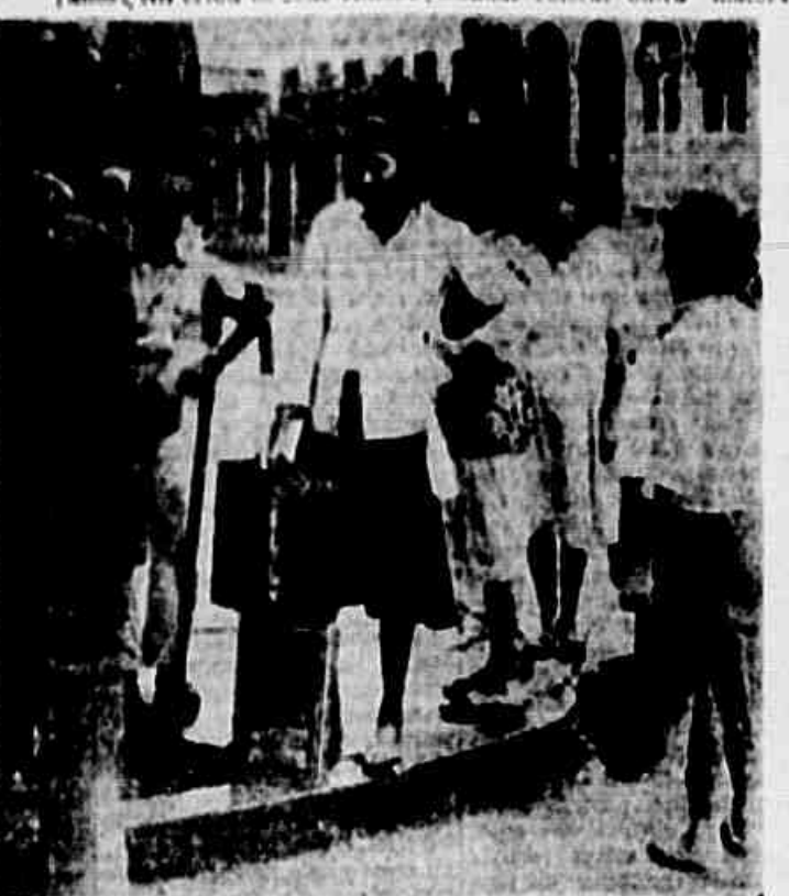
Esta a cidade, nas beas que ficam ao pé das ladeiras. Ali estão, sofrimento a que foram jogados pelo despotismo atual

nal que sempre foi um defensor dos oprimidos do Morro do Pinto. Nesta data faz uma semana que não temos água, fato que nos obriga andar mendigando nas partes baixas do morro, pedindo pelo amor de