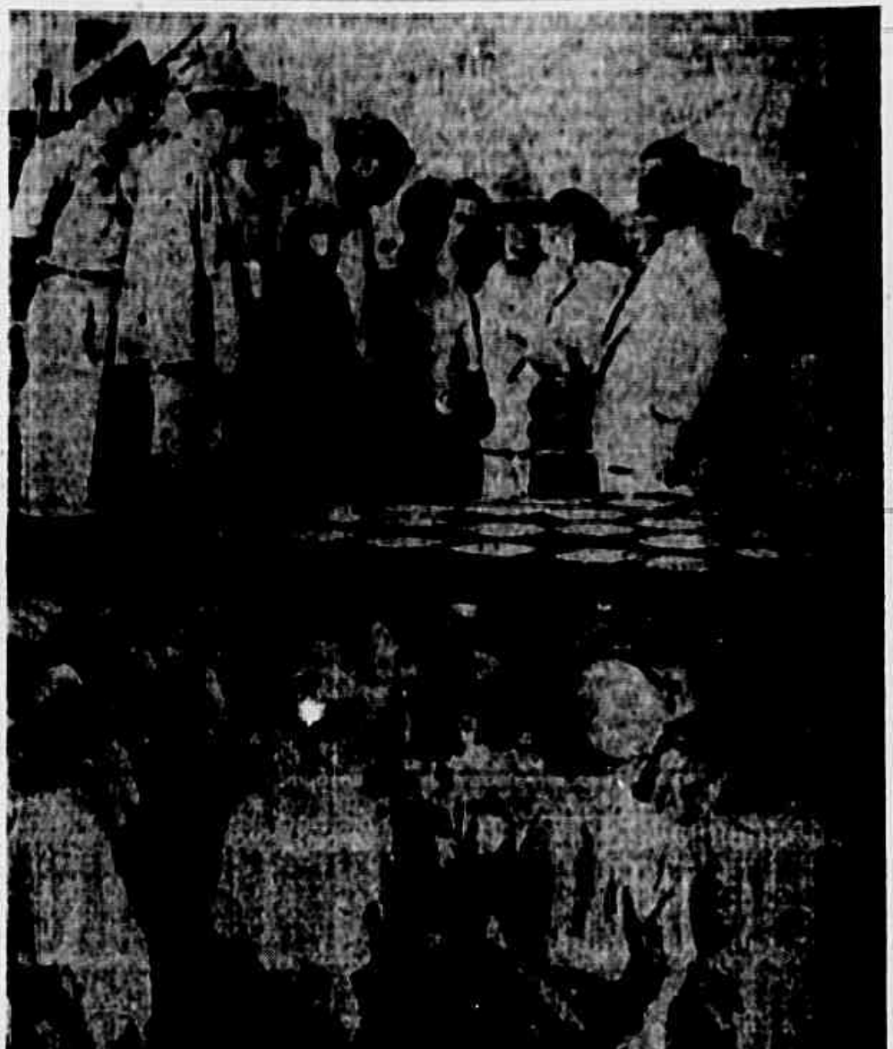
Na fachada do Cais, em vários pontos onde nossa reportagem parou, logo os portuários e os trabalhadores da Emergência se agruparam para falar de suas reivindicações e protestar indignados contra o infame tentativa de pro-censar o Senador Luiz Carlos Prestes

Usando dos mesmos termos que têm usado os demais ma- rítimos que procuram o nosso jornal ou se dirigem ao depu- tado João Amazonas, os mem- bros da comissão desafiam o