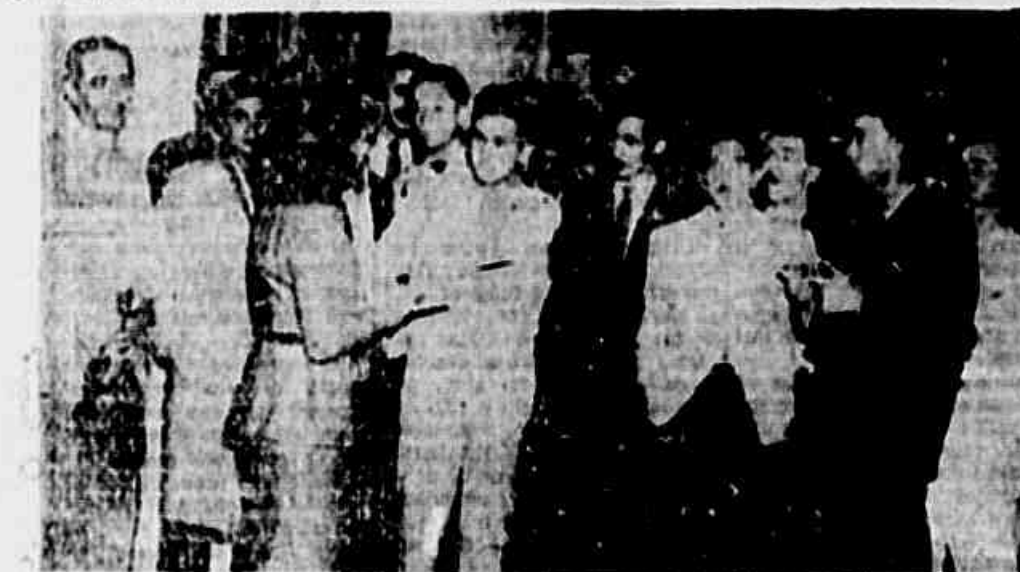
Trabalhadores do Lóide, quando falavam à redatora