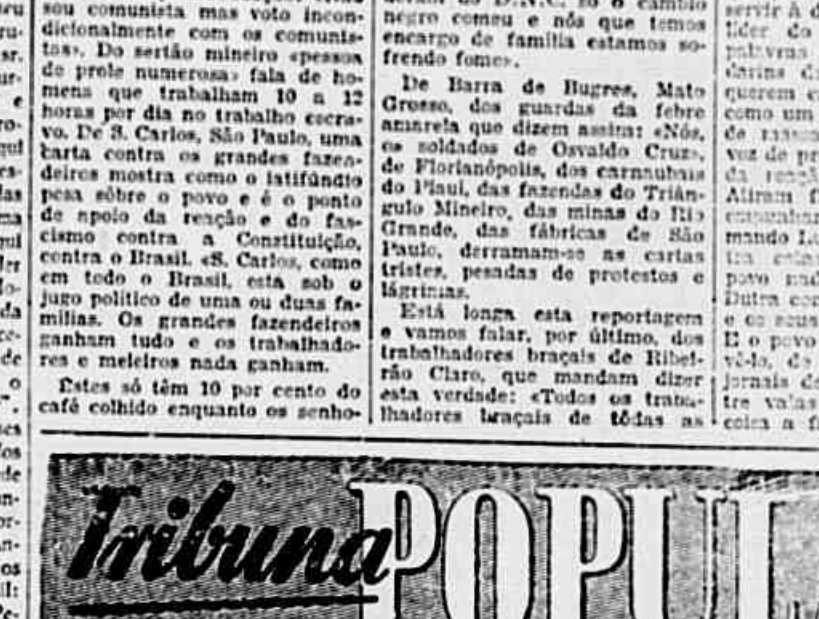
Profetisas Municipais recebem... «DEUS QUE GUARDE V. EXA. E A BANCADA COMUNISTA»... «A BANCADA COMUNISTA»... «A BANCADA COMUNISTA»...