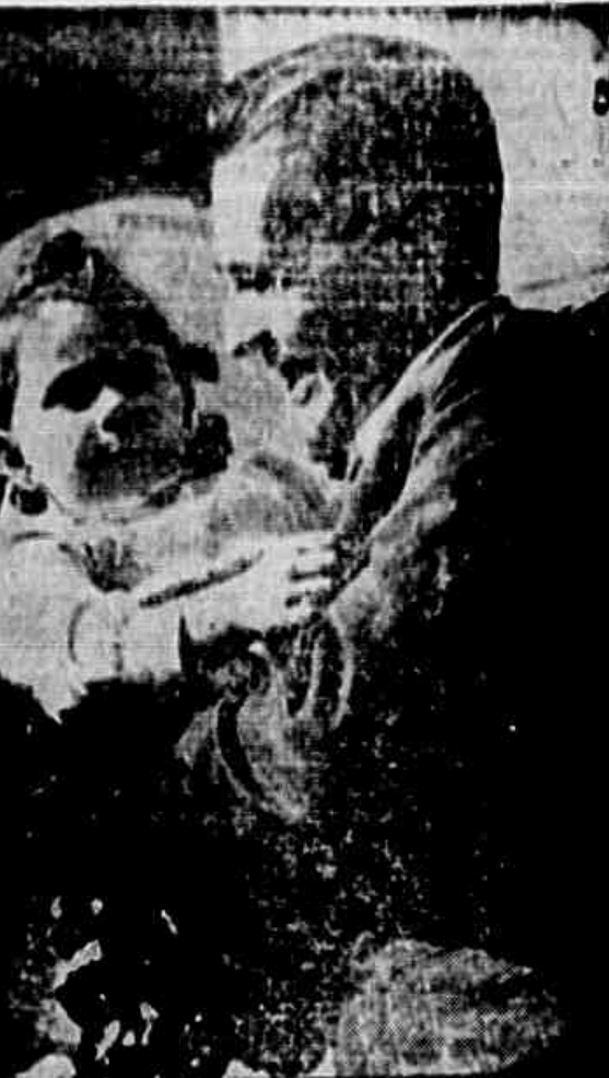
PRESTES é o líder amado de nosso povo. Nas duas suas condições pânticas, uma criança que queria conhecê-lo foi levada ao coreto de onde ia falar o Cavaleiro da Esperança, que a tomou nos braços, abraçando-a. Esse um aspecto do carinho que os brasileiros devotam ao seu grande dirigente.

«A PAZ DE JESUS ESTEJA CONTIGO»... Prestes não deixa uma carta sem resposta. Não seria possível fazer isso de toda a correspondência dos últimos meses. Teríamos que passar algumas tardes lendo-as e transcrevendo-as para uma longa reportagem. Em poucas horas, porém, pudemos colher algumas cartas típicas que mostram bem, em sua simplicidade, o carinho e a confiança das grandes massas pelo seu senador.