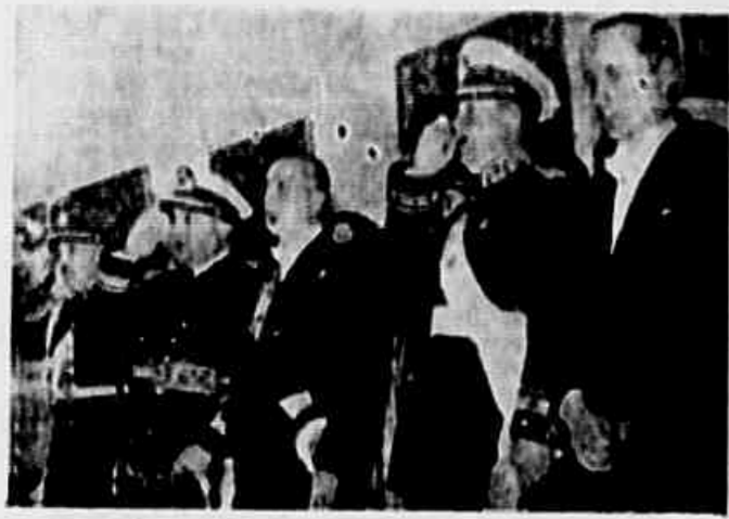
General Justo Tavera e outros durante a solenidade dedicada à independência da Argentina, em Tucuman.