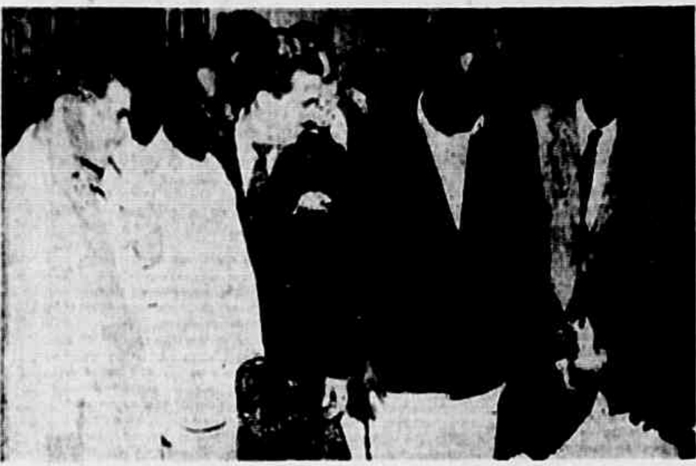
Trabalhadores marmoristas, associados do Sindicato, quando falavam à redação

TERREMOTO, não! TREMOR NA R. DA ALFANDEGA, 230 - A 10 PASSOS DA AVENIDA PASSOS - Grande queima de casimiras, linhos e brins. Casimiras desde Cr$ 130,00 o corte com 2,50. Aproveitem a oportunidade.