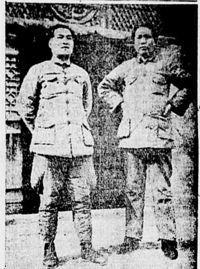
Mao-tse-tung, o grande dirigente do povo chinês em luta pela sua libertação, aparece no lado de Chang-kuo-tao, presidente da República Popular Democrática da China, que domina a maior parte do território chinês. Esses são os democratas e patriotas, caluniados pelas intrigas e provocações de guerra de Chiang-Kai-Shek que tudo faz para impedir a libertação e o progresso da China