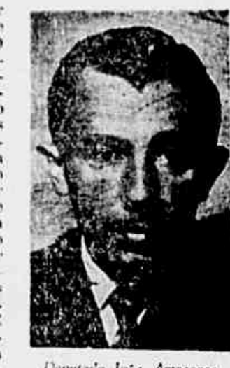
Deputado João Amazonas