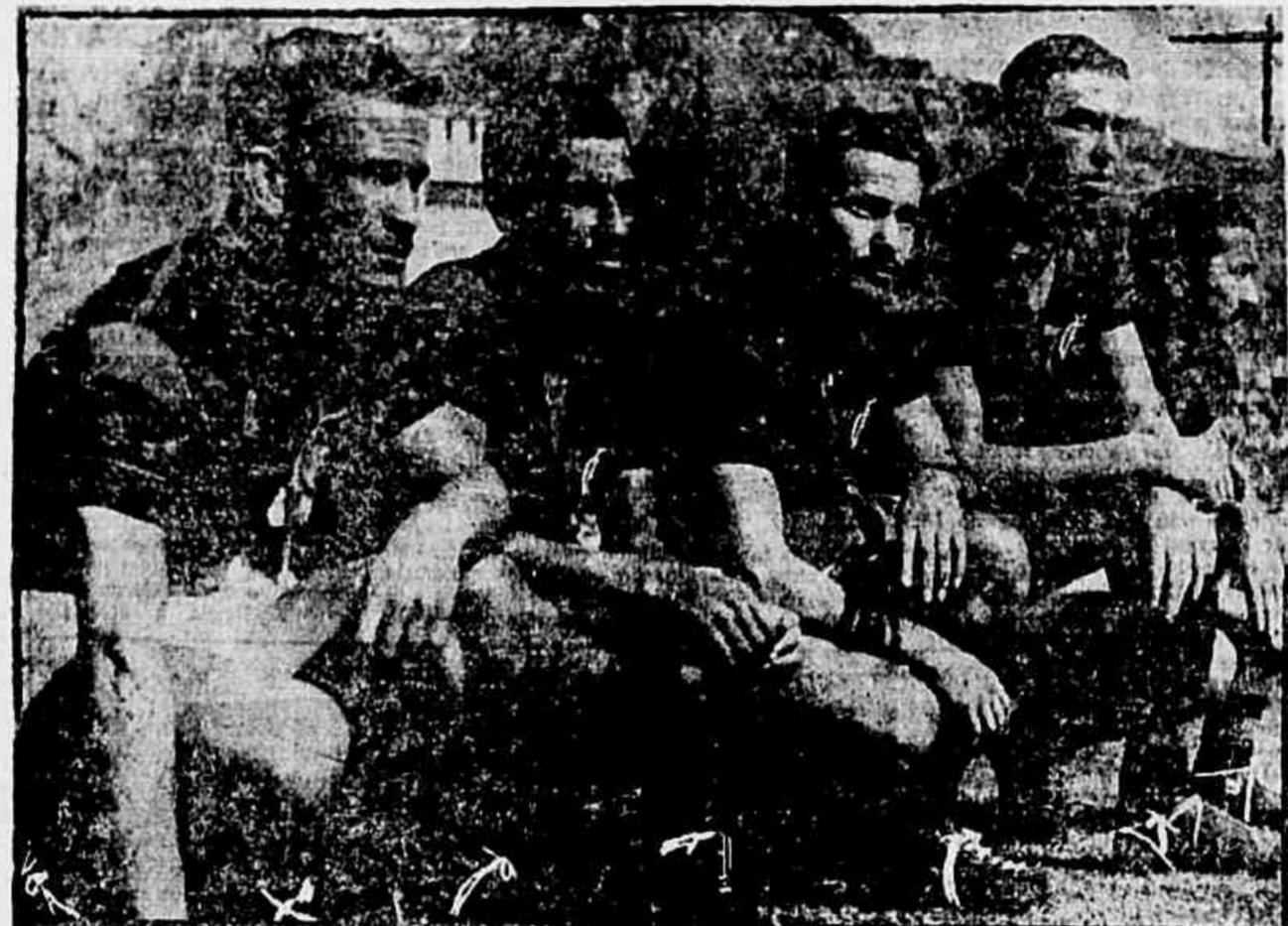
O ataque rubro-negro que jogará o Fla x Flu do Recife

MOBILIARIA DOIS IRMAOS MOBILIA DE TODOS OS ESTILOS Salas e Dormitórios — Fogões, Geladeiras e Colchões A Vista e a Crédito IRMAOS KAC LTDA. Rua Augusto de Vasconcelos, 11-A — Campo Grande