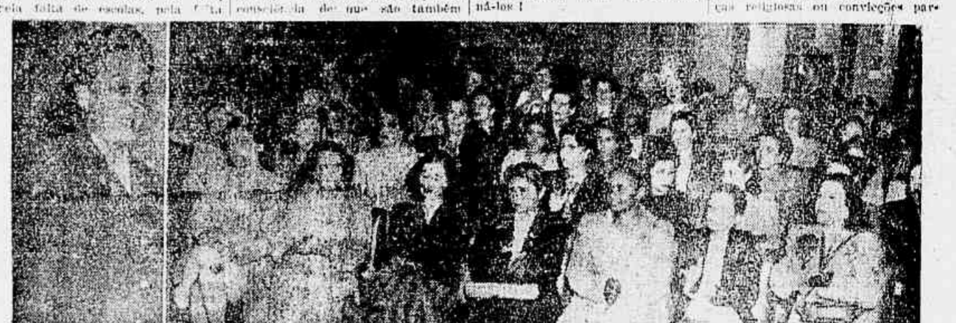
Um aspecto da reunião das donas de casa, ontem, na A.B.I.

de hospitais, enfim, pela intranquilidade em que vive a grande maioria do nosso povo.