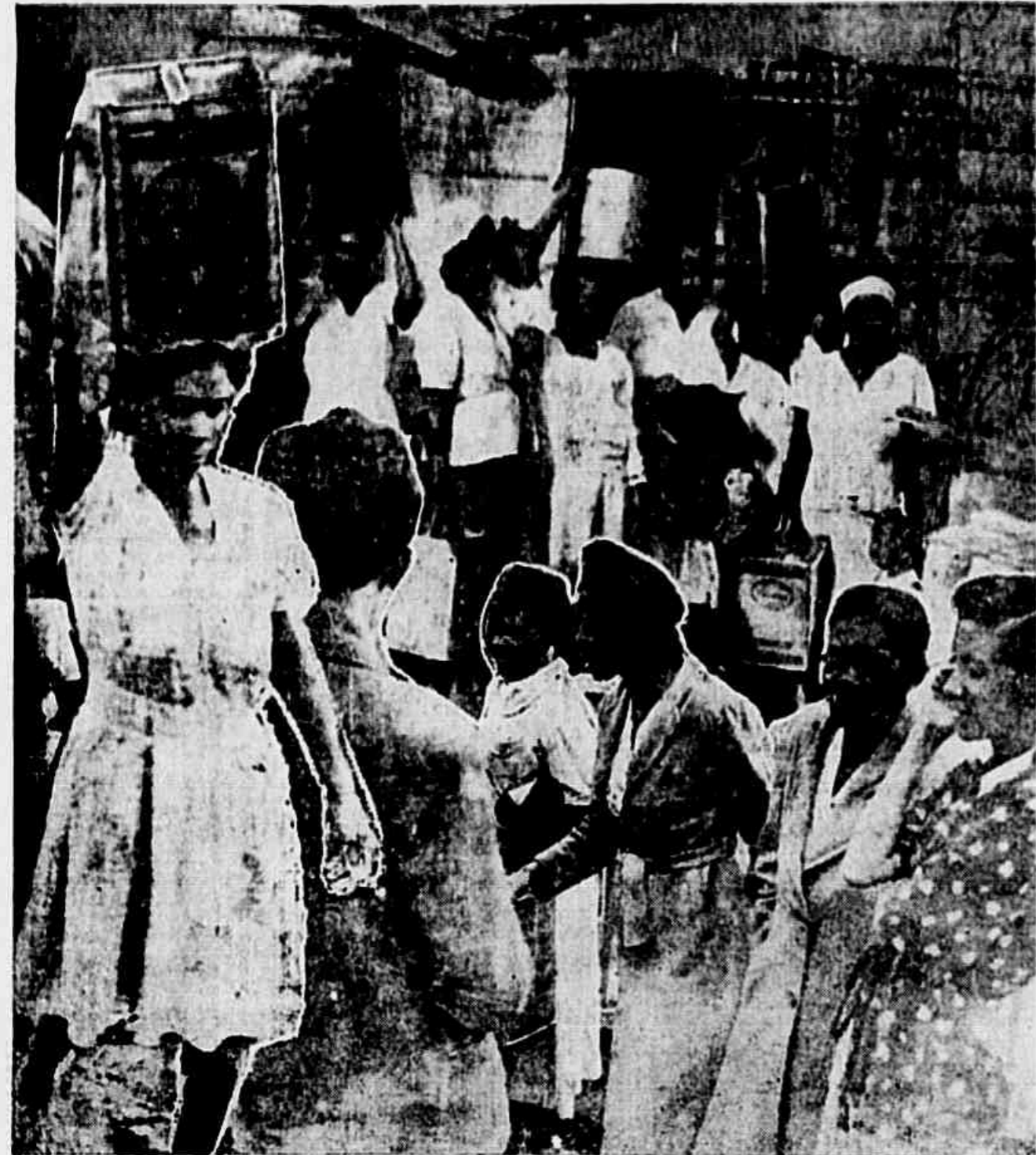
Intraduzível o sofrimento desta gente, forçada a descer penosamente o morro em um retrato da miséria a que foi lançado o povo carioca pelo desgoverno da Ditadura Dada.