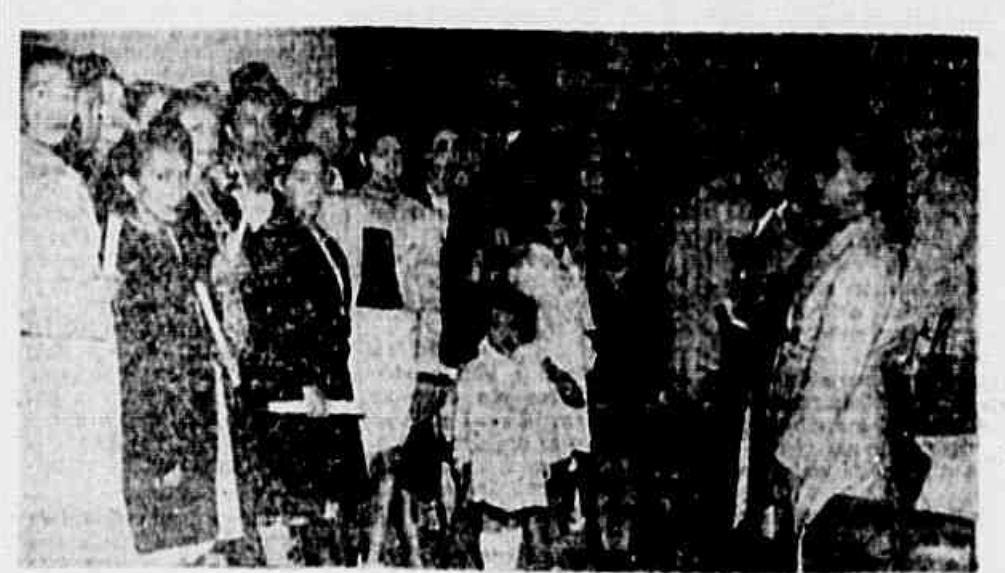
Viúvas dos náufragos de guerra na m. dos salões do Palácio Tiradentes