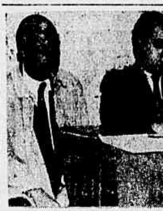
Mesa da assembleia de ontem, no Sindicato dos Eletricitistas