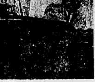
Mesa da assembleia de ontem, no Sindicato dos Eletricitistas

MAJORAÇÃO DE MAIS MIL CRUZEIROS PARA OS QUE PERCEBAM MENOS DESSA QUANTIA — NA MESMA INDICAÇÃO, A BANCADA COMUNISTA A PONTA OS MEIOS DE COBRIR O AUMENTO — SERÃO BENEFICIADOS MAIS DE 44 MIL SERVIDORES — FALA A NOSSA REPORTAGEM O VEREADOR AGILDO BARATA