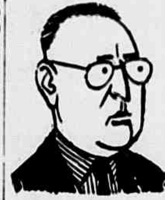
O ministro do "câmbio negro"

AOS NOSSOS LEITORES Não encontrando Tribuna em sua banca, o leitor poderá obtê-la nos seguintes pontos, durante todo o dia: CENTRAL — Marquize de gare de D. Pedro II — Abrigo de bondes PRAÇA MAUA — Avenida Rio Branco, 4 BARCAS — Dentro da Estação da Cantareira Na gare da Estação da Leopoldina Na abrigio do Tabeleiro da Balana Na Praça Tiradentes, em frente à Loja Americana Em Niterói, na estação das barcas Largo S. Francisco, em frente ao antigo Café Jara Rua São José, 53, sobrado.