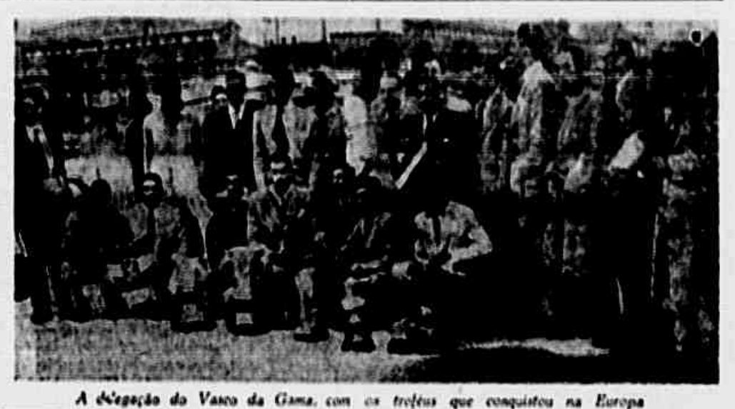
A delegação do Vasco da Gama, com os trejeitos que conquistou na Europa