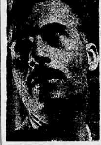
Deputado Carlos Marighella