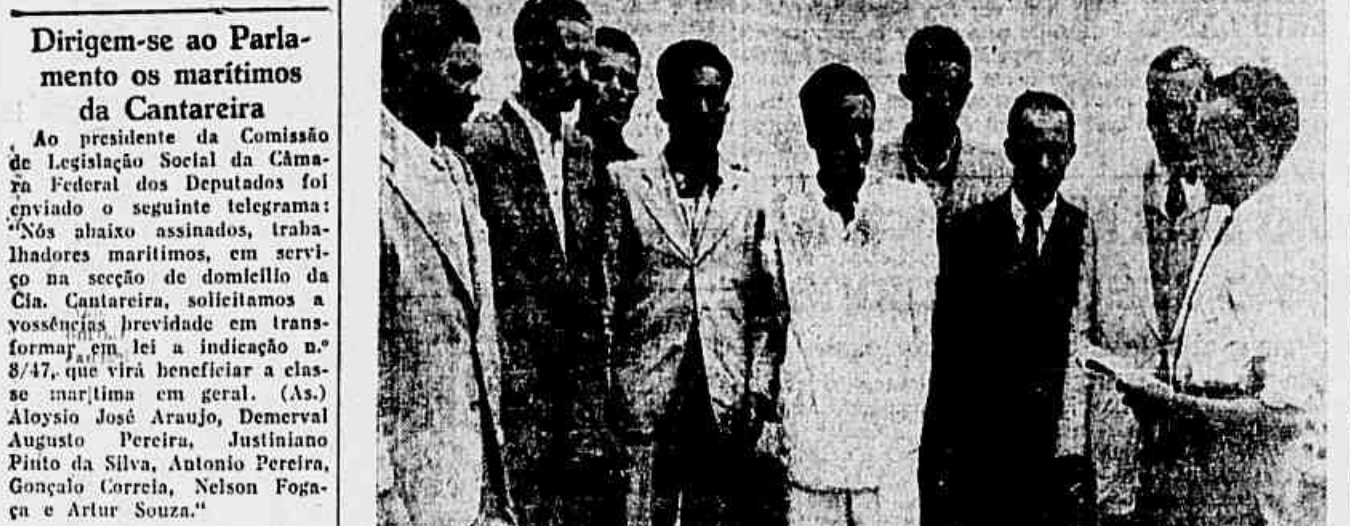
A comissão da trabalhadores de Pirai, quando em nossa redação

Knudsen não levam nunca a sério as nossas leis. Chegam ao ponto até de prender as nossas cartelas profissionais a fim de, sob ameaça, nos forçar a assinar um pedido de demissão. Alguns trabalhadores que exercem as suas atividades naquela empresa norte-americana e que acompanharam a comissão que ontem nos visitou, em solidariedade