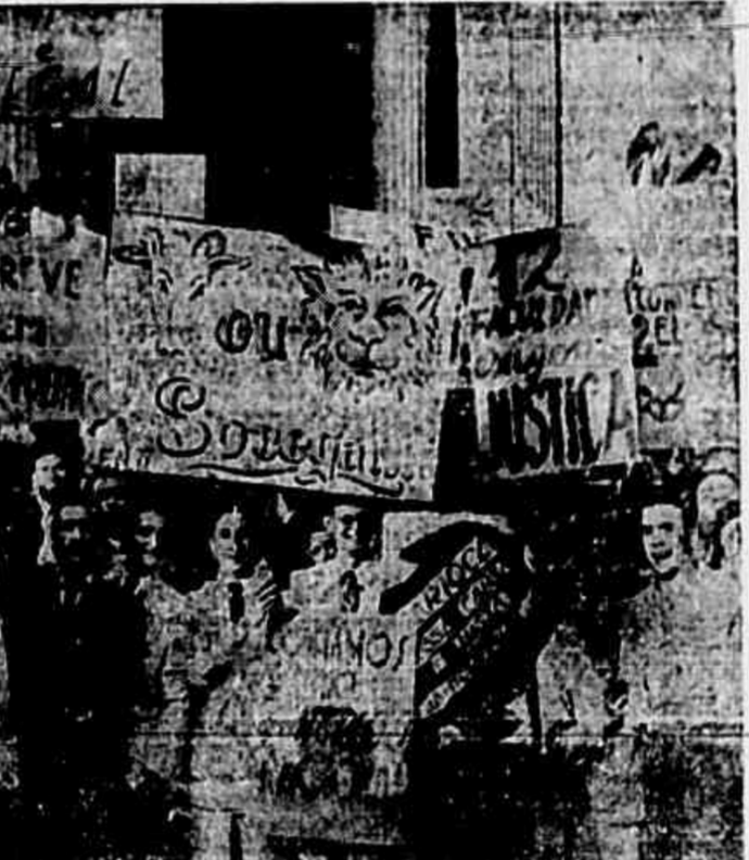
Conduzindo cartazes alusivos ao caráter da greve e ás suas reivindicações, bem como de combate ao sr. Carneiro Leão, grande massa de estudantes percorreu as ruas do centro da cidade. Um cartaz dizia: "Carneiro ou Leão, sossega"; outro, "Um carneiro máu pôs o Conselho a perder!..."