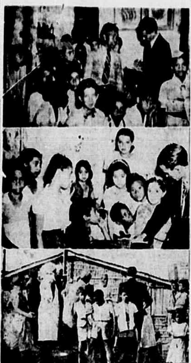
OS 20.000 HABITANTES DO MORRO DE SÃO CARLOS, nesta capital, lutam com inúmeras dificuldades, entre as quais avulta a falta d'água. Toda aquela população tem que se suprir do precioso líquido em duas únicas bicas...