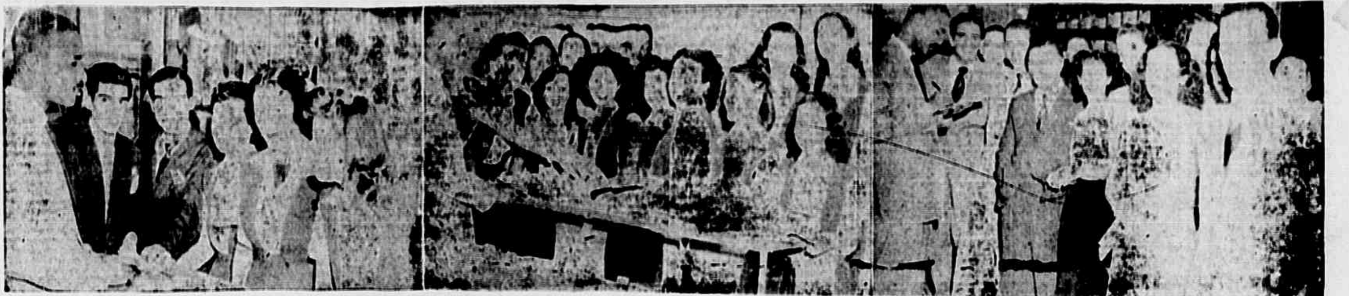
Os comerciantes não têm uma opinião semanal inglesa nos sábados das 8 às 12 horas. Repelem, pois, a infeliz iniciativa do prefeito nomeado pelo ditador Dutra