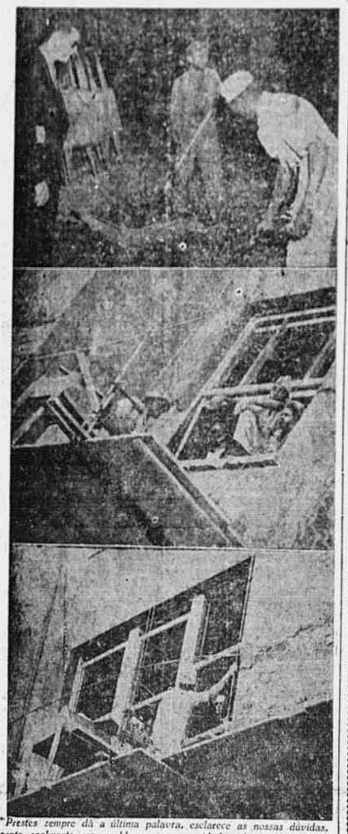
«Prestes sempre dá a última palavra, esclarece as nossas dúvidas, sente realmente os problemas e necessidades dos trabalhadores e de todo o povo brasileiro»