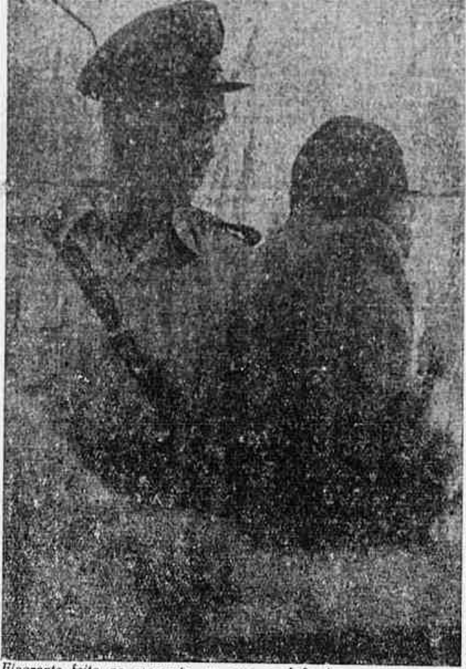
Flagrante feito no momento em que o chefe do grupo, um verdadeiro mastodonte treinado para espantar o povo, tentava arrebatar das mãos de um representante do povo carioca, o microfone com que este se dirigia à massa para, em seguida, inutilizar o amplificador

AS MANOBRAS DOS ESFOMEADORES PARA NOVO ASSALTO A BOLSA DO POVO — ABARROTADO DE TRIGO O NOSSO MERCADO — SUPERLOTADO O ARMAZEM EXTERNO B — ADMIRADOS OS PRÓPRIOS PANIFICADORES COM AS NOTÍCIAS ALARMISTAS DA "SADIA"