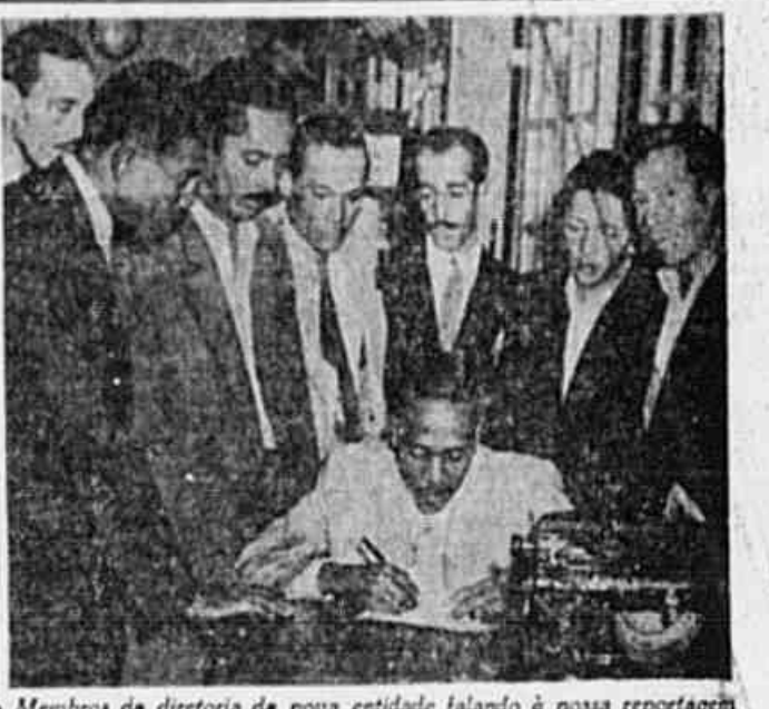
Membros da diretoria da nova entidade falando à nossa reportagem