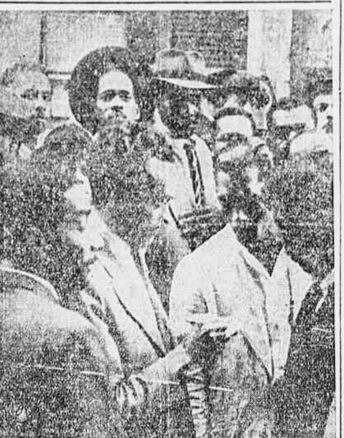
Executando uma forma nova de jornalismo na imprensa do país, TRIBUNA POPULAR vem realizando reportagens-comando. Na tarde de ontem estivemos presentes ao desembarque dos operários da Ilha de Mocangüé, ocasião em que foi feita a fotografia acima. (Reportagem na 3ª página)