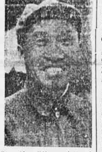
Gen. Shou-Teh, condutor da vitoriosa ofensiva do exército comunista chinês