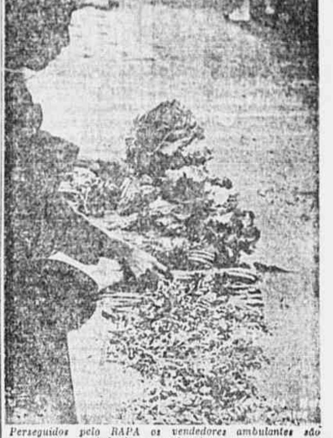
Perseguidos pelo RAPA os vendedores ambulantes são obrigados a vender depressa