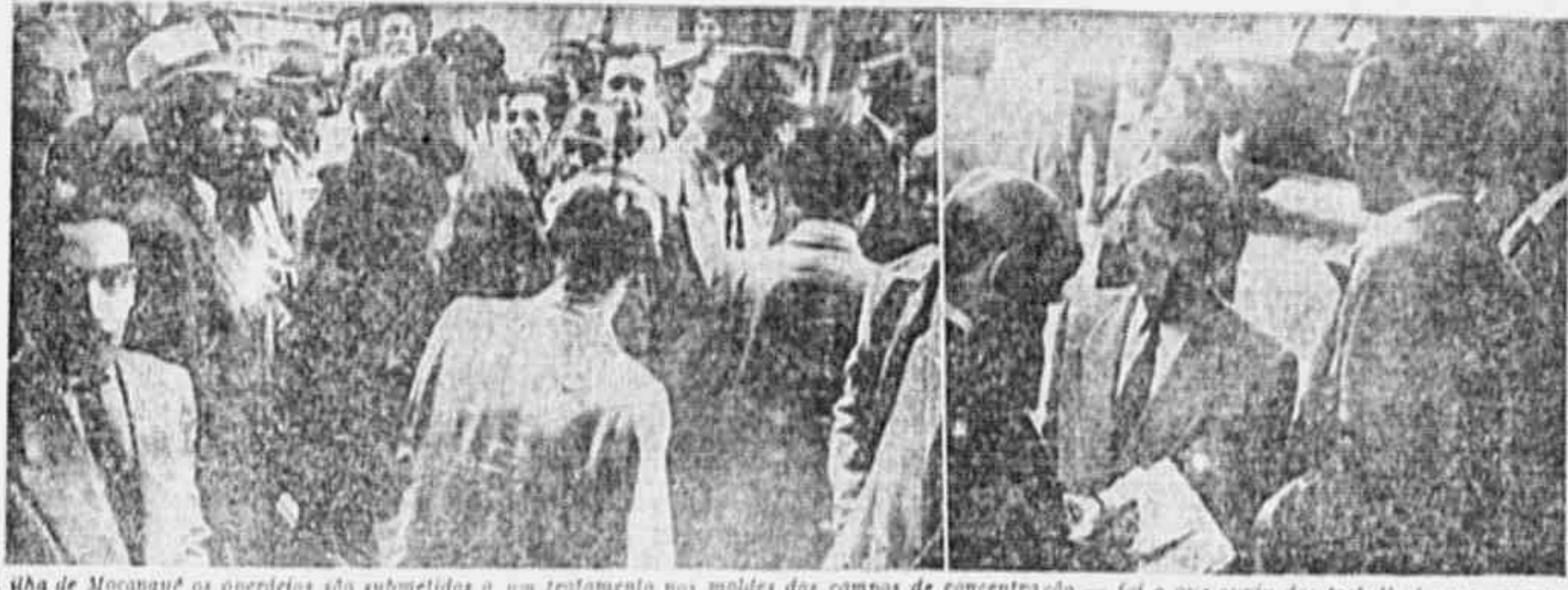
Na ilha de Mocanguê os operários são submetidos a um tratamento nos molhos dos campos de concentração — foi o que ouviu dos trabalhadores a reportagem-comando da TRIBUNA POPULAR, no dia 5 de junho, por ocasião do desembarque dos que regressam com daqueles campos de concentração

Carne podre é servida no imundo restaurante da ilha — A reportagem-comando da TRIBUNA POPULAR ouviu os trabalhadores