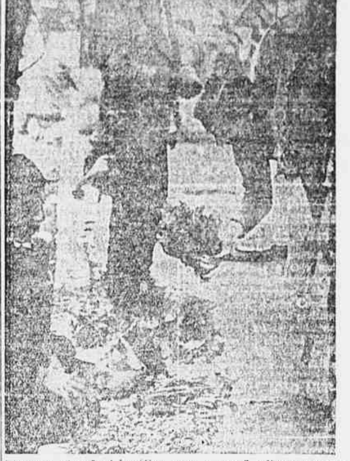
A nossa atuação é benéfica para o povo" afirmam-nos os vendedores ambulantes