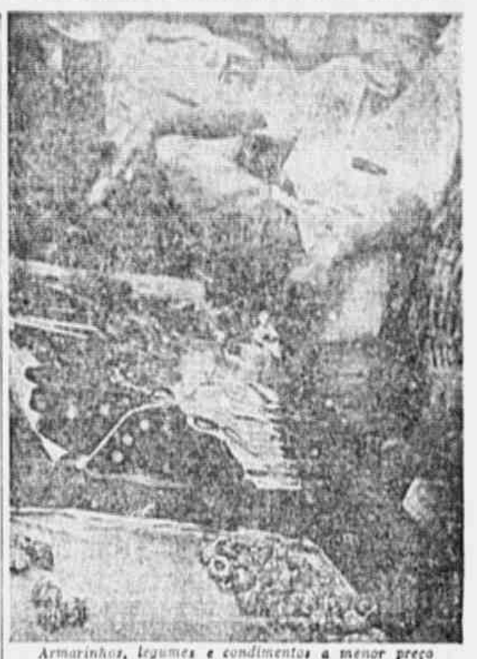
Armarinhos, legumes e condimentos a menor preço