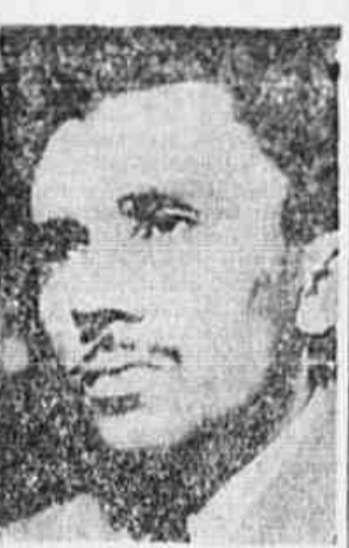
Deputado João Amazonas

Poder Executivo sobre o mesmo assunto, através do Ministério do Trabalho, criado de restrições a esse direito consagrado pela Carta Magna. As restrições não são de estranhar, de vez que, o titular daquela pasta, sr. Morvan de Figueiredo, sempre procurou negar, por todos os meios, esse direito aos trabalhadores. Esse ante-projeto de última hora, revelando uma preocupação tardia do ministro da ditadura, o que visava, em última análise, era limitar as vantagens que o preceito constitucional assegura. Chegou tarde, porém.