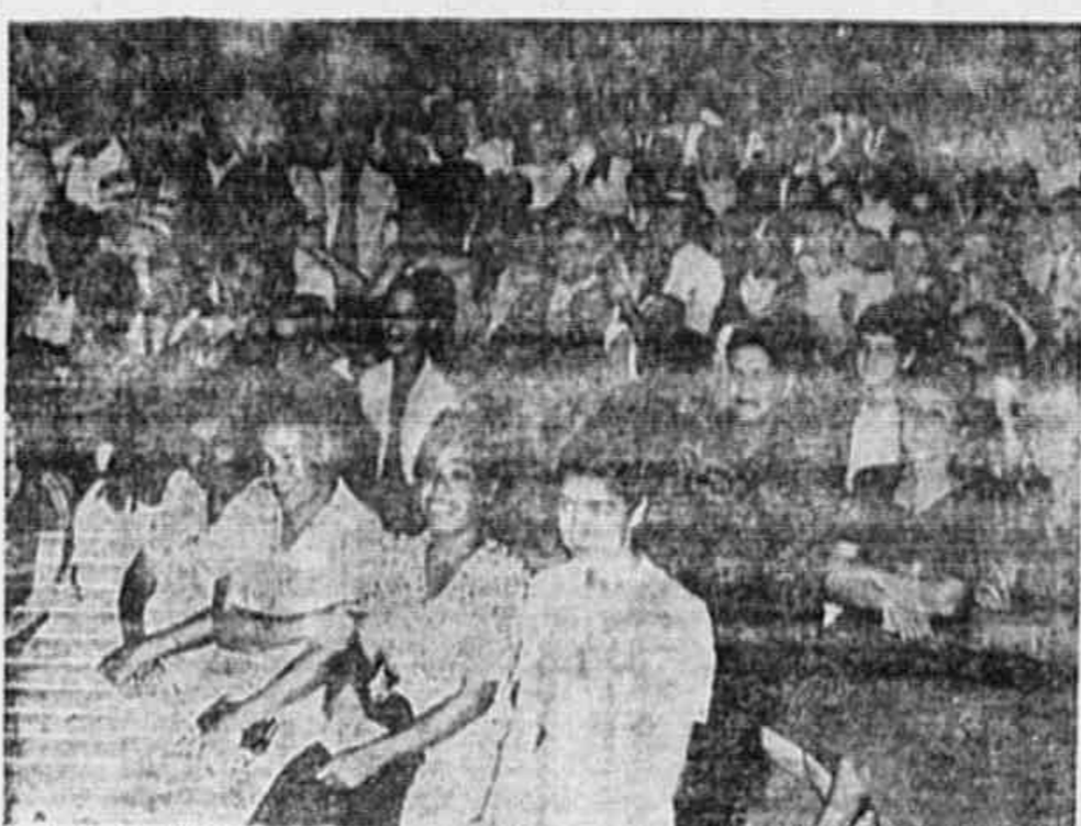
O IV CONGRESSO DO P.C.B. EM NITERÓI, ESTÁ DESPERTANDO GRANDE INTERESSE POPULAR que se traduz no acolhimento dado às campanhas empreendidas pelo Comitê Municipal do P.C.B. Com grande êxito, uma canção de Célula Aloisio Rodrigues, etc. A noite, realizou-se uma reunião a cargo do C.M., tendo falado perante cerca de mil pessoas, os delegados do C.M. à Conferência Estadual. Abre-se a reunião, que foi uma verdadeira festa, o conjunto artístico de Jacarepaguá. Na clichê, um aspecto da festa.