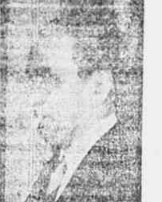
Deputado Café Filho