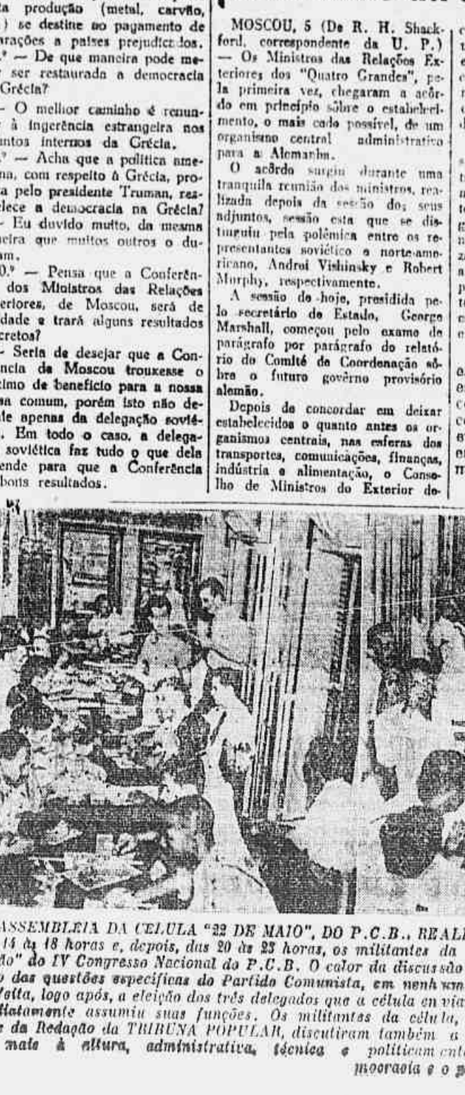
DA ASSEMBLEIA DA 'CELULA' DO 22 DE MAIO, DO P. C. B. REALIZADA ANTE-ONTEM, SÃO OS ASPECTOS FÍSICOS DA GRANDE...

ACORDO DOS MINISTROS SOBRE UM DOS PROBLEMAS DA ADMINISTRAÇÃO DA ALEMANHA MOSCOU, 5 (De R. H. Shackford, correspondente da U. P.)