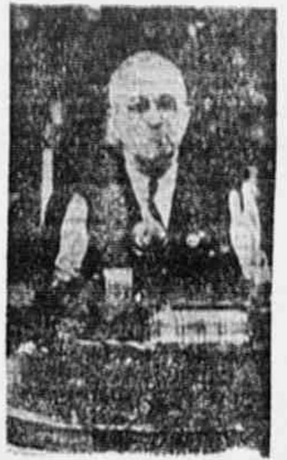
Mr. Truman, cuja conduta reacionária tem sido um forte incentivo para a rearticulação dos remanescentes fascistas nos E. U.