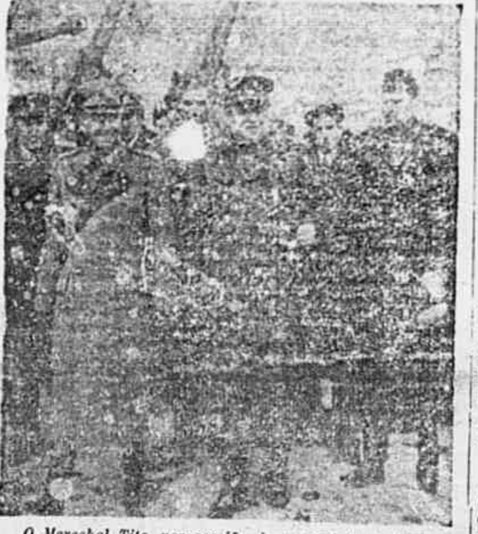
O Marechal Tito, por ocasião de uma visita à URSS

Do Comitê Metropolitan do PCB, pedem-nos a divulgação do seguinte: «O Comitê Metropolitan resolveu que as Assembléias de Células no Distrito Federal, em vez de se realizarem no dia 1.º de maio, devem se processar dentro do seguinte período: INICIAR NO DIA 3 E TERMINAR NO DIA 12»