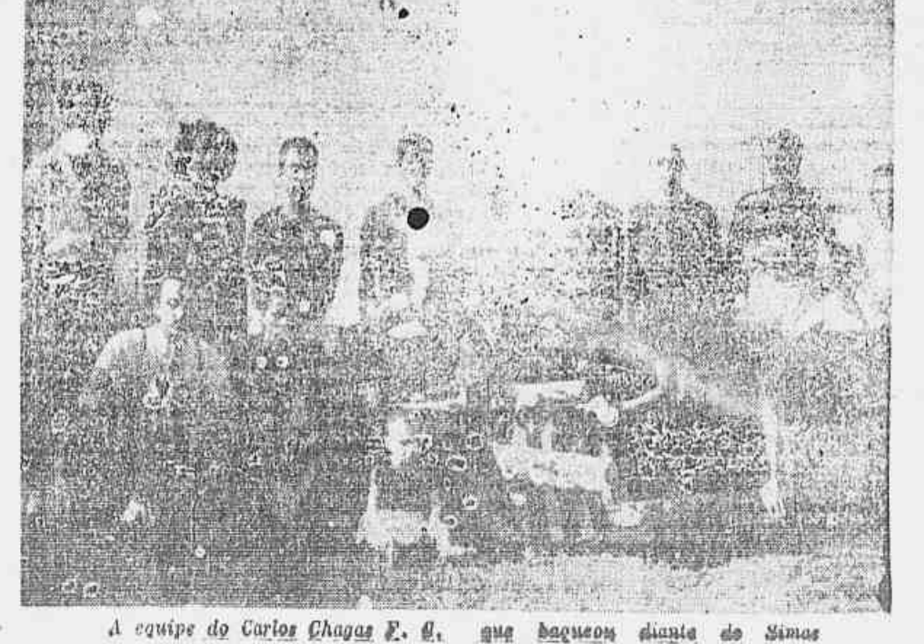
A equipe do Carlos Chagas F. C. que derrotou diante do Simas