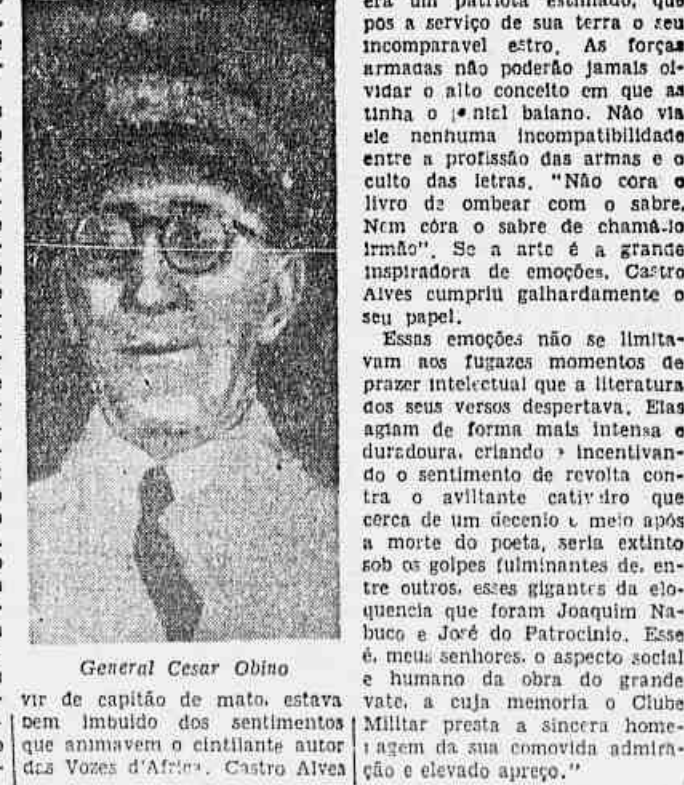
General Cesar Obino