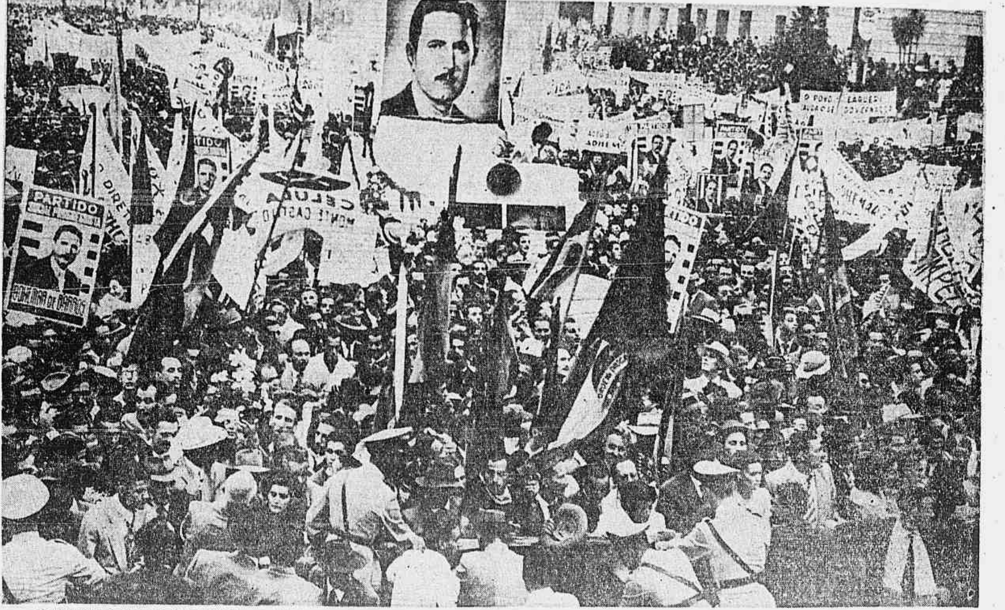
IMPONENTE O DESFILE DA VITÓRIA — O clichê mostra um impressionante aspecto do Desfile da Vitória que terminou no grande comício, do Vale do Anhangabaú, em São Paulo, por motivo da diplomacia do sr. Adhemar de Barros e dos deputados estaduais eleitos em 19 de janeiro. Nessa festa da democracia, o povo paulista vibrou intensamente, aclamando o futuro governador com delirantes vivas. Na vanguarda do prestígio, a caminho do Anhangabaú, empunhando centenas de estandartes, coloridos, faixas alvurças de acentuado marxismo e militantes do Partido Comunista. A multidão, em número incalculável, mostrava um intenso respeito. Os cartazes continham discursos contra os esboçadores do povo, contra o parecer Barbedo e os políticos reacionários, como um que dizia: "Simonsen é o cartão de visita do imperialismo inglês". Deixei mil automoveis lotados partiram do Estádio do Pacaembu até o local da manifestação. No ponteiro do armário já se encontravam o governador Adhemar de Barros e os candidatos eleitos do Partido Comunista e do Partido Social Progressista. Iniciaram-se então os discursos, sempre interrompidos de entusiasmados aplausos. Foi uma grande festa da democracia esta de São Paulo, mostrando eloquentemente aos inimigos do povo e da Constituição que não terão êxito os investidos contra a ordem e a democracia.

O ministro da Fazenda inglês fala sobre a atitude do nosso governo LONDRES, 11 (U. P.) — O ministro da Fazenda, sr. Hugh Dalton, declarou que a Grã Bretanha informou ao Banco do Brasil que sua decisão de não continuar comprando libras esterlinas é considerada pelo governo britânico como contrária aos acordos em vigor, e que o citado banco deve reiniciar tais compras. Um membro conservador, interrompendo o ministro declarou: "Isso não é outra coisa senão uma tentativa de intimidação contra o governo britânico sobre os saídos em libras esterlinas" — ao que Hugh Dalton replicou: "Se existe tal intenção, não terá êxito". A mensagem do governo britânico sobre o assunto foi enviada ao Brasil nos últimos dias e o governo aguarda uma resposta dentro de um prazo razoável.