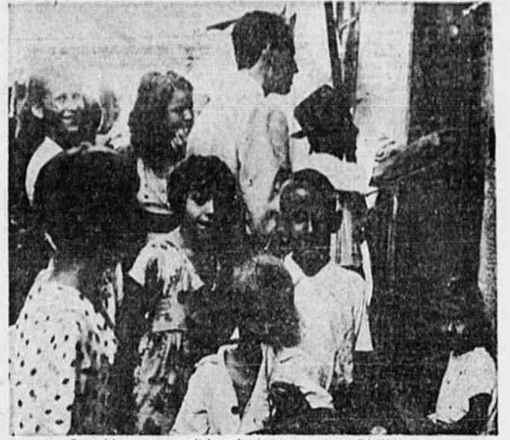
O operário mostra o quartinho onde vive, e por que paga Cr$ 192,00

CASAS DE COMODOS, ONDE FALTA A AGUA HA MAIS DE DOIS MESES — TRANSPORTES ESCASSOS E ALUGUEIS EXORBITANTES — OS PREÇOS AUMENTANDO DIA A DIA E AS DEFICIENCIAS DO ABASTECIMENTO — 140.000 CARIOCAS SOFREM AS CONSEQUENCIAS DA INEPICIA DE DETERMINADAS AUTORIDADES