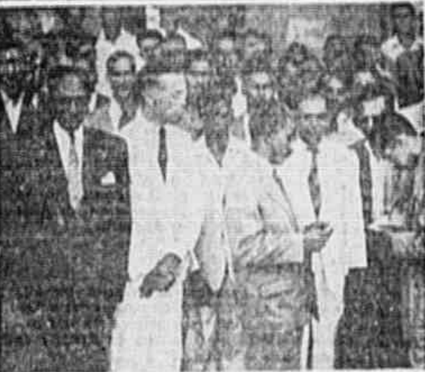
FORAM VITÓRIOSOS NO DISSÍDIO COLETIVO suscitado por intermédio do Sindicato dos Trabalhadores em carpintarias, serriarias e tanoeiras. Desde junho de 1946 que esses operários têm orçado e pacificamente lutando por melhores salários, tendo de início tentado entendimentos diretos com os empregadores que não deram resultado. Recorrem depois para a Justiça do Trabalho, não tendo havido conciliação, devido à intransigência do patrão. Suscitado o dissídio que foi julgado ante-ontem, no Tribunal Regional do Trabalho, onde os abobos concederam mantenha-se conceder 30% para os adultos e 20% para os menores aprendizes, começando a vigorar esse aumento a partir de 23 de dezembro de 1946. Também ficou decidido que os abobos concedidos anteriormente seriam excluídos do aumento. Diante dessa vitória, tiveram à nossa redação comemorar o acontecimento e ao mesmo tempo lançar um apelo aos seus companheiros para reforçarem o Sindicato, pois sem a união dos trabalhadores não é possível conseguir qualquer vantagem no terreno das reivindicações.

Ante-ontem os moradores desse bairro da Liberdade, realizaram uma grande romaria à beira do Senhor do Bonfim, onde foram pedir ao padroeiro do povo bairista, sua proteção para que saltem vitoriosos dessa luta de vários meses.