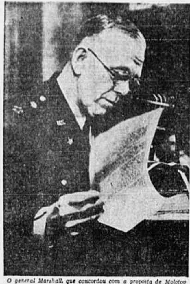
O general Marshall, que concordou com a proposta de Molotov

MARSHALL APOIA A PROPOSTA DE MOLOTOV SOBRE A INCLUSÃO DO PROBLEMA DA CHINA NA AGENDA DA CONFERENCIA — APELO DO CHEFE DA DELEGAÇÃO AMERICANA EM FAVOR DA HARMONIA E UNIDADE ALIADA — A RUSSIA PROPÕE MEDIDAS CONCRETAS PARA A DESMILITARIZAÇÃO DA ALEMANHA — OUTROS ASSUNTOS DEBATIDOS NA CONFERENCIA DE MOSCOU