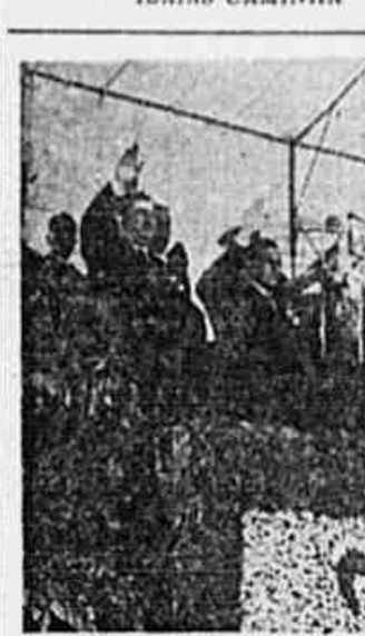
FESTA NAZI-FASCISTA EM PORTUGAL — Na fotografia acima, que nos foi enviada por um leitor, aparece Salazar rodeado de todo o seu ministério...