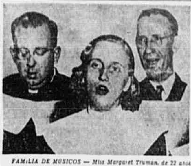
FAMÍLIA DE MÚSICOS — Miss Margaret Truman, de 22 anos, já devia ter estreado como solista de canto, com a Orquestra Sinfônica de Detroit, mas adoeceu e o "debut" foi adiado. A quem cantora, que é filha do atual presidente dos EE. UU., aparece na gravura treinando com um grupo coral de igreja. O sr. Truman também mostra alguma vocação para a música, embora se diga diletante como político e um bom pianista, e como pianista um bom político. Esperemos que a filha tenha mais sorte como cantora.

DEVAZELOS FASCISTAS Deslumbra-se com a eletricidade, os maquinismos da imprensa, o rádio, os modernos serviços de transporte, afirmando que todos esses fenômenos trouxeram um ritmo de desordenado e confuso. Depois de falar até na Revolução Francesa, criando teorias, declara: "Eis em linhas gerais a nossa doutrina".