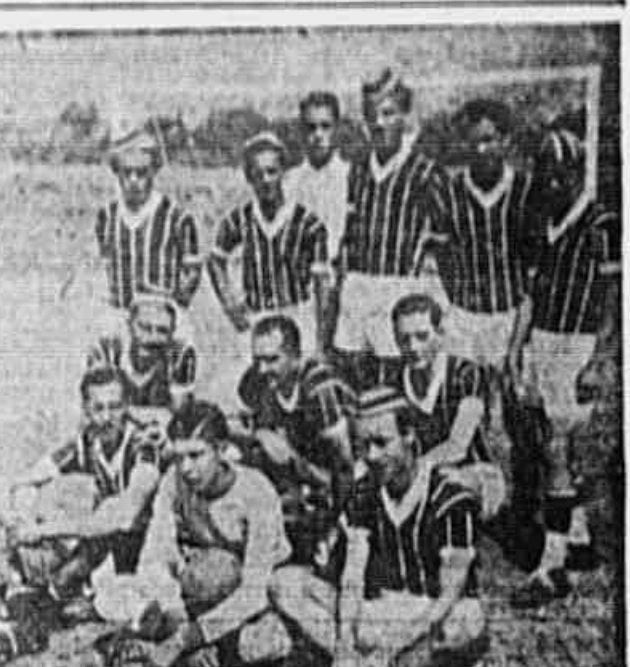
O QUADRO DO S. C. JUNQUEIRA — O time do S. C. Junqueira é um dos mais aguçados conjuntos do esporte do povo. Entusiasmo não falta aos rapazes do valeroso clube cujos componentes aparecem na foto acima.

SÉRIE "E" Centro Democrática da Piedade x S. C. Balaiaha — Unidos de Glorinha x Lorena F. C. — S. C. Luso Brasileiro x Estrela do Oriente — Unidos do Sampulô x S. C. Royal — São Gabriel F. C. x Rio A. C. — Fúfura F. C. x Faustiano F. C. — Londres S. C. x Unidos de Belmonte — Vila F. C. x S. C. Onze Diabos — S. C. Guarani x S. C. Condor — Maxwell x Independente F. C. de Marechal Hermes — Coração Unidos de Jacarepaguá x S. C. Agua Branca — Universal de Bonassuto x S. C. Beltramar — S. C. Laurindo Filho x João Vicente F. C. — Nova Aurora x S. C. Gróvão. — By: Carlos Chagas. — C. de Marechal Hermes.