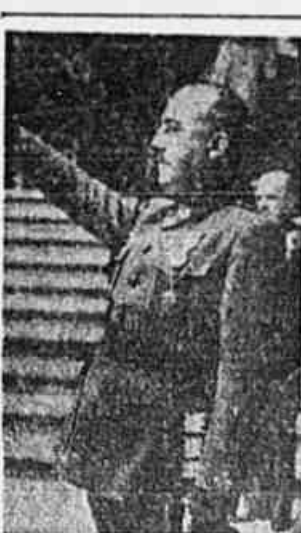
O bandido Franco

Falam à reportagem o cientista Artur Ramos, o romancista Guilherme Figueiredo, o professor Josué de Castro e o jornalista Edmar Morel — Dirige-se o povo, através de memoriais e telegramas, ao presidente da República, aos senadores e deputados federais, condenando o famigerado parecer