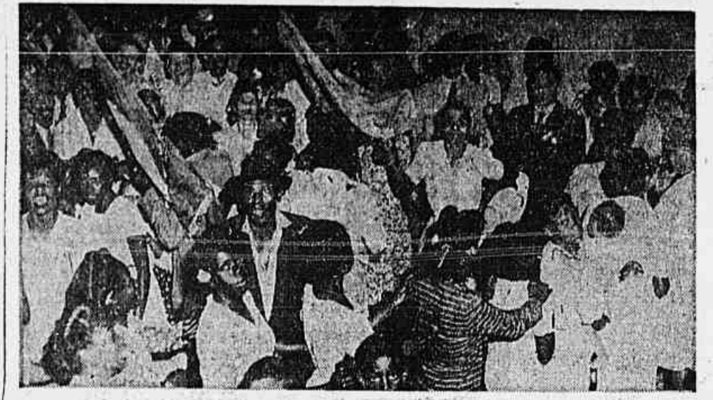
Um aspecto do ensaio na Escola de Samba "Depois Eu Digo", 3.ª colocada no concurso ao carnaval da paz, inscrita para o desfile do sábado de Aleluia

Os preços exorbitantes e os lucros fabulosos dos atacadistas -- Verdadeiro assalto à bolsa do carioca -- Uma caixa de maçãs comprada a Cr$ 65,00 e revendida ao varejo por Cr$ 170,00 -- A situação dos ambulantes -- Espera o povo medidas urgentes das nossas autoridades