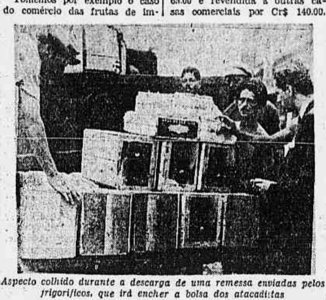
Aspecto colhido durante a descarga de uma remessa enviada pelos frigoríficos, que irá encher a bolsa dos atacadistas

Inteiro apolo deste matutino, por intermédio da U.G.E.S. VISITA AS ESCOLAS DE SAMBA