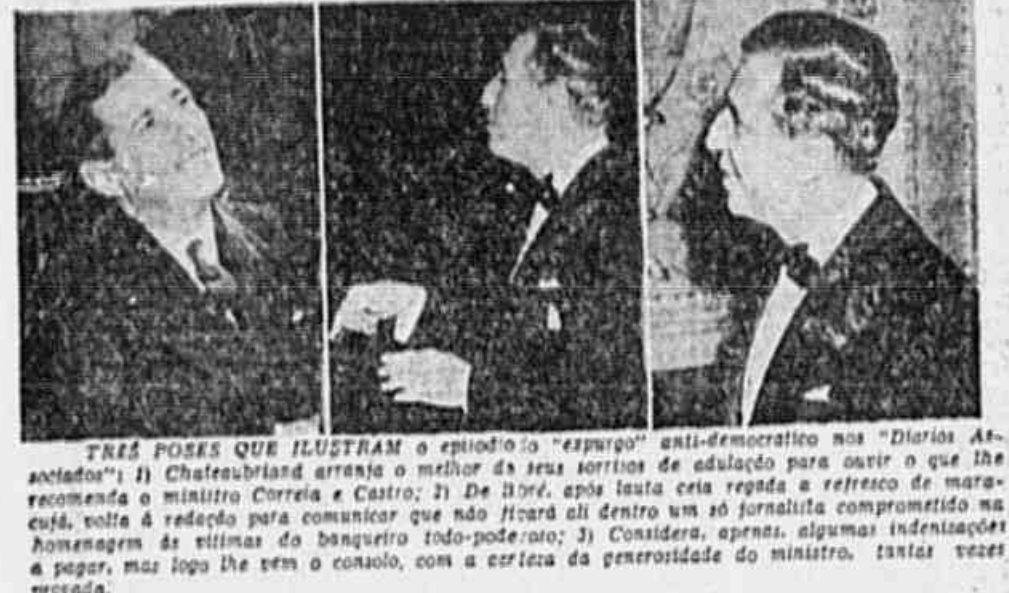
TRES FOMAS QUE ILUSTRAM o episodio do "expurgo" anti-democratico nos "Diarios Associados": 1) Chateaubriand entrega o melhor de seus artigos de adulacao para ouvir o que lhe recomendaria o ministro Correa e Castro; 2) De fora, depois de uma longa e feroz luta de maracujá, volta a redação para comunicar que não ficará ali dentro um só jornalista comprometido na homenagem às vítimas do banqueiro todo-poderoso; 3) Considera, apenas algumas indenizações e pagar, mas logo lhe vem o consolo, com a certeza da generalidade do ministro, tantas vezes privada.