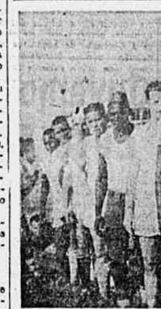
OS DEFENSORES DO DINAMO S. C. DA GLORIA — O team do S. C. Dinamo é capaz de grandes façanhas, segundo afirmativa dos seus dirigentes. A equipe tem realizado boas performances nos encontros até agora realizados, e daí o entusiasmo com que os "cracks" da Gloria esperam o início do "Campeonato Popular". Os treinos estão sendo efetuados com animação e a forma dos "cracks" é a melhor possível. Ficam portanto avisados os concorrentes do certame que TRIBUNA POPULAR está organizando; cuidado com o Dinamo S. C. da Gloria. A foto acima, mostra o valente conjunto antes de um compromisso.

OS DEFENSORES DO DINAMO S. C. DA GLORIA O team do S. C. Dinamo é capaz de grandes façanhas, segundo afirmativa dos seus dirigentes. A equipe tem realizado boas performances nos encontros até agora realizados, e daí o entusiasmo com que os "cracks" da Gloria esperam o início do "Campeonato Popular". Os treinos estão sendo efetuados com animação e a forma dos "cracks" é a melhor possível. Ficam portanto avisados os concorrentes do certame que TRIBUNA POPULAR está organizando; cuidado com o Dinamo S. C. da Gloria. A foto acima, mostra o valente conjunto antes de um compromisso.