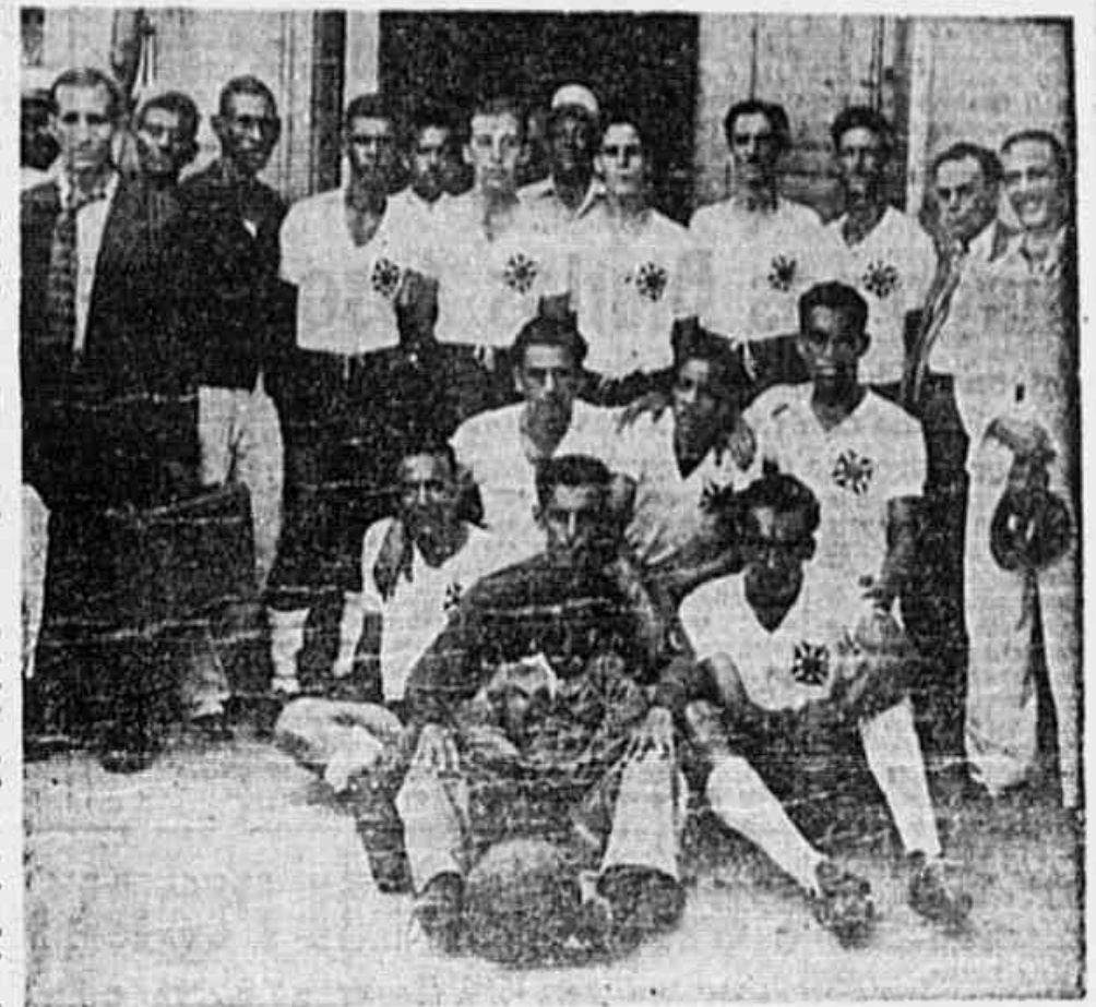
O quadro do S. C. Brasileiro

Para os jogos iniciais, o sorteio da tabela será único e o clube perdedor ficará afastado do Campeonato. POR QUE ELIMINATORIA NAS TRES ZONAS A razão do torneio das três zonas não oferecer possibilidades aos perdedores de uma nova apresentação, é lógica. E' que os jogos serão em número elevado, e há hipótese de um período longo de duração do Campeonato Popular, diferenciaria o trabalho de certos dos campos oficiais. Os torneios oficiais da cidade começarão no mês de abril, e não seria possível a realização de qualquer prêmio dos clubes independentes nos altitudes locais. É esta, portanto, a razão principal da rapidez com que se evitou de conhecer o campeão da zona, usando-se o sistema de sorteio de tabela eliminatória. Os clubes que forem perdendo dirão adeus ao Campeonato Popular, deixando que os seus vencedores continuem na trajetória para tentar a conquista do título máximo.