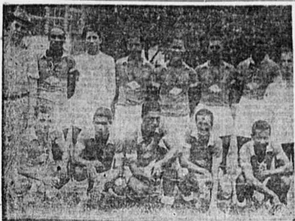
OS DEFENSORES DO PONTE F. C. — A gravura acima, mostra o esquadro do Ponte F. C. que defenderá as tradições do club no maior certame amadorista de todos os tempos. E' um team valente e disposto a fazer frente aos mais apertados conjuntos dos diversos bairros. A gravura acima, mostra o adestrado conjunto em companhia de dois dirigentes, antes de uma contenda amistosa.

ELIMINATORIAS NAS TRES ZONAS — A CLASSIFICAÇÃO DOS CLUBES — OS PERDEDORES SERÃO AFASTADOS — SENSACIONAIS AS PELEJAS DO "CAMPEONATO POPULAR"