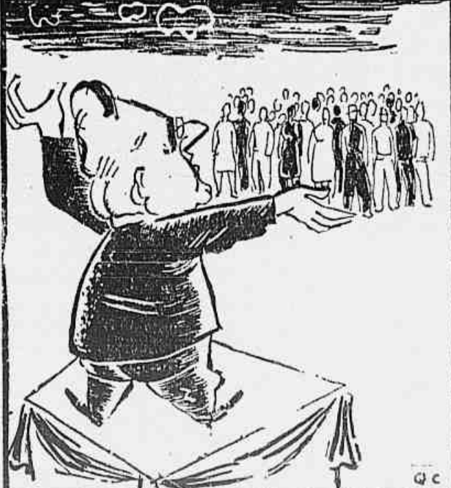
"TRABALHADOR, O P. T. B. É O TEU PARTIDO"