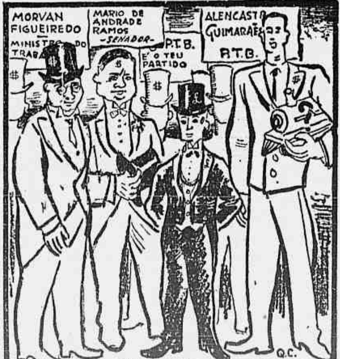
MAS ESTES SÃO OS DONOS DO P. T. B.