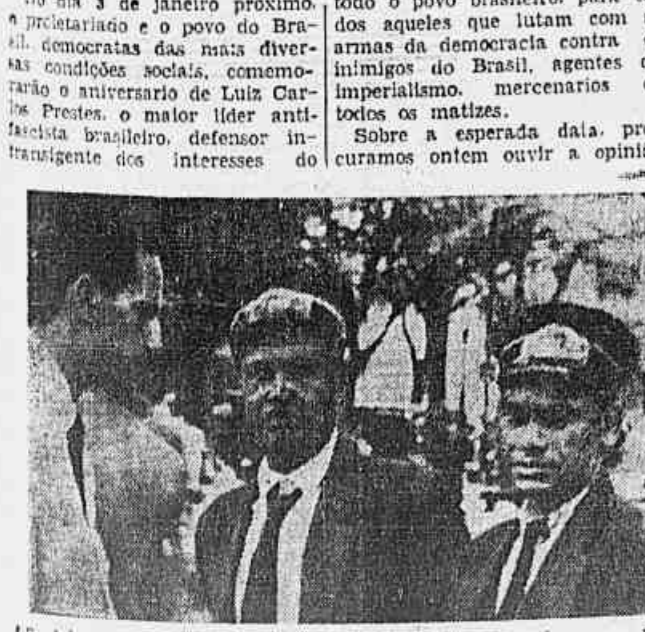
Se há um homem no Brasil que merece festas populares no dia do seu aniversário, será sem dúvida o Senador do Povo

Justas homenagens do proletariado e do povo brasileiros ao seu líder máximo — Uma data grandemente significativa para os democratas de todo o Brasil — “Será uma festa de todo o nosso povo” — Populares falam à nossa reportagem sobre as comemorações do dia 3 de janeiro