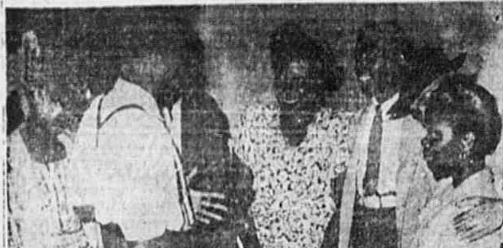
No próximo Carnaval festejaremos a paz e poderemos comemorar também a vitória do povo nas eleições do mês que vem — São os "Jodostinho"

ANO II * N.º 485 * TERÇA-FEIRA, 31 de DEZEMBRO de 1946