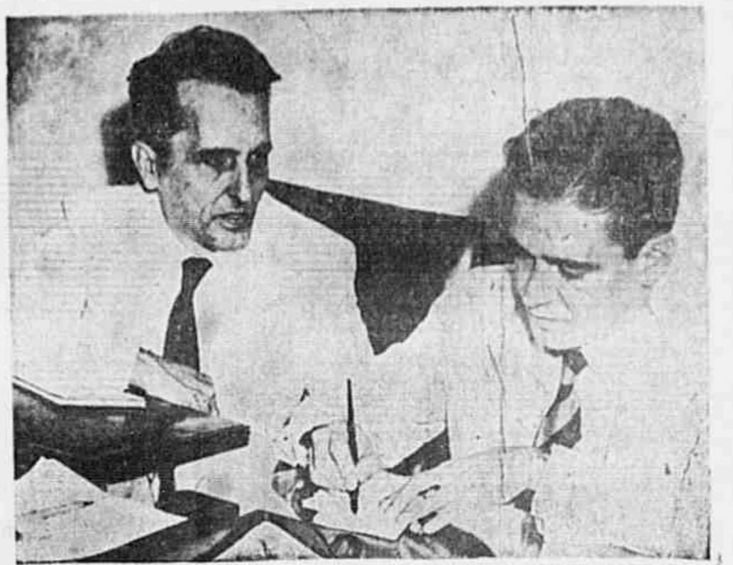
Prestes, num instante, ao ser entrevistado pelo redator-chefe da TRIBUNA POPULAR

AUMENTA O PRESTÍGIO DO PCB E prosseguindo: — Para mim, dirigente, essa esperança que o povo deposita no Partido faz meditar sobre as grandes responsabilidades que temos e que aumentam cada dia. Já não são somente os operários. As grandes massas camponesas também já sabem ser o Partido Comunista o uni-