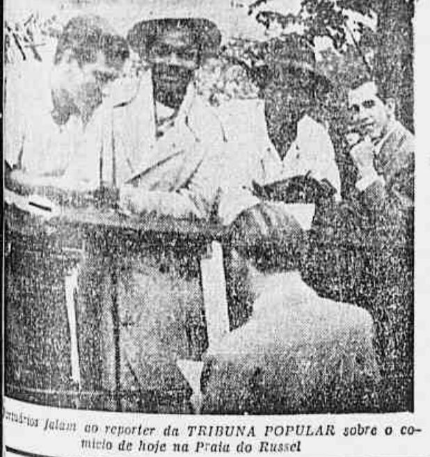
Participantes falam ao repórter da TRIBUNA POPULAR sobre o comício de hoje na Praia do Russel

Os representantes do PCB ao Conselho Municipal lutarão por mais comida, escolas e transportes para os cariocas — São homens e mulheres que honrarão o seu mandato — Trabalhadores e populares falam à TRIBUNA POPULAR