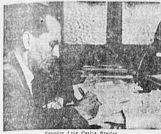
Senador Luiz Carlos Prestes

MOBILIZAR E ORGANIZAR AS MASSAS NA CAMPANHA ELEITORAL