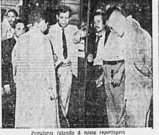
Populares falando à nossa reportagem

Este o destino que a Light devia dar aos seus fabulosos lucros — Em vez disto pleiteia um aumento de tarifas — Os candidatos da "Chapa Popular" lutarão pela revisão dos contratos lesivos aos interesses da Nação — Rápida "enquête" da TRIBUNA POPULAR