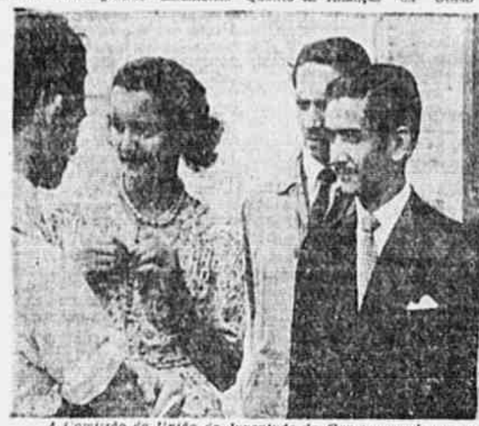
A Comissão da União da Juventude da Gavea quando em palestra com o novo redator da juventude.

Com a fundação da União da Juventude Carioca, vêm os jovens do Distrito Federal, sendo em pratica um vasto programa de luta em defesa de suas reivindicações, entre elas a criação de campos de esportes, o direito à saúde, a instrução gratuita, melhor salário, etc.