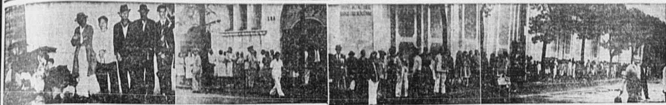
Um grupo de pessoas que estão fixados nos clichês acima, são do mesmo local, em diferentes horas; o mercadinho da rua Elpidio Bonfim, quase na esquina da rua Figueira de Melo. Na primeira fotografia, feita às 3 horas da madrugada de ontem, inicia-se a fila, e depois de gestos, homens, mulheres e crianças, abrigam-se sob guarda-chuvas, preparando-se para longa e injustificada espera, garantindo uma "boa posição" que lhes permitirá ser dos primeiros a ser atendidos quando se abrir o mercadinho. Os seguintes quadros foram tomados às 5, 5:30 e 6 horas da manhã. A fila cresce cada vez mais. Na última, ela se estende pela rua Figueira de Melo até Francisco Eugênio e ainda prossegue por esta rua. Fila enorme, de centenas de pessoas, que aguardam impacientes a hora em que se abra o mercadinho. Às 6:30, as portas estavam ainda fechadas. Há protestos, queixas, reclamações. Vários populares foram à reportagem da TRIBUNA POPULAR; "isto não pode continuar assim! Muitos de nós não tinham tempo nem para repousar um pouco em casa. Agora, depois de tantas horas na fila, vamos de novo para o "batalhão". E ainda mais não sabemos se haverá banha, se poderemos ler para casa o que necessitamos."