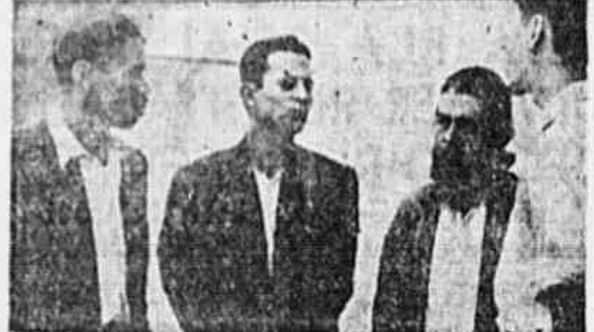
Assinados da Liga Camponesa de Paracambi quando foram às violências praticadas na Fazenda da Boa Vista do Mandacaru.

Explorados e ainda ameaçados de expulsão — Protesta a Liga Camponesa local da Boa Vista do Mandacaru em Inra.