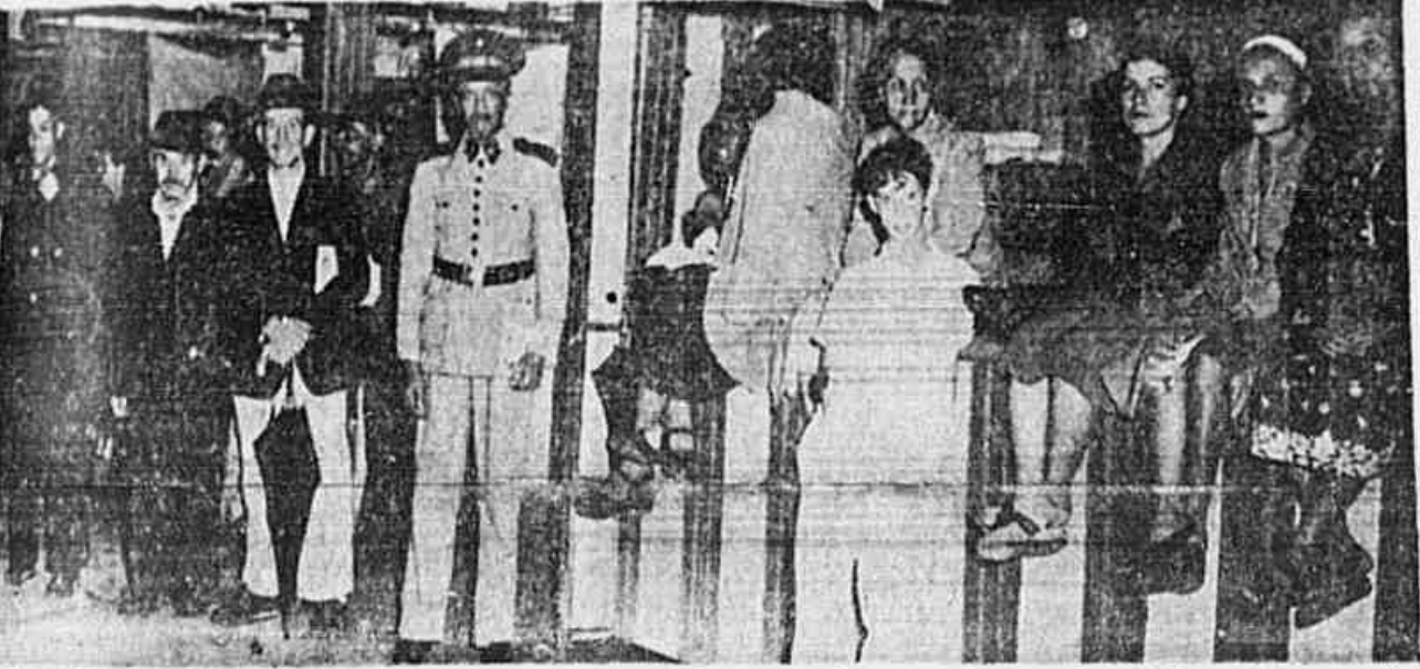
No Mercado S. Cristóvão, no Campo de São Cristóvão, não havia fila. O povo abrigava-se da chuva junto às barracozinhas armadas no Campo. Perguntamos porque não havia fila: "O chefe de polícia deu ordem para não haver fila antes de que o mercado abra". Aberraram-nos. Processo nitidamente fascista de resolver problemas; não haverá mais filas porque o chefe de polícia não consente.