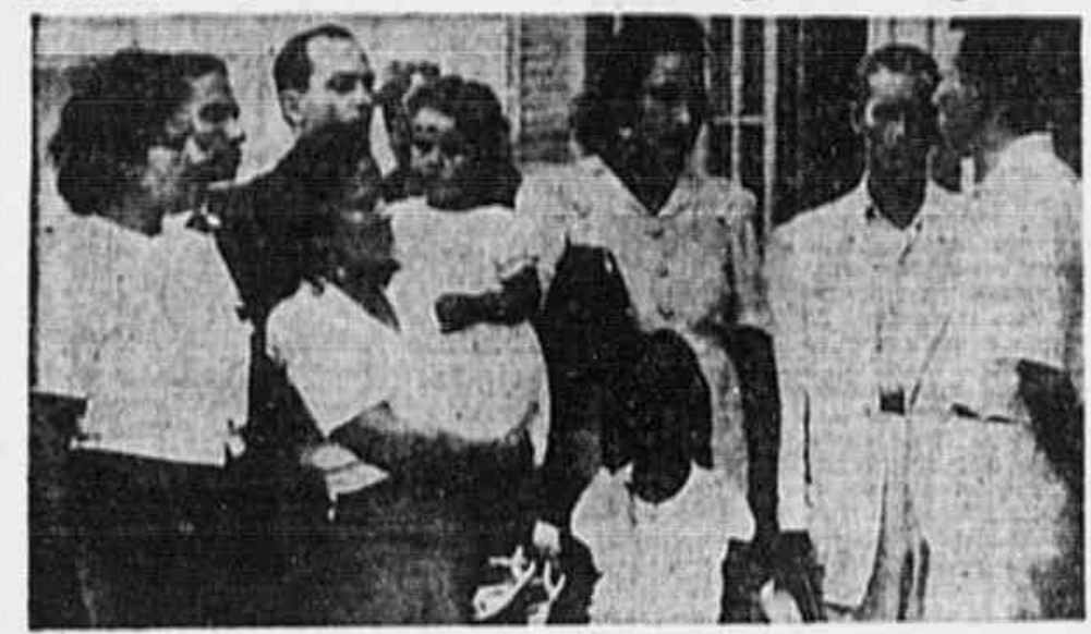
Membros da Comissão Executiva do Comitê Democrático e da União Feminina de Inhaúma, quando foram à TRIBUNA POPULAR.