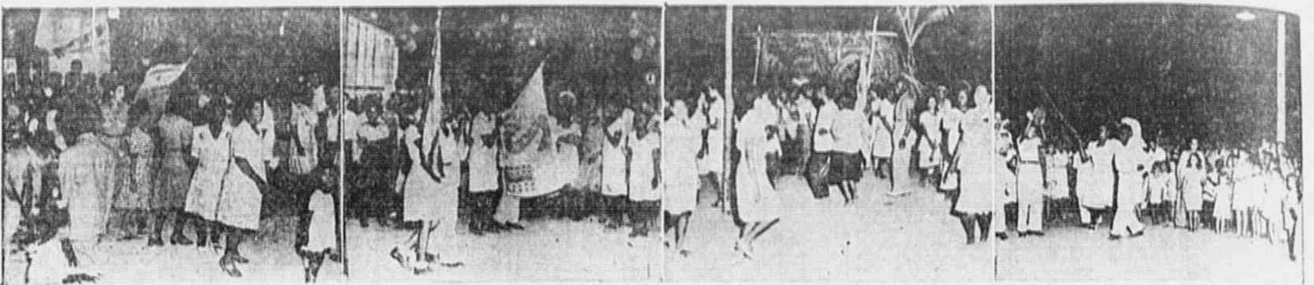
NOS MORROS E NOS SUBURBIOS PREPARAM-SE AS ESCOLAS DE SAMBA PARA O GRANDE DESFILE DE AMANHÃ, entre grande animação, que é a mesma reinante em toda a cidade pela realização da grande festa em homenagem à Imprensa Popular, ensaia estes aspectos focalizamos na gravura acima algumas das Escolas que não percorreram as ruas, e que estão na seguinte ordem: "Irmãos Unidos de Irajá", "Filhos do Deserto", de Lins e Vasconcelos; "Últimos a Chegar", de Cassia; e "Unidos da Capela", de P. de Cassia