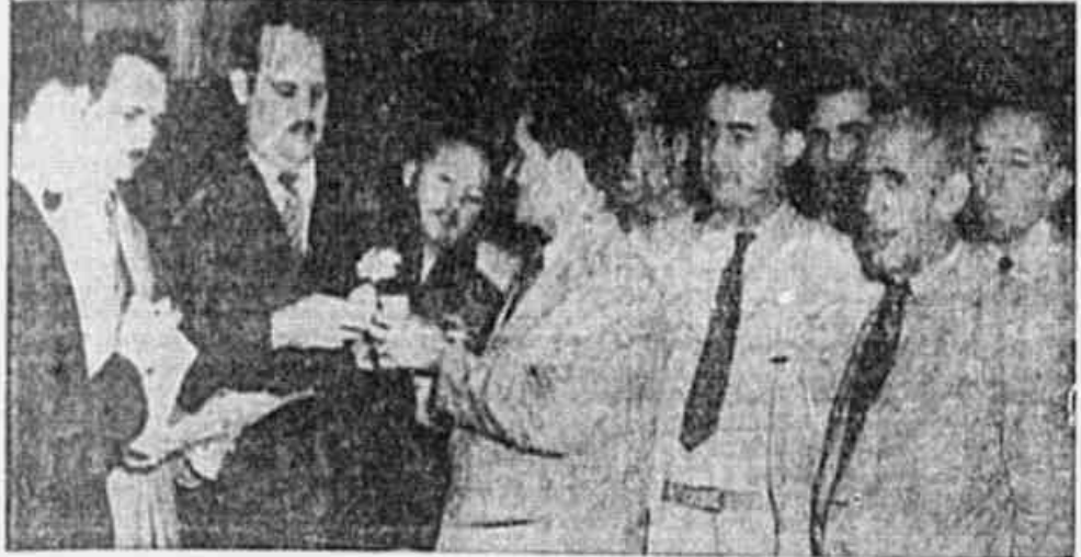
Os diretores do Sindicato da Industria de Panificação, quando falava à nossa reportagem.

UNIDADE DEMOCRACIA PROGRESSO ANO II * N.º 440 * SABADO, 9 DE NOVEMBRO DE 1945