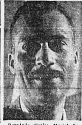
Deputado Carlos Marighella

mente, com essa farinha de trigo que nos vem dos molinhos. O Departamento de Abastecimento da Prefeitura não exerce uma fiscalização rigorosa nessas empresas, a fim de que seja observada a percentagem de mistura estabelecida em bases científicas. Em vez disso, os excessos da fiscalização recaem sobre o pequeno comerciante.