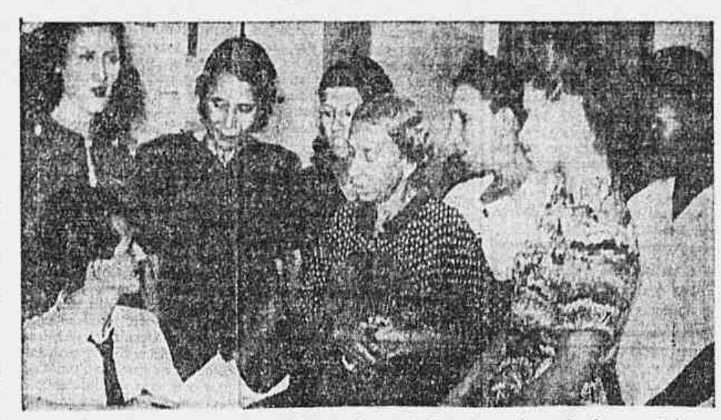
A comissão de donas de casa de Anchieta, quando nos fazia entrega da cópia do memorial que enviaram ao Prefeito do Distrito Federal.

Por nosso intermédio, apelamos as donas de casa de Anchieta para que o prefeito do Distrito Federal, solução, com a devida urgência, o problema n.º 1 do seu bairro: uma feira-livre. Para isso estiveram, ontem, na Comissão do Abastecimento, onde entregaram, para que fosse encaminhado ao Prefeito, um memorial contendo cerca de quatrocentas assinaturas. O dr. Ferdinando Esberard, que recebeu a Comissão, afirmou que a Prefeitura estava interessada em instalar feiras-livres em todos os bairros e subúrbios do Rio de Janeiro e que, por conseguinte, o pedido das donas de casa de Anchieta, através de sua União, não poderia deixar de ser atendido.