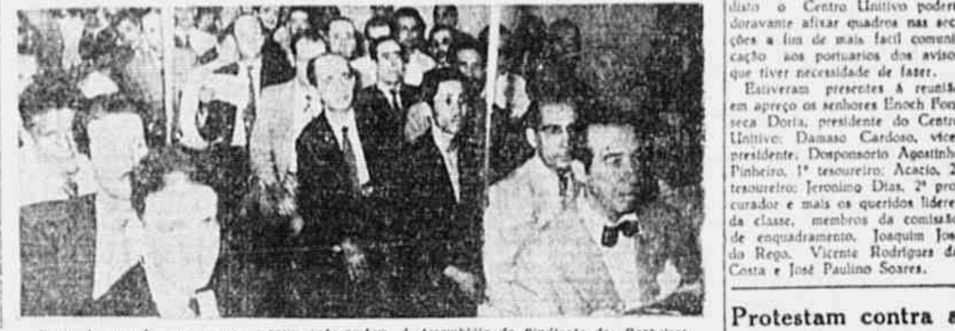
Parte da grande massa que ocorreu, ante-onem, à Assembleia do Sindicato dos Barbeiros

As respostas do superintendente foram as seguintes: 1) Enquadramento — Não era possível ser resolvido no momento, pois ainda se encontrava em estudos, demandando mais algum tempo a solução. 2) Já foi extinto o regime das meia-noites ganhando o trabalhador o salário inteiro desde que dá o ponto para o trabalho noturno. 3) Não ser possível a APRI abstenção de plataformas empilhadas de mercadorias, madeiras, etc., luz em demasia no frigorífico de Prutas e em outros locais a falta de luz ou a má distribuição desta. A Campanha de Imprensa Popular no Espírito Santo O senador Luiz Carlos Prestes recebeu de Itarana, Espírito Santo, o seguinte telegrama: «Tivemos a maior satisfação em atingir a cota de mil cruzeiros da Campanha Pró-Imprensa Popular, superando-a. — (sa) Julio Moreira, Atílio Congos, Antenor Mota, Tourinho Pinto, Antonio Rodrigues e Basílio Almeida».