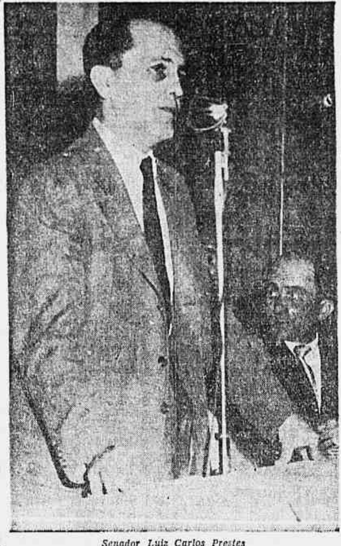
Senador Luiz Carlos Prestes