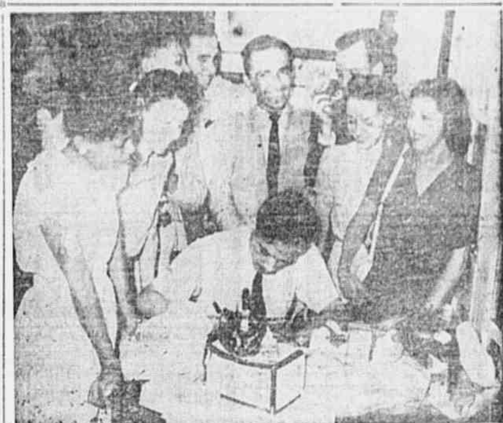
A comissão central da Campanha Pró-Imprensa Juvenil, em nota redonda, com muitos dos brindes que serão cedidos no grande baile de amanhã

Como se vê, os conjuntos se apresentarão com a mesma formação do último domingo. O Vasco jogará com o time, que teve o fluminense do campeonato, o quadro que em Laranjeiras venceu no domingo passado de forma espetacular.