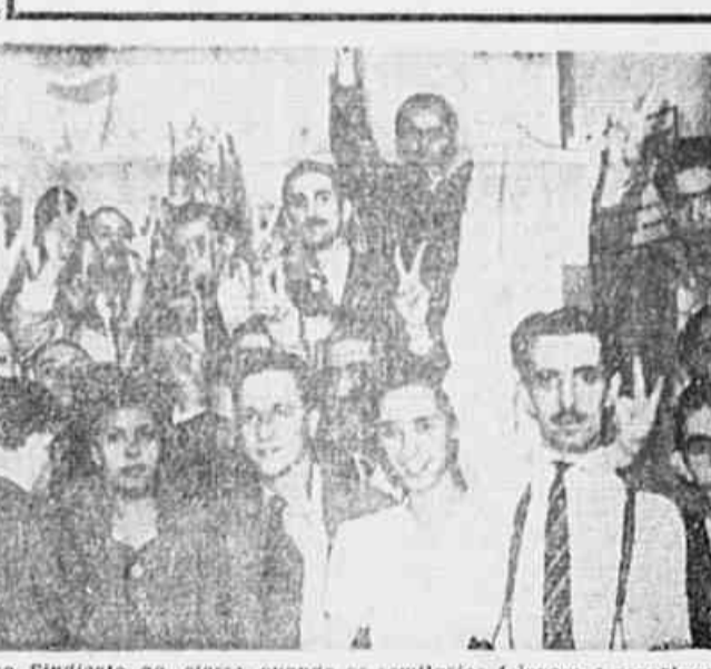
Aspecto tomado ontem à tarde no Sindicato da classe, quando os securitários falavam a reportagem

remanescentes do fascismo, auxiliados diretamente pelo Eixo, e ainda colaboradores. Na guerra com que os seus comparsas pretendem acabar com a democracia, aniquilar a humanidade. Enquanto isso, vemos por outro lado a admisión de Franco no Tribunal Internacional de Justiça de Haia, levado pelas mãos dos imperialistas anglo-