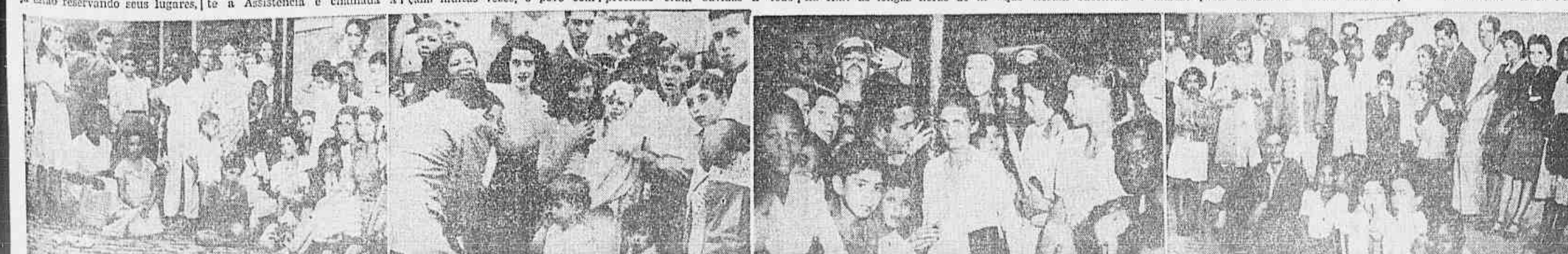
Ao longo da fila, homens, mulheres e crianças se queixam do tempo perdido e aguardam impacientes a distribuição da banha. Os comentários giram sempre, obrigatoriamente, em torno da carestia. Uma velhinha queixa-se de mau trato recebido por parte dos funcionários do Mercado de Emergência. Todos clamam contra as filas, a carestia, o câmbio negro e a inflação

certeza, o protecionismo escandaloso, a desumanidade de alguns encarregados do serviço. Tivemos oportunidade de ouvir donas de casa; velhinhas que vieram de subúrbios distantes; funcionários que perderam o ponto na repartição; colegas que tiveram de faltar às aulas; operários que não foram no trabalho; mulheres doentes; mulheres que vieram substituir o marido