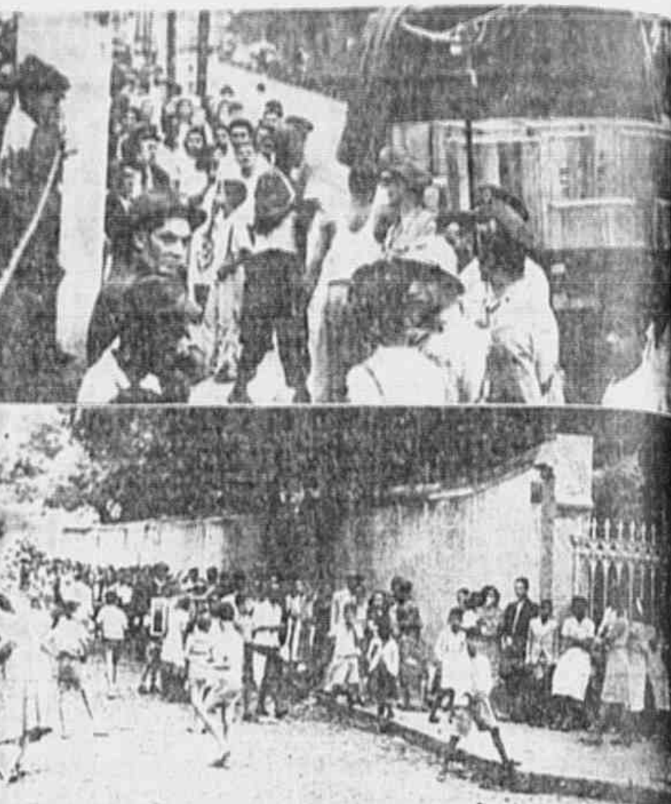
Na porta do Mercado de Emergência de São Cristóvão, são descarregadas as ratas de bosta de filia, em expectativa ansiosa os homens aguardam, comentam a carestia, a inflação, o desemprego. O fim da fila, que começa na rua Senador Alencar, é na rua Eberstadt, que se vê na foto acima. Mulheres insistentemente carregam crianças no colo, algumas amamentam ali mesmo as filhas. Na semana passada, uma dra. f. lut. no próprio Mercado