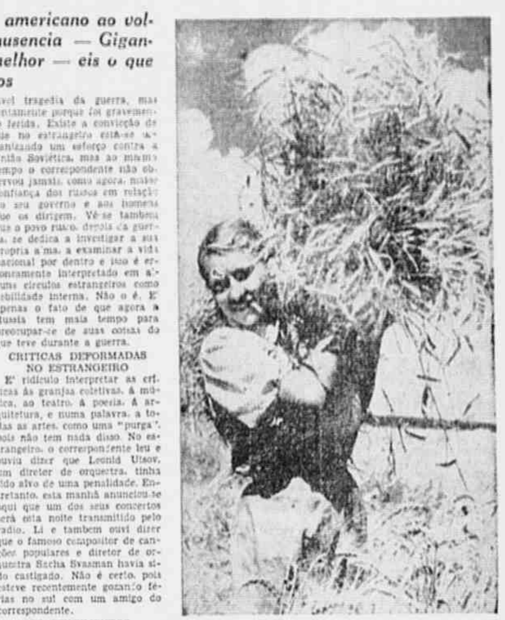
Os povos soviéticos amam a vida e o trabalho em liberdade

Para terminar estas primeiras impressões da Rússia, depois de voltar ao lugar onde o correspondente tem vivido nos últimos cinco anos, é forçoso chegar às seguintes conclusões: fora da Rússia fala-se da guerra e na Rússia fala-se da paz. A União Soviética é um dos mais apaixonados temas de discussão em todo o mundo e o continuará sendo por muito tempo ainda.