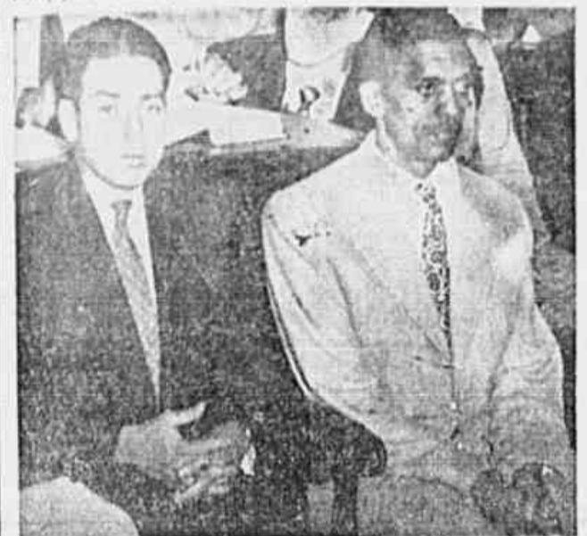
Os dois portuários anti-fascistas que serão libertados hoje