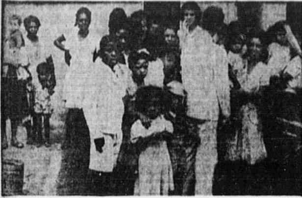
Moradores da Favelinha fazendo suas refeições ao ar livre. Ao redor, diversas crianças que não frequentam escola, por falta de um estabelecimento na localidade.

Chamam de Favelinha aquela parte de Bangú aliada entre as ruas da Chita e Guararapes. Há quinze anos atrás aquilo tudo era matão e os trabalhadores da Companhia Progresso Industrial do Brasil, para construir seus barracos, não precisavam mais nada além de se entregar à tarefa da limpeza do terreno e ao trabalho constante de longas dias de suor, a fim de levantar