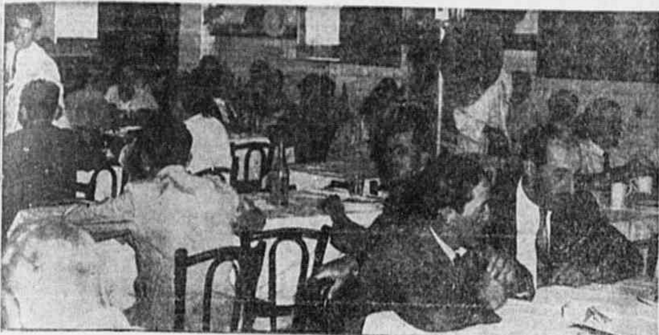
Nestas mesas, antigamente os cariocas encontravam bifes com batatas. Hoje, amarga delusão...