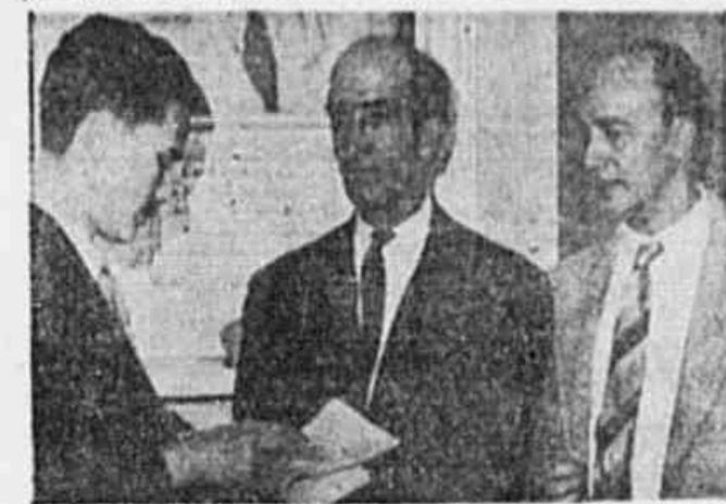
O redator da TRIBUNA cure os organizadores da exposição

ANO II * N.º 417 * SABADO, 12 DE OUTUBRO DE 1946