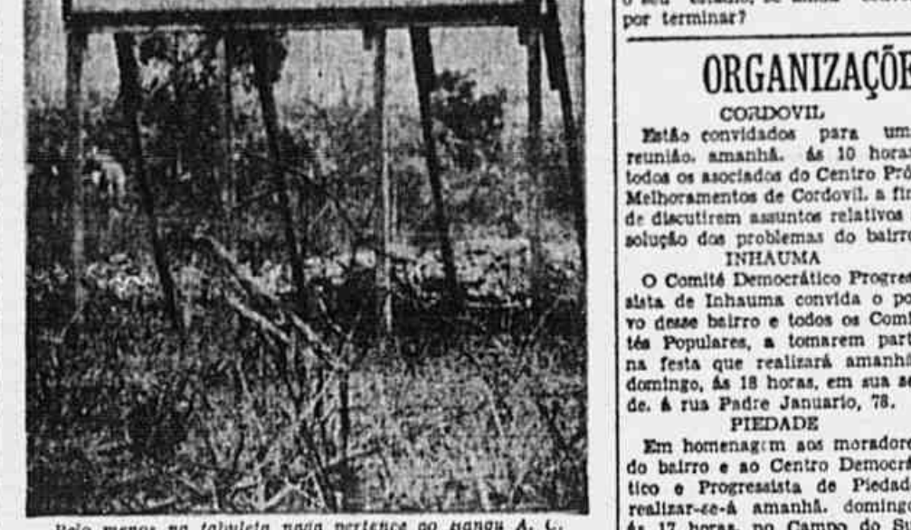
Pelo menos na tabuleta nada pertence ao Bangú A. C.

UM PEQUENO LUCHO DE 144 MILHOES DE CRUZEIROS — E fácil se perceber como o negócio foi arranjado, — declara um morador da Favelinha. A diretoria do Clube é quase toda de malucos da Fábrica... Mas o dr. Silveirinha está construindo um estádio para o Bangú A. C., que vai ser um colosso... Vai valorizar muito essas terras. Principalmente com o acordo que vão fazer ou já fizeram com a direção da Central do Brasil, para que os trens parem, todos os domingos, na estação que a fábrica está construindo logo aqui adiante.