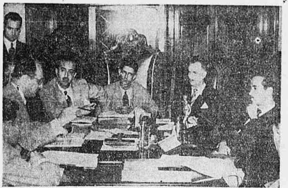
Flagrante d a entrevista

— Segundo suas publicações, era de 5 por cento. Mas o governo não possui elementos para a comprovação dos lucros acusados, pois desde o laudo Epitácio Pessoa, aceito pelo Supremo Tribunal, ficou o Ministério da Viação impossibilitado de proceder à tomada de contas. Formularam alguns colegas