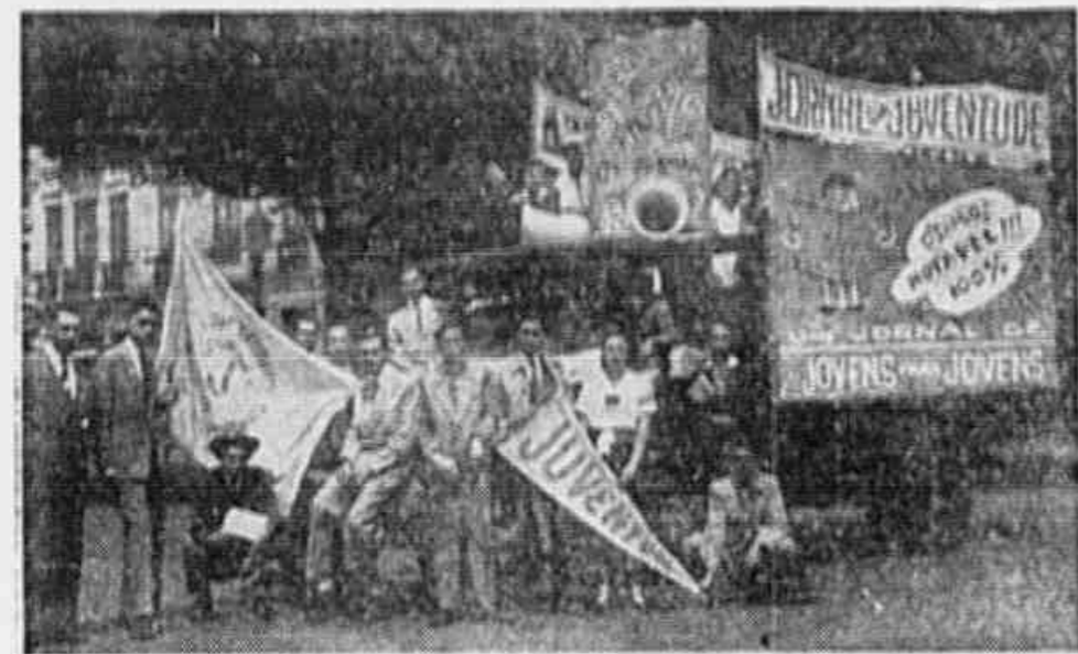
Propaganda do "Jornal da Juventude"