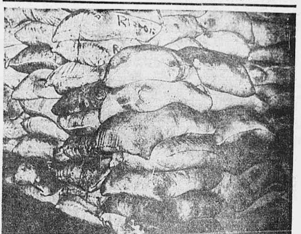
Algumas pilhas, com toneladas de açúcar existem nos Cais do Porto, à espera de transporte para outras praças onde serão colocadas a preços sem tabela...

todos nos brasileiros devemos não apenas que reclama, mas também fechar fileiras. É um patriótico zelo e nosso patriotismo."