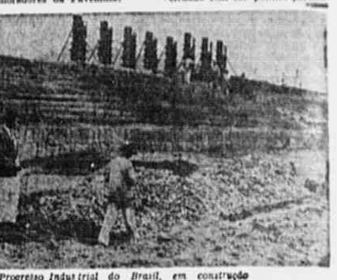
O estádio da Cia. Progresso Industrial do Brasil, em construção

O fundamental porém, não é o lucro da Companhia, nem o estádio que o Bangú A. C. vendeu para ficar em terras da mesma companhia, dentro de uma sede que não será sua, pois a tabuleta bem afirma: "Projeto, construção e propriedade da Cia. Progresso Industrial do Brasil". O que é mais fundamental para nós é saber para onde vão os moradores da Favelinha.