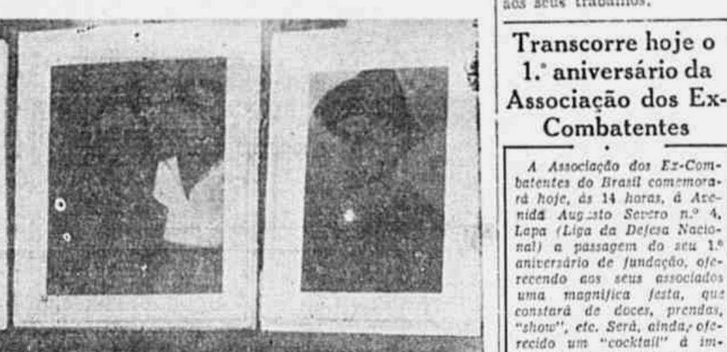
Alguns dos quadros expostos

Concluindo, falam sobre a contribuição de Pancetti: — O grande pintor patriótico ofereceu para a Exposição dos Artistas Plasticos Pró- Imprensa Popular um conjunto de desenhos e quadros, que avaliamos em cerca de trinta mil cruzeiros. Igualmente procederam muitos outros pintores.