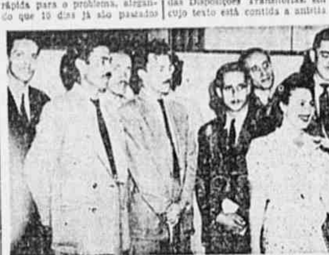
Trabalhadores da Light, de volta da Câmara dos Deputados, falam à nossa reportagem sobre os seus companheiros presos

Trabalhadores da Light falam aos membros da Comissão Parlamentar — Passou para a Justiça Comum o caso dos trabalhadores presos