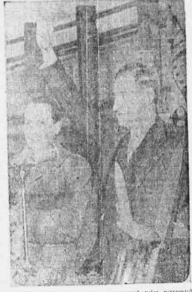
Salazar, remanescente do antigo regime, responsável pelas perseguições e torturas sofridas pelos democratas portugueses, numa parada em Lisboa, fazendo a saudação fascista

COMBATE A CARESTIA — VENDEMOS ROUPAS NOVAS E USADAS RUA TEOTONIO REGADAS 7 TELEFONE 22-6309 LAPA