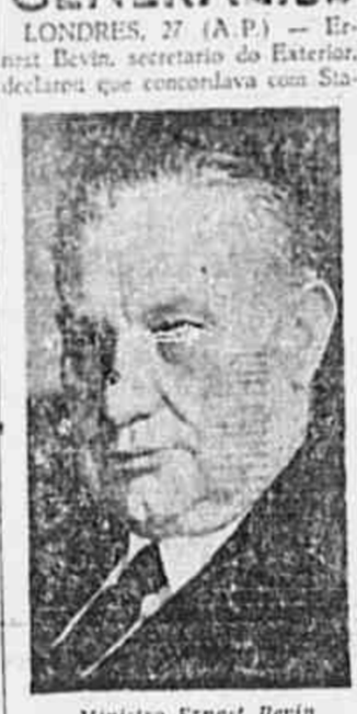
Ministro Ernest Bevin

LONDRES, 27 (A.P.) — Ernest Bevin, secretário do Exterior, declarou que concordava com Stalin em que nenhuma nova guerra é provável no momento. Bevin declarou, em discurso: «Temos, recentemente, uma declaração da Rússia, de que não se prevê que nova guerra seja provável no momento. Eu também não o acho e não sei de ninguém que esteja pedindo uma guerra». Bevin acrescentou, porém: «Há uma espécie de guerra que deve parar, se queremos obter paz — é a guerra de nervos, que deixou alguns países infelizes em estado de perturbação». O secretário do Exterior, que ontem voltou da Conferência de Paris, disse: «O teste não está nos discursos dos estadistas, mas na maneira de encarar, no salão da Conferência, os problemas reais que estamos discutindo. Será ali que descobriremos se as Nações Unidas terão a cooperação que produzirá a união da humanidade».