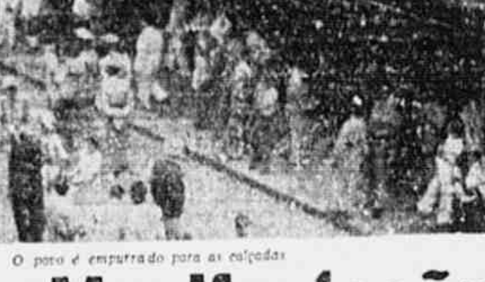
O povo é empurrado para as calçadas

Os vendedores e populares querem conversarmos, nos apresentaram algumas medidas, pedindo-nos para as divulgar a fim de que possam as autoridades responsáveis fazer alguma coisa de concreto no sentido de resolver, ao menos em parte, o problema de Madureira. Aquelas pessoas que vivem o problema, em contacto constante com os seus exploradores podem apenas uma