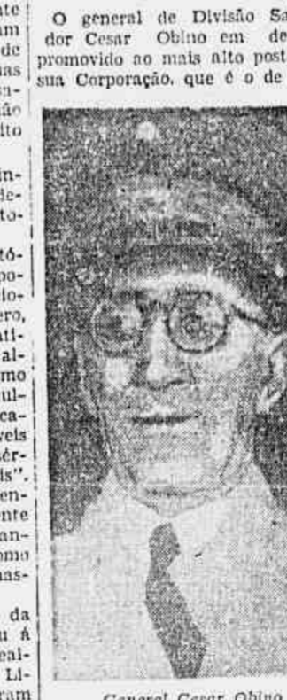
General Cesar Obino

O general de Divisão Salvador Cesar Obino em de ser promovido ao mais alto posto de sua Corporação, que é o de General de Exército, recentemente criado. Soldado ilustre e homem de atitudes democráticas, a sua promoção é um ato de justiça, sem dúvida recebida com a maior alegria por todos os seus camaradas de armas, que ainda recentemente o elegeram para a presidência do Clube Militar.