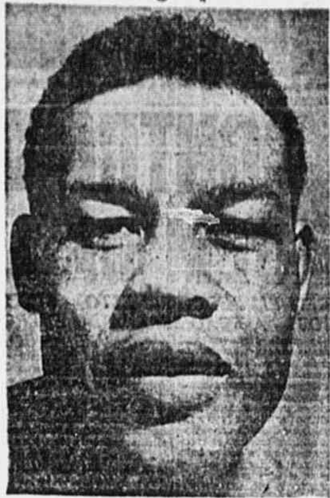
Joe Louis que venceu e se tornou, mais uma vez, o seu título de campeão mundial de peso-pesado.