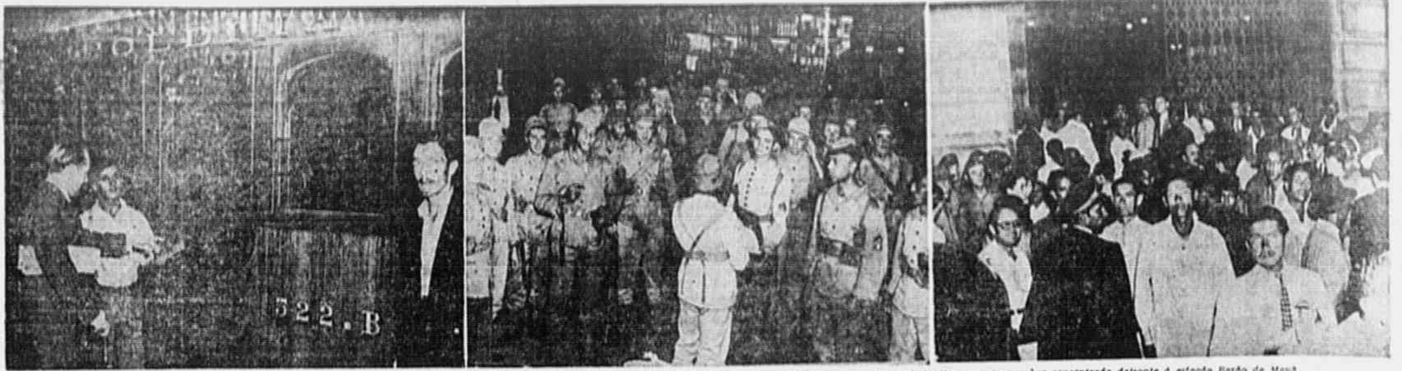
Um funcionário da Leopoldina Railway mostra-nos as depredações praticadas num dos trens. Ao centro, as forças do Exército que restabeleceram a ordem, e à direita, a massa popular concentrada de frente à estação Barão de Mauá.