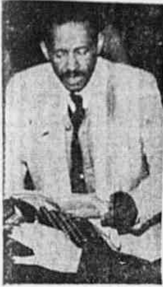
Nos anos de guerra os trabalhadores demonstraram internacionalmente o valor de sua unidade.