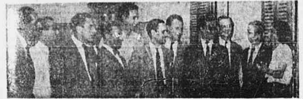
Reunião de associados do Sindicato da Empresa que no comércio hoteleiro, quando em nossa redação fala com a redação.

Numerosa comissão sauda o reaparecimento da TRIBUNA POPULAR - O programa dos candidatos - A Chapa de Unidade - Unida a classe para o Congresso Sindical