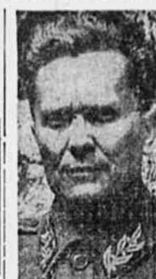
Tito, heroi nacional e presidente da Republica Popular da Iugoslavia.

Pouco antes da proclamação de Gonzalez Videla, o secretário geral do P. C., senador Contreras Labarca, havia dito num discurso no teatro Caupolicán: "Para o Partido Comunista é condição fundamental que o candidato a sair da convenção da esquerda aceite o programa do povo e se comprometa a realizá-lo. O povo tem muito ao ver com desconfiança as promessas dos candidatos. Não deseja ser enganado por uma vez. Por isso devemos dar a garantia de que o candidato governará com as perdas que o elegerem. Isto significa, falando com clareza, que o futuro presidente deverá assumir desde já o compromisso de constituir o seu ministério com os partidos que contribuírem para a sua eleição com o Partido Comunista também, portanto!"