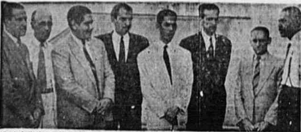
Os trabalhadores da Leopoldina, em nota redigida, quando nos transmitem as declarações que lhes fizera, momentos antes, o senador Melo Viana

QUINTA-FEIRA, 18 DE JULHO DE 1946 ANO II N.º 355