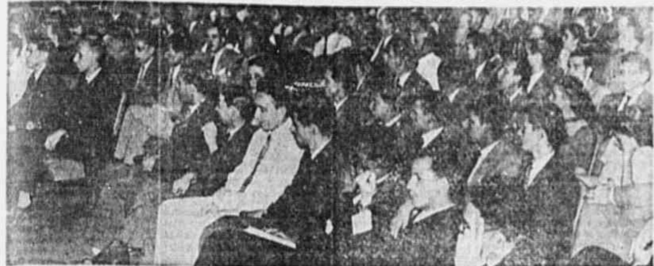
Flagrante da assembleia de ante-onhem, realizada na A. B. I.

Mostrarão ao povo que não são agitadores, mas sim lutadores por condições de vida e de trabalho mais decentes — O representante da U. S. T. D. F. oferece a esta corporação a solidariedade dos demais trabalhadores, organizados nos diversos e numerosos sindicatos, filiados a esta novel entidade