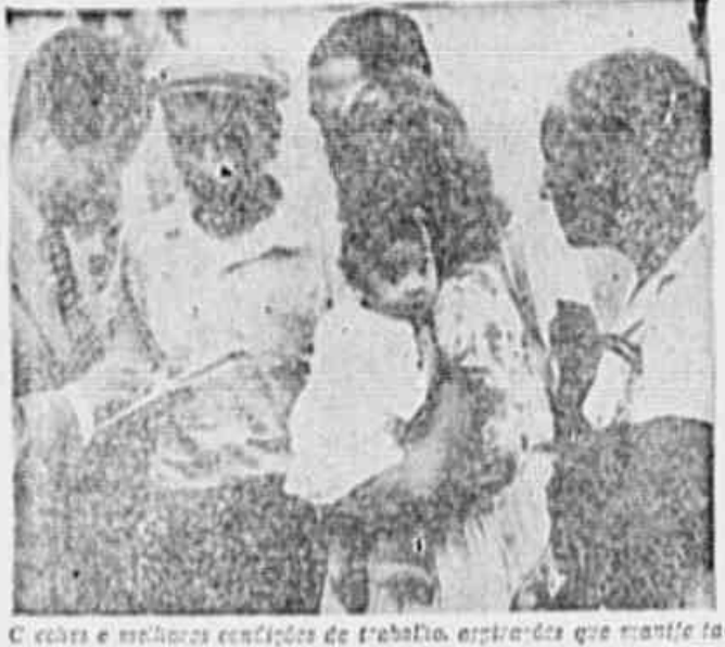
Com as melhores condições de trabalho, esperadas que mantiveram a TRIBUNA POPULAR as operárias que aparecem na gravura

As 11 horas da manhã a rua Souza Franco, em Vila Isabel, enche-se de gente. São as operárias da Fábrica de Tecidos Confiância procurando entrar a força e entrar do lado da saída. Há filas de mulheres do lado da fábrica para fazerem o check-out. Há filas de mulheres do lado da fábrica para fazerem o check-in. Há filas de mulheres do lado da fábrica para fazerem o check-out. Há filas de mulheres do lado da fábrica para fazerem o check-in.