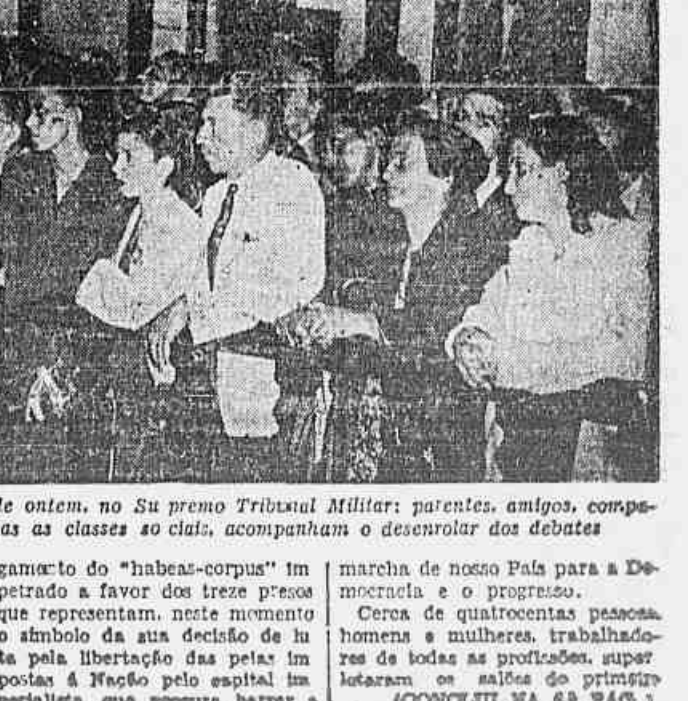
Flagrante durante o julgamento de ontem, no Su premo Tribunal Militar: parentes, amigos, companheiros e elementos de todas as classes ao lado, acompanham o desenrolar dos debates

Ontem, na sessão da Constituinte, mais uma vez foi ventilado o caso da partida de renodutores zebus, de procedência