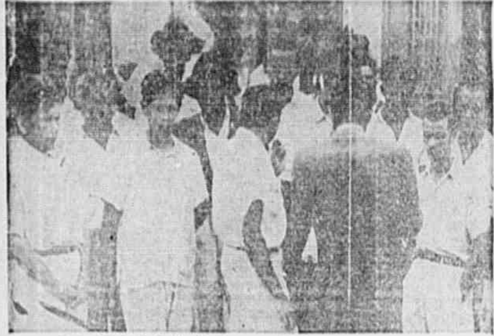
Os operários da Fábrica de Tecidos Confiância, em Vila Isabel, lutam no sentido de obter as suas principais reivindicações.

BONEONNIERE MANON Boutiques e Caracóis de Luxo Ativam para presentes Meirelles & Cia. Ltda. LARGO DA CATHOICA 16 Tel. 22.1192