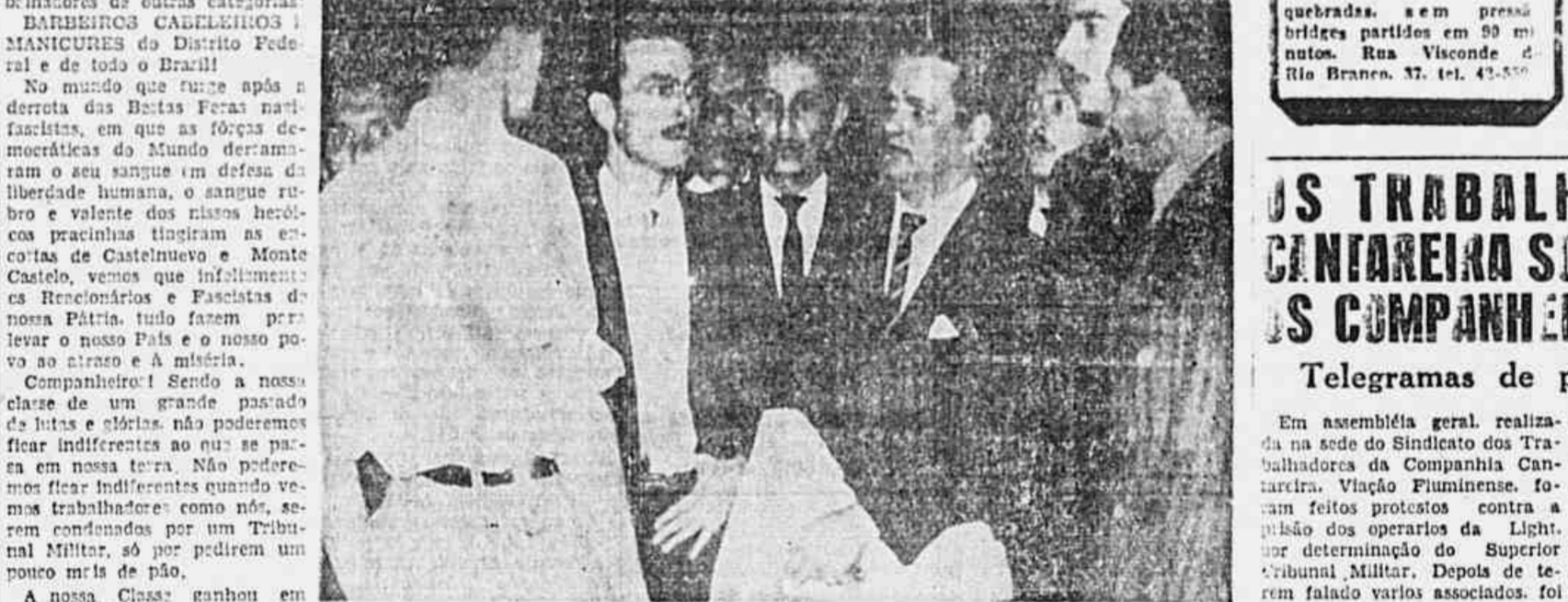
LUTAM OS BARBEIROS PELA LIBERTACAO DOS TRABALHADORES PRESOS. discursaram os membros da comissão que aparece neste clichê e que vieram à nossa redação fazer a entrega de um manifesto que o grupo de sindicalistas dirigiu à classe e ao proletariado em luta pela conquista e ampliação de sua liberdade democrática. Na mesma ocasião da visita, os barbeiros entregaram-nos a quantia de 45 (quarenta e cinco) cruzeiros, fruto de uma coleta realizada entre si, destinada às famílias das vítimas da Light.

Manifesto á classe e aos companheiros de outras profissões