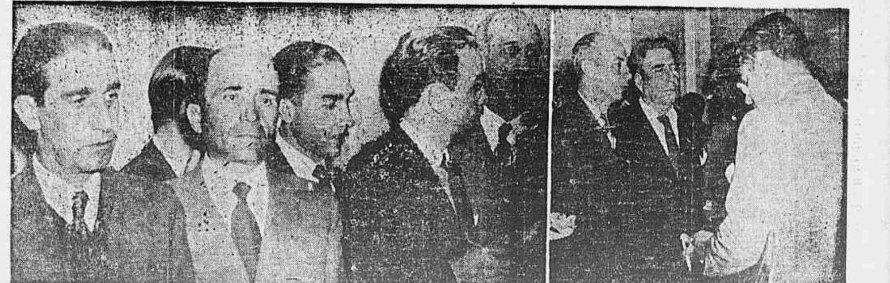
Flagrantes dos parlamentares, ontem, no Palácio Guanabara, minutos após sua audiência com o Presidente da República

A Comissão Parlamentar designada pela Assembleia Nacional Constituinte para acompanhar a questão dos trabalhadores da Light não deu ainda por encerrada a sua missão. Encontrando decidida resistência por parte da empresa em apresentar termos aceitáveis para uma resolução que conserte os interesses dos trabalhadores, a Comissão, em sua última reunião no Palácio Tiradentes, tomando conhecimento dos