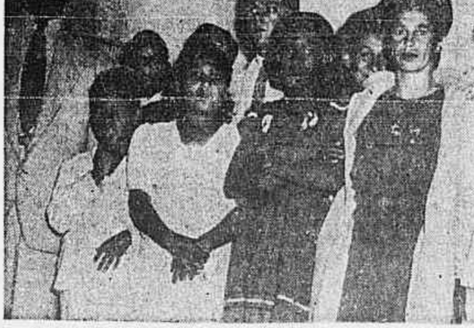
O BLOCO CARNAVALESCO MISTO UNIDO DA PROVIDENCIA fará realizeir, no próximo dia 22 de junho, ante-respêr, de S. João, um grande baile em homenagem ás famílias pernambucanas...

«E' assunto que não cabe ao amigo nem a mim ventilar ou resolver».