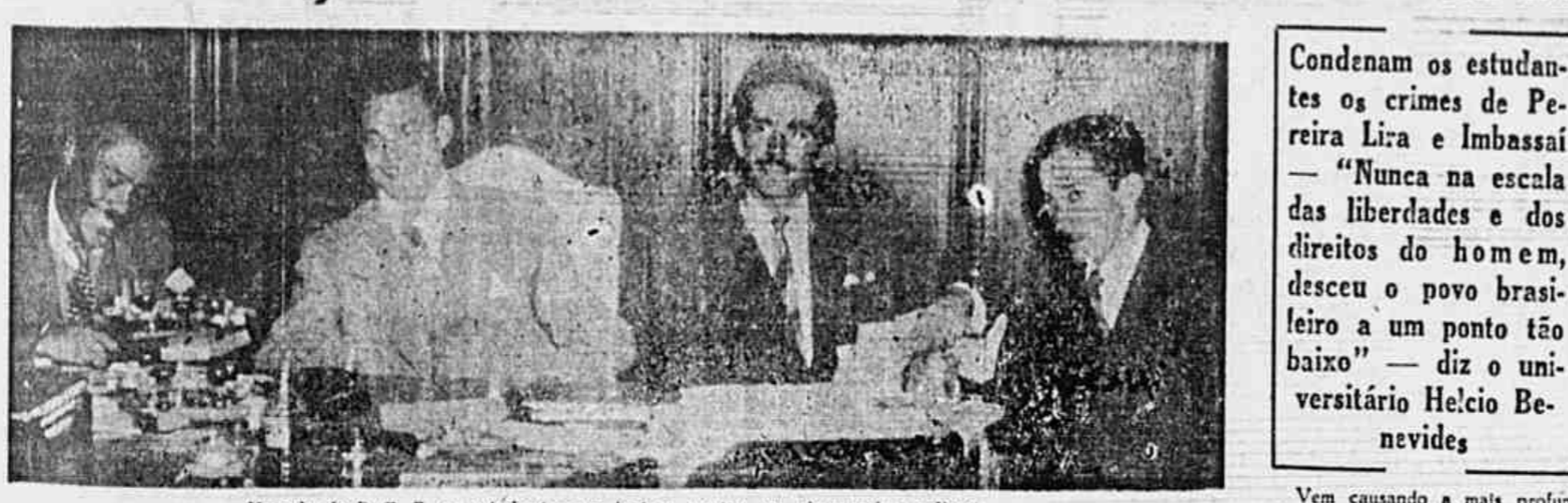
Na sala do D. C. E., os estudantes protestam contra os desmandos policiais