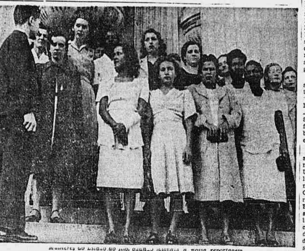
Mulheres do Estado do Rio, quando estavam a nossa reportagem