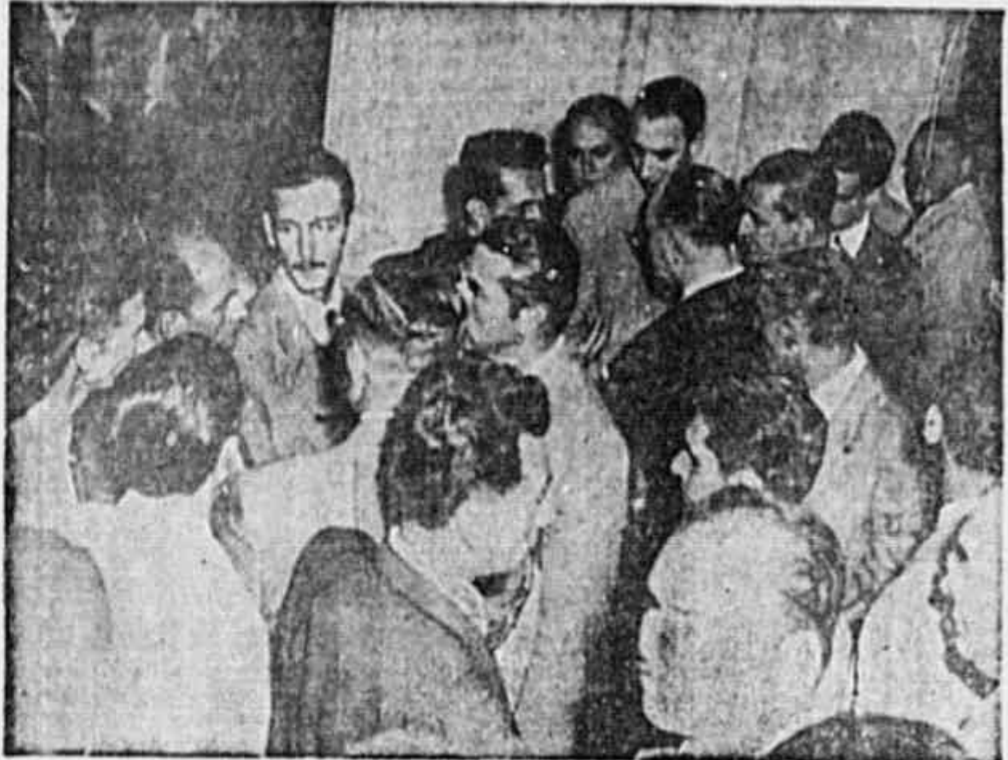
GRUPO FLAGRANTE TOMADO NO PALACIO TIRADENTES, quando os trabalhadores da Light falavam aos parlamentares, mostrando-lhes os ferimentos e as marcas das torturas e espancamentos de que foram vítimas na rua da Relação e de que são responsáveis os fascistas Imbassai e Pereira Lira.

ANO II ☆ N.º 319 ☆ QUINTA-FEIRA, 6 DE JUNHO DE 1946