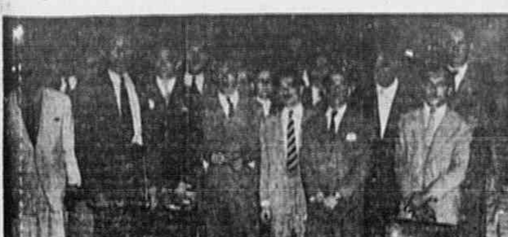
MORADORES DO BAIRRO DA LIRA E DA PRAÇA DA BANDEIRA em numerosa comitiva, estiveram ontem em nossa redação...