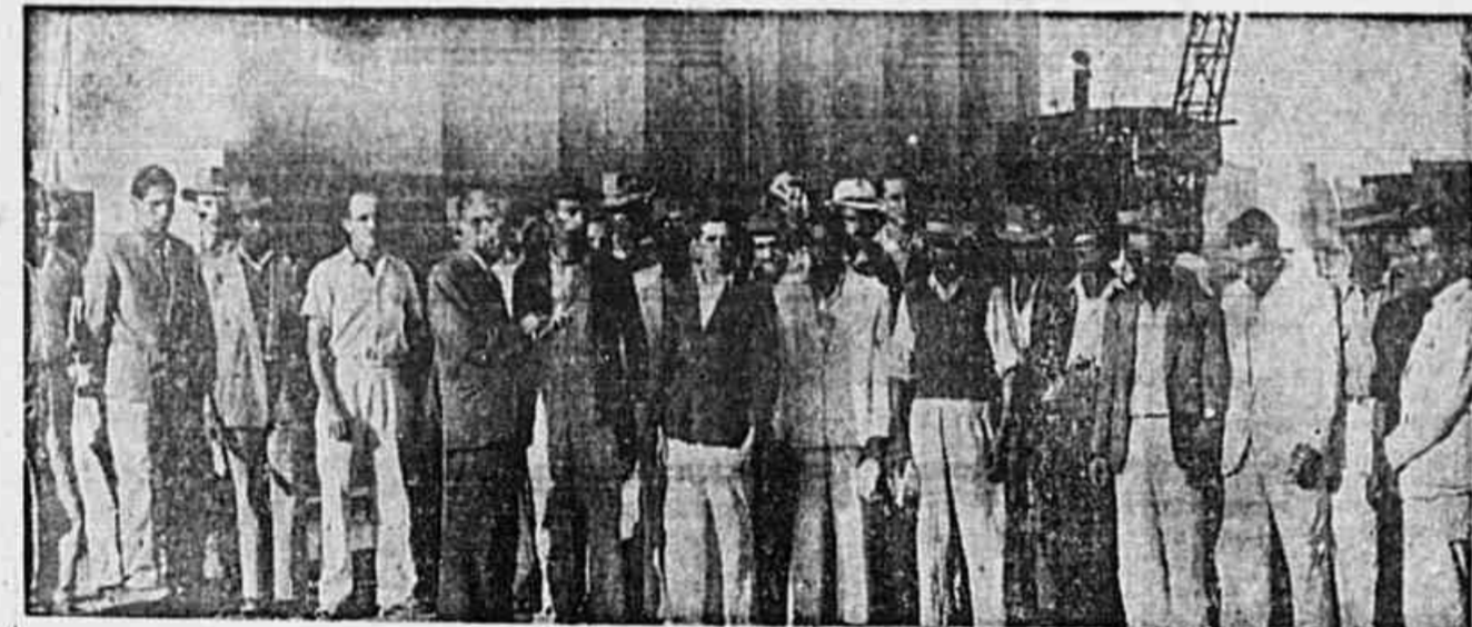
Operários da Organização Lage, que ontem se declararam em greve pacífica

Os operários, cansados de esperar pelo aumento prometido, declaram-se em greve pacífica