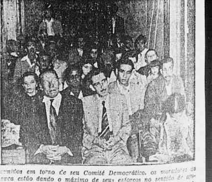
Reunidos em torno do seu Comitê Democrático, os moradores do bairro de São João do Rio, quando estavam a nossa reportagem

Nossa visitante pede ás autoridades competentes uma pensão para o seu marido, a fim de que se possa tratar, e não morrer aos poucos, á mingua de amparo do Governo.