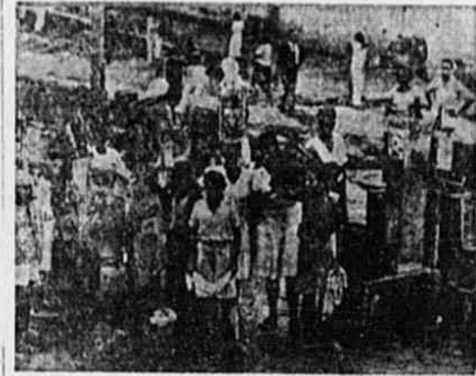
Quando há notícia de que a bica está dando água, todos os moradores correm com a lata na cabeça

Nesse sentido já foi enviada há meses, ao Prefeito Hildebrando de Góis, um longo memorial, contendo das principais reivindicações do morro, e acentuando o caráter insubornável da instalação de uma caixa d'água, única maneira de resolver o problema da água, no