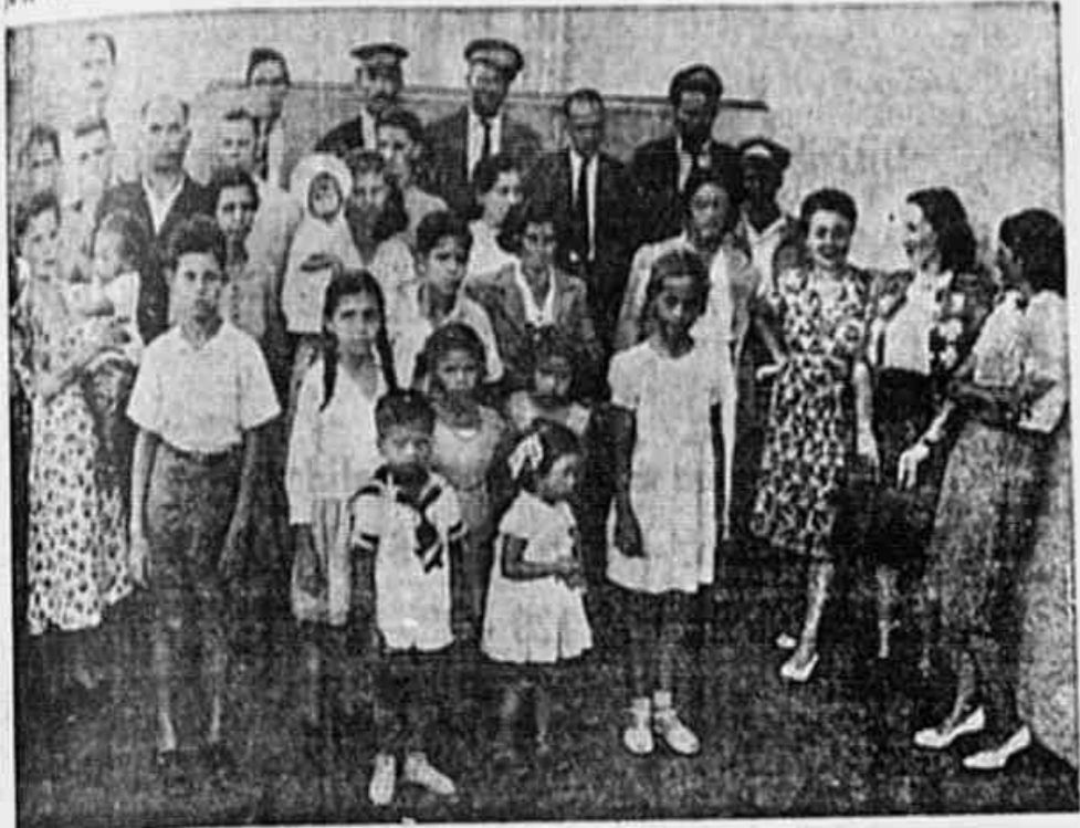
As mães de trabalhadores da Light, com seus filhos, que visitam a nossa redação com a missão de não ser mais possível esperar por muito tempo uma solução por parte das autoridades. Tudo tem faltado e seus filhos e maridos são dizimados pela tuberculose

aumento não diminuiu. Ao contrário, recrudescer. Ainda agora, as mães e filhos dos operários da Light foram pessoalmente ao Palácio Tiradentes entregar à Comissão de Inquirição da Constituinte um memorial pedindo fossem apressados os seus trabalhos.