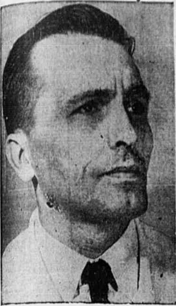
LUIZ CARLOS PRESTES