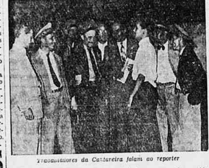
Trabalhadores da Cantareira fazem ao repórter

Derrotada pelo operariado, recorreu para a instância superior — Criminosa manobra para levar ao desespero os seus empregados — Enérgico protesto da classe