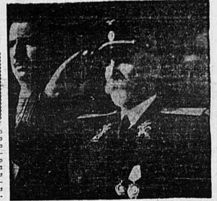
Na primeira gravura, ao alto, o Embaixador soviético quando desceu do automóvel, em frente ao Palacio do Catete, para apresentar suas credenciais. Em baixo, o sr. Yacov Suritz em continência ao Hino da República do Brasil

Realizar-se-á hoje, às 13 horas, no Churrascaria Gaucha, o almoço de confraternização promovido pelos jornalistas e amigos deste jornal em comemoração da data democrática que hoje transcorre.