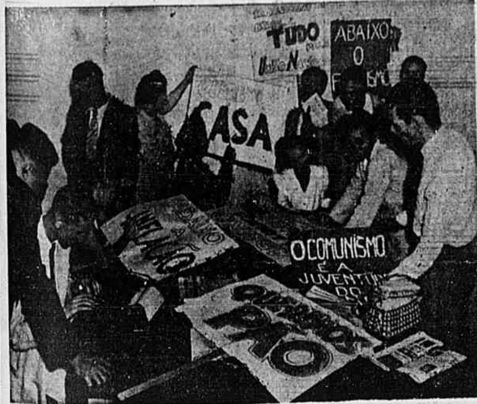
No Comitê Distrital Centro do Partido Comunista Brasileiro trabalham ativamente as diversas comissões do grande comício de amanhã

Prestes indicará ao povo as soluções dos problemas nacionais - Intensa atividade em todos os organismos do Partido Comunista - Um manifesto dos trabalhadores intelectuais do P. C. B. - A Comissão de Finanças lança um apelo