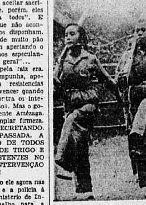
MEMBROS DA TROPA FEMININA DA INDONÉSIA, conforme se vê na gravura acima, fazem exercícios militares em Java...