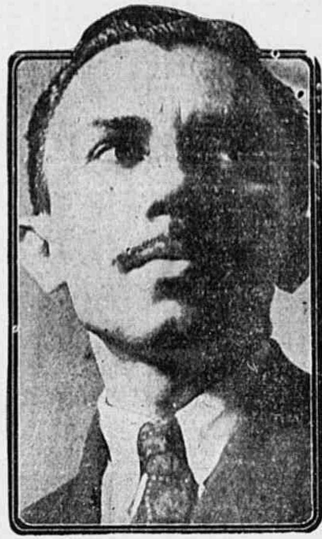
Deputado João Amazonas