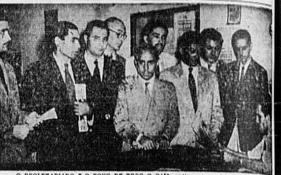
O PROLETARIADO E O POVO DE TODO O PAIS continuam a enviar às autoridades competentes e à Assembleia Nacional Constituinte telegramas em que expressam o seu mais veemente protesto contra a reação policial desencadeada contra os estivadores de Santos, o que constitui um bem uma afronta aos trabalhadores de todo o Brasil. Ainda ontem esteve em nossa redação um grande comitê de ferroviários que, após reafirmar a sua inteira solidariedade aos estivadores de Santos e protestar, ao mesmo tempo, contra as violências de que são vítimas por parte da polícia, asseguraram estar dispostos a dar toda a ajuda possível ao General Dutra, desde que o Governo se liberte dos fascistas que o cercam e caminha para a democracia, em vez de se apressar a ameaçar os trabalhadores e o povo em geral, como tem fazendo o sr. Negrão de Lima, Pereira Lima, Imbaryhy e outros, aproveitando a ocasião, para entorpecer, por intermédio da TRIBUNA POPULAR, as suas boas-vindas ao primeiro Embaixador da União Soviética no Brasil, sr. Jacob Suritz. No clichê, um flagrante ocorrido no momento em que aqueles trabalhadores se

"Aos valentes estivadores do porto de Santos, honra e orgulho do proletariado brasileiro, quatrocentos e cinquenta portuários do cais do Rio enviam a sua saudação fraternal na grande luta em que se empenham em defesa da democracia em nossa Pátria e contra os opressores e carrascos da classe operária, os reacionários e restos fascistas que, entre o assassino Franco e os trabalhadores de sua terra, preferiram ficar ao lado daquele. Solidários com os companheiros, asseguramos o nosso mais