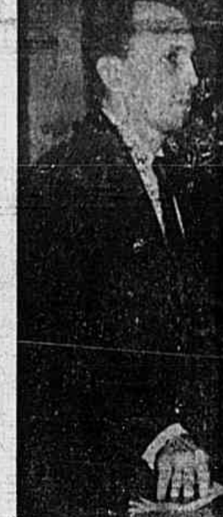
Flagrantes de ontem na A. B. I.: à esquerda, o Senador Luiz Carlos Prestes e, à direita, aspecto parcial da assistência

morando-se, porém, mais detidamente, nos tempos em que ele cortou, ao lado e sob o comando da Paixão Cearense, e, neste sentido, peço a todos, em nome da mesa, um minuto de silêncio."