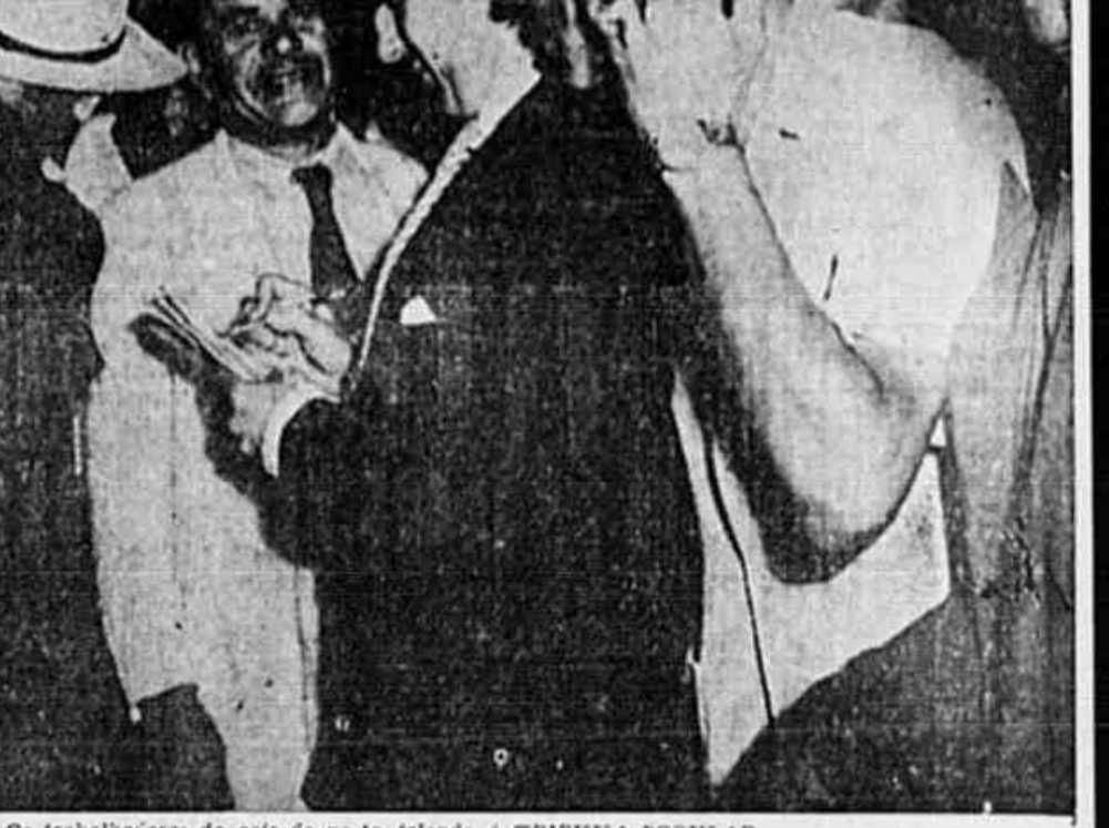
Os trabalhadores do cais do porto falando à TRIBUNA POPULAR

— As manifestações de solidariedade, o "pomba a foice", não seguem "obediência" portuária e estivadores de Santos, a lutar a trabalhar nas embarcações