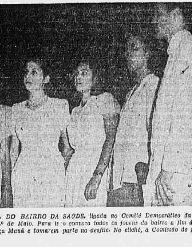
A COMISSÃO JUVENIL DO BAIRRO DA SAUDE, ligada ao Comitê Democrático da Saúde, comemorará, também, o 1º de Maio. Para isto convocou todos os jovens do bairro a fim de, incorporados, se dirigirem à Praça Mauá e tomarem parte no desfile. No clichê, a Comissão de jovens que esteve em nossa redação.