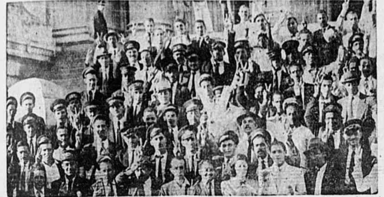
OS TRABALHADORES DA LIGHT CONFIAM nos representantes que elegeram para defender os seus direitos na Constituinte. Mais de 200, reunidos nas escadarias do Palácio Tiradentes, posam para o fotógrafo de nosso jornal, mostrando no V da vitória a certeza de que a Light, desta vez, será vencida pelo povo e pelo proletariado livre de uma Pátria livre.