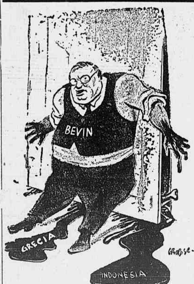
Na gravura acima — notável caricatura de Gropper — aparece Mr. Bevin, que declarou na ONU que receberia bem uma invasão da Grécia e na Indonésia. Na verdade, ele treme de horror, pensando no sangue e nos cadáveres dos patriotas gregos e Indonésios sacrificados á politica imperialista inglesa.

Todos á grande concentração na Praça Mauá, do onde, ás 17 horas, impreteavelmente, partirá o desfile da Unidade do Proletariado e do Povo neste 1º DE MAIO DA VITORIA. A COMISSAO PERMANENTE DO CONGRESSO SINDICAL DOS TRABALHADORES DO DISTRITO FEDERAL