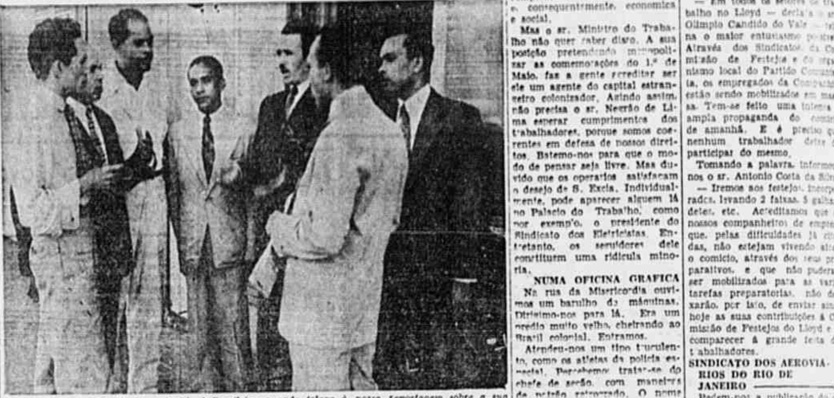
A Comissão de trabalhadores do Lloyd Brasileiro, quando falou a nossa reportagem sobre a sua participação na festa de amanhã