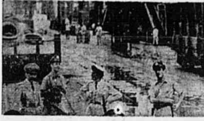
Soldados da Polícia Especial e guarda civil, que forçaram trabalhadores do cais a descarregar o navio fascista.