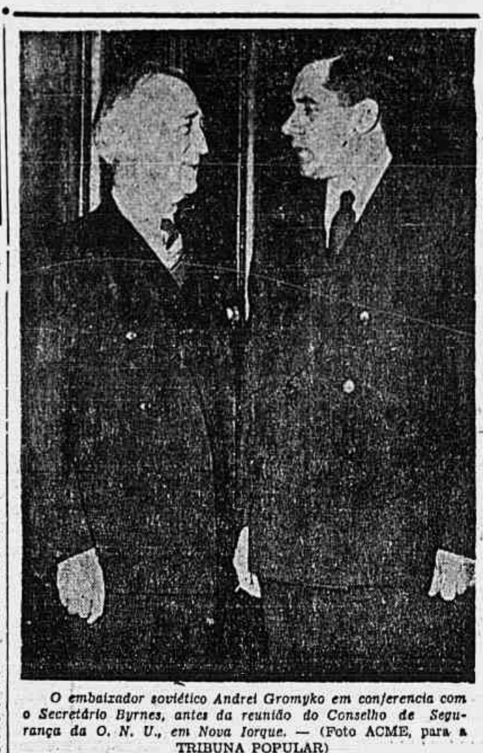
O embaixador soviético Andrei Gromyko em conferência com o Secretário Byrnes, antes da reunião do Conselho de Segurança da O. N. U., em Nova Jorque.

Prepara-se um clima de exaltação guerreira visando o PCB e particularmente Luiz Carlos Prestes, cuja eliminação física já é reclamada através de alguns jornais pelos reacionários fascistas — Essa monstruosa conspiração não visa apenas os comunistas, pois ameaça a marcha da democracia em nosso país — Contra manejos tão criminosos devem-se unir homens e Partidos, todos os brasileiros que estejam dispostos a lutar, opondo-se à entrega de nossa Pátria a banqueiros internacionais