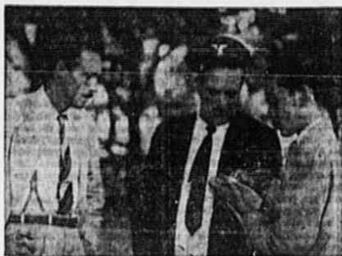
Os taxistas de Carioca, motoristas jalani a nossa reportagem

Referindo-se a campanha afirmou: — Não podemos viver com os vencimentos que percebemos com a atual tabela. Tudo aumentou, consideravelmente: gêneros alimentícios, utilidades, tudo. A mesma, as peças de automoveleiros, etc.