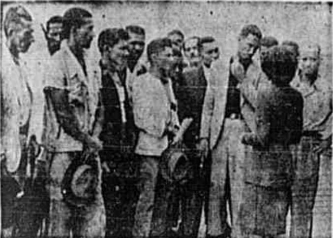
Trabalhadores do cais protestam, contra a odiosa atitude de polícia obrigando trabalhadores a descarregar o navio fascista.

Presos diversos trabalhadores, cujo paradeiro é ignorado — De metralhadoras em punho, a Polícia Especial faz ameaças e executa violências no Cais do Porto — Telegramas de protesto às autoridades