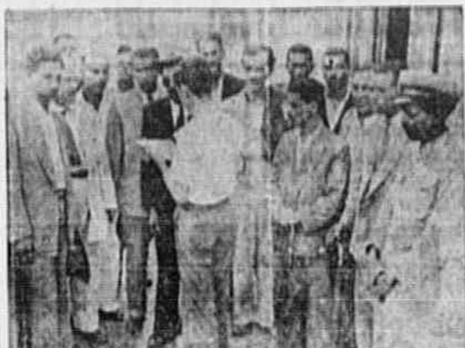
Uma das comissões de trabalhadores do Porto protesta contra o emprego de força pela polícia para servir ao esquadrão Franco

11. — A Comissão Executiva do Partido Comunista do Brasil