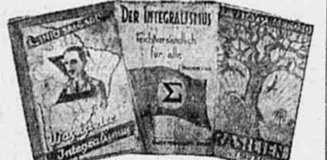
O integralismo em lingua alemã... Não é por acaso...