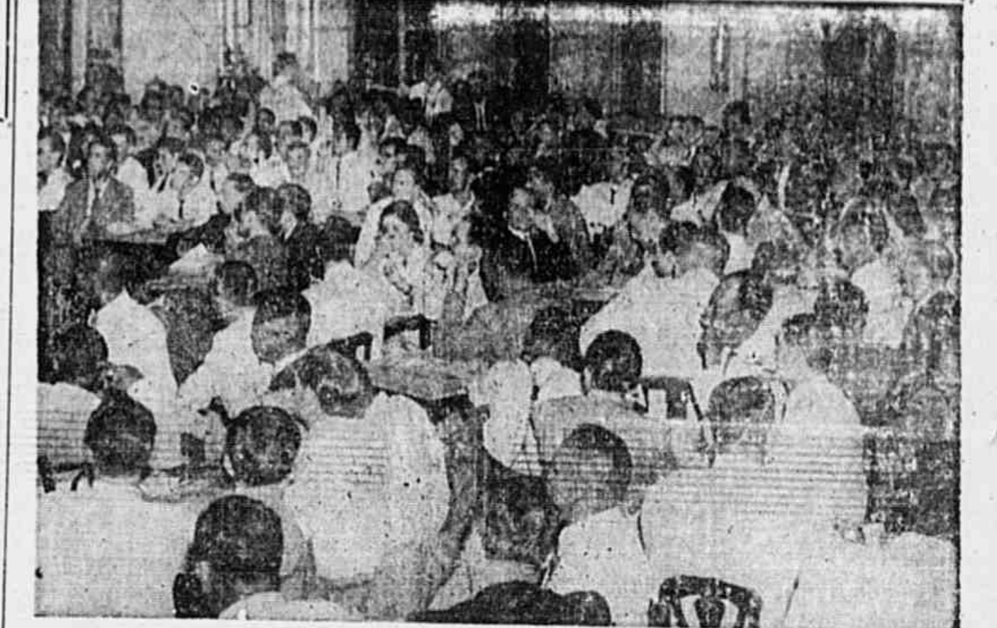
Aspecto dos trabalhos preparatórios da instalação do Congresso Sindical

Numa demonstração flagrante dos métodos de que lançam mão os pasquins reacionários em suas campanhas caluniosas contra os comunistas e o seu Partido, desrespeitando o público, forjando as mais deslavadas mentiras com a maior sem-cerimonias e exemplo de "diário da noite", "O Radical" é dos mais claros. Assim, essa folha, que se está arvorando em órgão oficial do "trabalhismo", iludindo ainda a uns poucos setores do proletariado menos esclarecidos, acaba de dar uma forte cabeçada, ao forjar uma entrevista imaginária que lhe te-