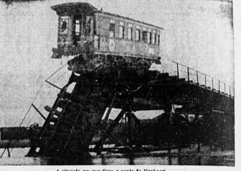
A situação em que ficou a ponte de Itanhaem