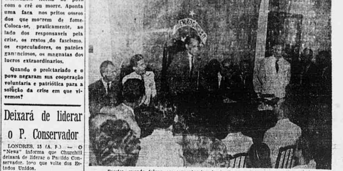
Realizou-se ontem, na sede da Associação dos Escriventes da Justiça, uma sabatina entre os funcionários da Justiça e o senador Luiz Carlos Prestes. Depois de uma rápida análise sobre a situação nacional. Prestes pôe-se a disposição de todos os que quiserem fazer perguntas. A primeira delas foi sobre a situação do funcionalismo da Justiça no Estado Soviético, e o Secretário Geral do P. C. B. responde que na URSS todos são funcionários do Estado, desde o operário até o mais alto funcionário, existindo, portanto, uma igualdade completa, entre todos. Outras perguntas foram feitas, de interesse nacional. Uma de (CONCLUI NA 2.ª PAG.)

As ameaças contra o povo — Provoações visando o MUT — Mundialmente, a correlação de forças favorece a democracia — A posição dos comunistas caso houvesse uma guerra anti-soviética