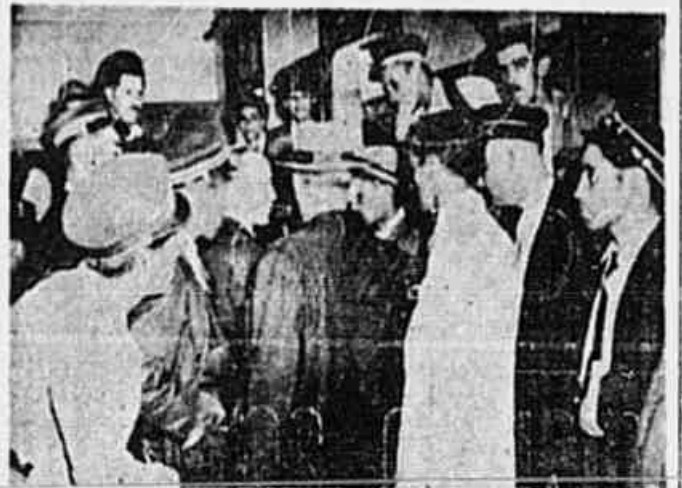
Trabalhadores da Light condenam os métodos desumanos utilizados pela Light

jovem condutor, que acabara de chegar. Trazia a cabeça coberta de gas e esparadrapo e o boné, que levava numa das mãos, estava machucado de suor e de sangue. Perguntamos-lhe a origem dos seus ferimentos, e ele