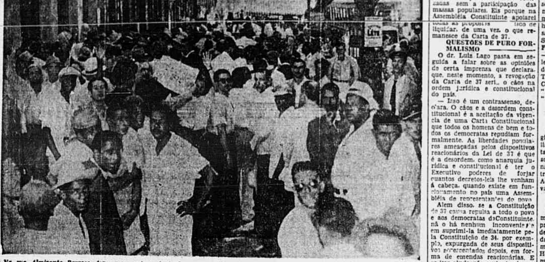
No rua Almirante Barroso formou-se, ontem á tarde, enorme fila de vendedores ambulantes que pretendiam tirar licenças

Além disso, a Constituição de 37 revoga a toda o povo e aos democratas a Constituinte não há nenhum inconveniente em supri-la imediatamente pela Constituição de 34. Por exemplo, expurgada de seus dispositivos preconstitucionais, em forma de emendas reacionárias. E se isso ainda não contenta, é possível encontrar-se outra fórmula jurídica, como a elaboração de uma Lei Constitucional, que regule as relações entre o legislativo e o executivo e esclareça nitidamente os direitos dos cidadãos. E concluindo nos dias de deputado Luiz Lago: - A questão é como a Constituinte deve agir para afastar da nascente democracia brasileira possíveis ameaças. E isso sabemos como - lutando contra a carta de 37, pela sua revogação imediata e pela ampla soberania da Constituinte. Tudo mais é questão de puro formalismo.