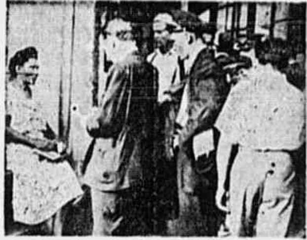
A vida de um condutor recebe, numa caixa de charutos, auxílios para a sua manutenção e a de seus filhos

Na estação de bondes do Largo do Machado, num dos intervalos da luta cruel de todos os dias, centenas de condutores conversam com um repórter da TRIBUNA POPULAR. Pelos bancos, os colegas mais esgotados pelo trabalho de um dia todo sob um sol intenso, dormiam a sono solto. As queixas, as lamentações, os casos surgiam sem interrupção. — A Light é a empresa mais reacionária da América do Sul! Quem assim nos falava era um