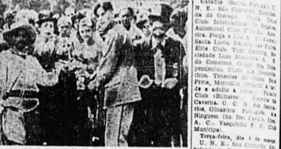
MAMA NA BURRA - Rei Nomo tomou conta da cidade. Oitem, desde cedo, foram vistos blocos na rua. O primeiro a sair foi o "Embriague do Socorro", que saiu para a rua ás 7.30 horas. As primeiras horas da tarde realizo-se o esperado desfile do "Allo-Mama na Burra". O poderoso conjunto percorreu as principais ruas da cidade e visitou diversas redações de jornais. Fim do desfile, no salão do Samba-Danças. Ali foram homenageados pelos padrinhos e madrinhas "Independentes". Depois foi realizada uma tarde dançante que se prolongou até ás 18 horas. No clichê acima temos um flagrante apanhado quando o "Mama na Burra" desfilava por uma das ruas centrais da cidade.