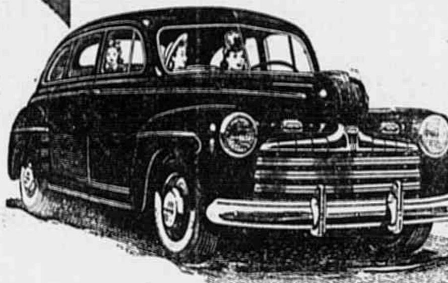
FORD MOTOR COMPANY EXPORTS, INC.