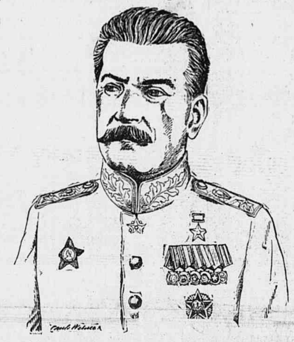
O generalissimo Stalin, candidato da circunscricao eleitoral de Moscou, nas eleições de hoje na U.R.S.S.

"É vossa tarefa julgar se o Partido tem trabalhado, se está trabalhando satisfatoriamente e se ainda pode trabalhar melhor" — O desenvolvimento da ciencia e os novos planos de produção — Carater da guerra