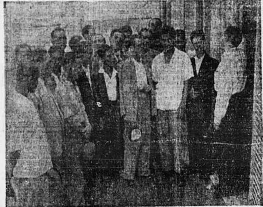
Trabalhadores das firmas Otis e M. S. Lino, que se declararam em greve há alguns dias, na redação da TRIBUNA POPULAR