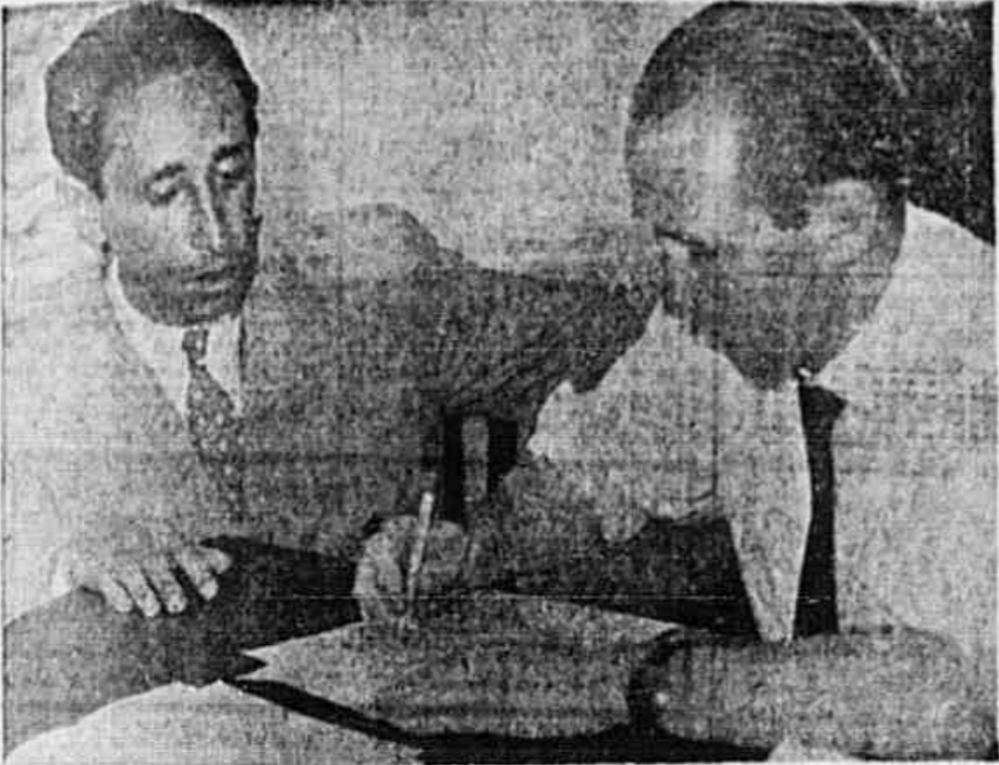
Presidente do Sindicato dos Trabalhadores na Indústria de Calçados do Recife, quando falava ao redator da TRIBUNA POPULAR.